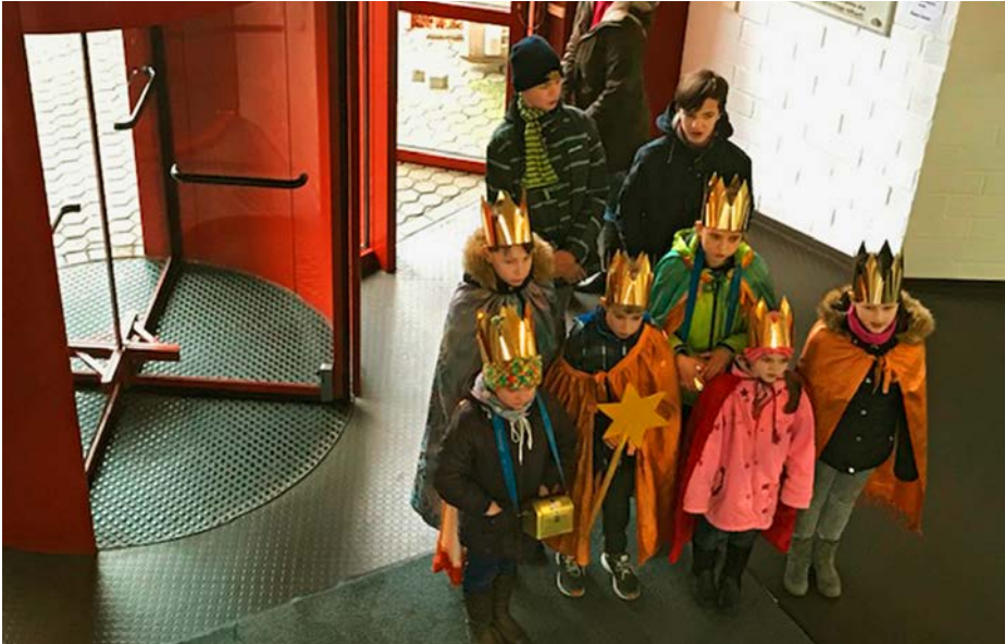
Anfang Januar 2019 besuchten die Aachener Sternsinger aus den Pfarren Apollonia und St. Severin die Malteser in der DGS sowie im Bildungszentrum und der Stadtgeschäftsstelle.

teser Hilfsdienstes aus Mönchengladbach vor Ort.