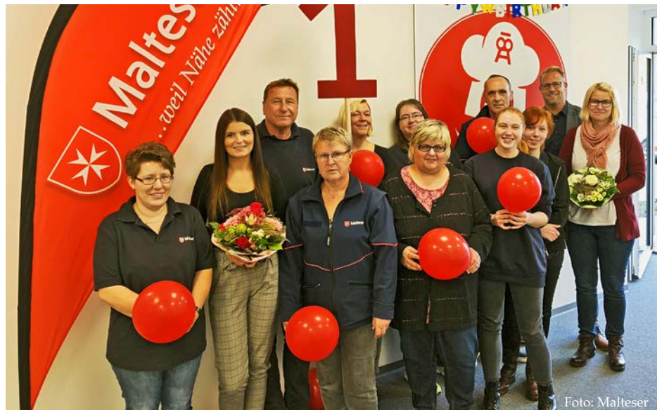
Die Mitarbeiter der Menüservice-Zentrale können auf ein erfolgreiches erstes Jahr zurückblicken.

DIÖZESE. 50 Malteser folgten der Einladung zur 30. Diözesanversammlung in Bochum-Leithe. Diözesanleiter Axel Lemmen begrüßte die Teilnehmer und schnitt bereits einige Höhepunkte der vergangenen zwei Jahre an. Dazu gehörten die Eröffnung der Malteser Medizin für Menschen ohne Krankenversicherung in Duisburg, die Flüchtlingshilfe in ver-