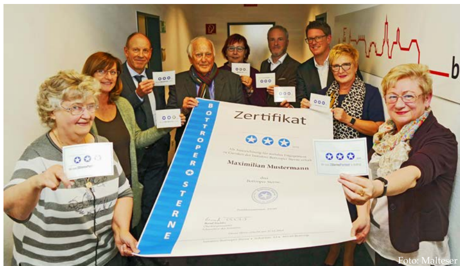
Die Bottroper Sterne präsentieren ihren Stern für 2019.

BOCHUM. Das integrative Chorprojekt „Just Sing“ wird auch in 2019 fortgesetzt. Unter der musikalischen Leitung von Christiane Hartmann laden die Malteser und die Schiller-Schule Bochum zum gemeinsamen Singen ein. Bereits zum dritten Mal treffen sich Menschen aus unterschiedlichen Kulturen, um ein Repertoire zu erarbeiten, das bis Juni 2019 eingeübt und mehrmals vor Publikum aufgeführt wird. Neben dem musikalischen Beisammensein soll eine Begegnungsstruktur zwischen Menschen verschiedener Kulturen entstehen.