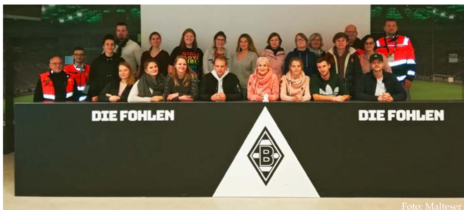
Die zweite Ausbildungsgruppe aus dem Evangelischen Krankenhaus Bethesda der Johanniter GmbH beim Unterricht im Presseraum der Borussia

Praxistage und Schulprojekte sind Teil eines bewährten Konzeptes im Rahmen der dreijährigen Ausbildung zur Gesundheits- und Krankenpflege oder Kinderkrankenpflege am SGN. Die Träger des Schulzentrums, die Städtischen Kliniken Mönchengladbach GmbH und das Evangelische Krankenhaus Bethesda der Johanniter GmbH, unterstützen solche Projektstage schon seit vielen Jahren mit sichtbarem Erfolg in der Ausbildung. Die Auszubildenden können durch solche Praxistage eine gute Verbindung von Theorie und Praxis herstellen und reagieren in Notfallsituationen innerhalb der Kliniken ruhig, konzentriert und gut