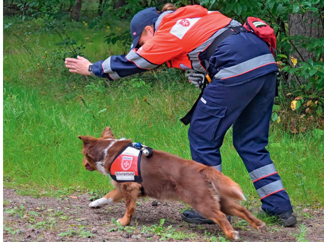
Training in der Fläche: Ekaterina Geiß mit Australian Shepherd Pepper