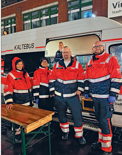
Das Team des Kältebusses bei einer Tour durchs abendliche Kiel