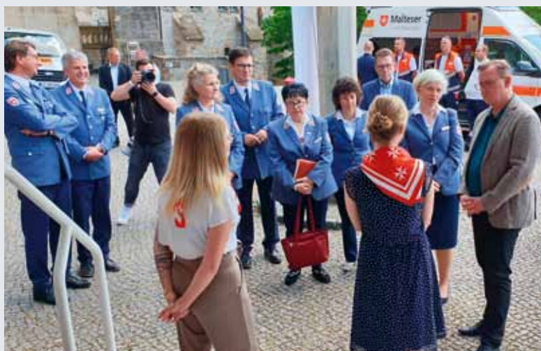
Ministerpräsident Bodo Ramelow im Gespräch mit Maltesern

Gefeiert hat aber nicht nur die Diözese. Auch die Malteser Jugend Erfurt kann inzwischen auf 30 Jahre zurückblicken – und feierte bei strömendem Regen eine ausgelassene Hausparty.