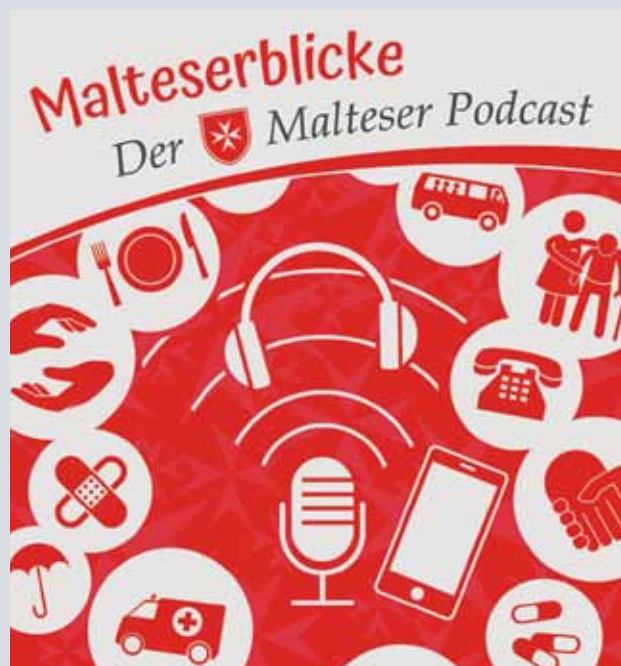
Grafik: Stephan Hamusch / Malteser