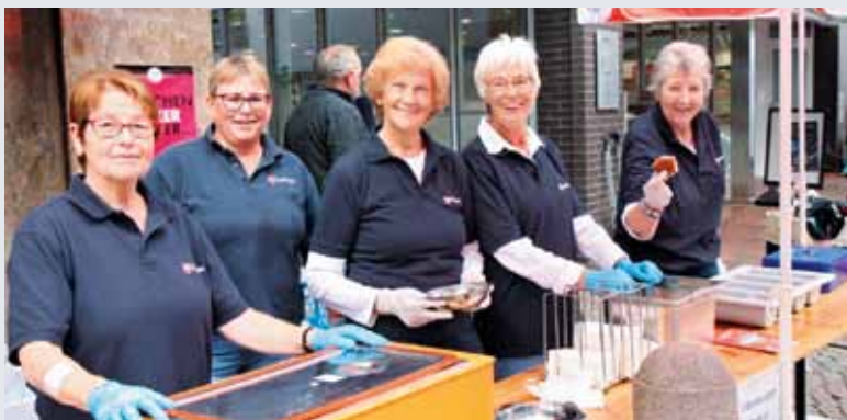
Mit Freude dabei: die Damen vom Lohner Blutspendeteam