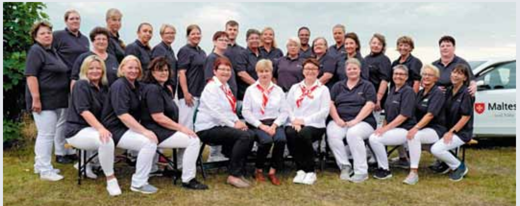
Das Jubiläumsteam vom Malteser Pflegedienst in der Wesermarsch

Auf 25 Jahre Dienst am Nächsten konnte das Team der ambulanten Pflege der Malteser in der Wesermarsch am 16. September zurückblicken. Aus bescheidenen Anfängen, damals noch gemeinsam mit der Caritas als Sozialstation „Regenbogen“, wuchs ein Dienst, der von seinen Standorten in Nordenham und Brake aus mit 34 Frauen und einem Mann 150 Menschen in der Wesermarsch betreut.