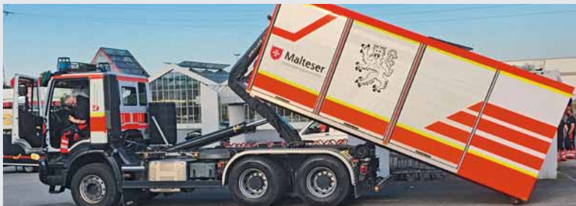
Wechsellader in Aktion