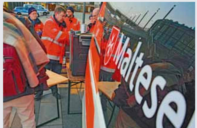
Abstand halten! Das Gebot der Stunde

Am letzten Donnerstag des März konnten die Malteser sogar besonders lecker aufstischen. Hühnerfrikassee stand auf dem Speiseplan und die beliebte Nudelsuppe war ausnahmsweise mit Klößen angereichert. Zum Nachtisch gab es Äpfel und Bananen – Spenden von „Josephs Restaurant“ im Dorfgemeinschaftshaus Breitenbeck und des Großmarktes Hannover. Sowohl Re-