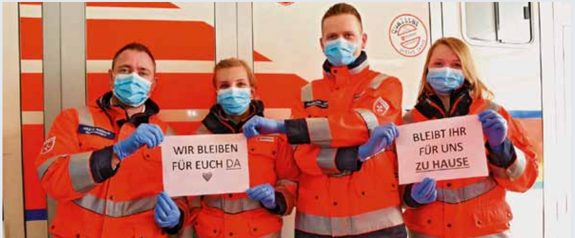
Das Malteserteam in Bramsche fordert auf: Stay home!