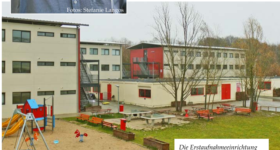
Die Erstaufnahmeeinrichtung „Neuer Höltigbaum“