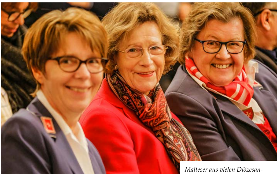
Malteser aus vielen Diözesangliederungen waren nach Hannover gekommen.