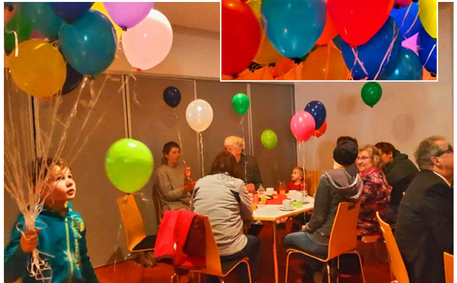
Im Anschluss an die Gedenkfeier bot die Marienkirche den Trauernden die Möglichkeit zur Begegnung und zum Austausch. Ein bunter Gruß an Luftballons wurde nach der Gedenkfeier gen Himmel gesendet.

Im Sommer 2018 wurde die Erfüllung dieses Wunsches konkreter. Ein breites Netzwerk an Unterstützern, die in Cottbus ebenfalls in der Hospiz- und Trauerarbeit aktiv sind, akquirierend begann die Organisation einer übergreifenden Veranstaltung. Gemeinsam wurde die Feier vorbereitet und gestaltet, die das Gedenken