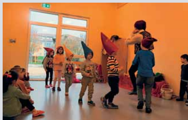
Einblicke in das Mitmachttheater von „Galli“ in der Malteser Kita St. Martin.

Das Märchen wurde nicht nur erzählt, die Kinder wurden aufgefordert, die Geschichte gemeinsam zu spielen. „Das fördert nicht nur die Sprachkompetenzen der Kinder, sondern auch die Teamkompetenz und das soziale Verhalten“, weiß die Kita-Leitung. So spielten Kinder im Alter von zwei bis sechs Jahren Schneewittchen, Zwerge, Wildschweine und