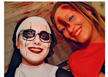
Bei den Maltesern findet man oft Freunde fürs Leben.