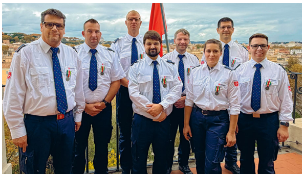
Das unterfränkische Sanitätsdienst-Team nach der Ehrung durch den Malteserorden im Magistralpalast auf dem Aventin im November