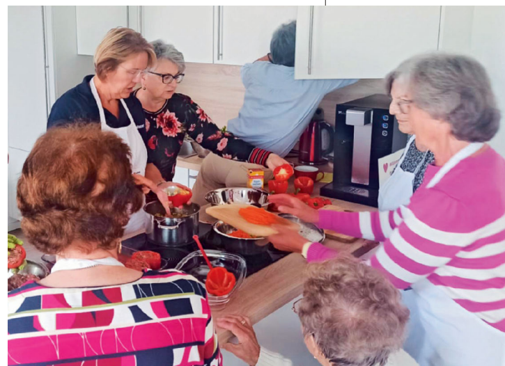
Gewusel beim gemeinsamen Zubereiten von gefüllten Paprika

Im Buch finden sich ganz alte bayrische Rezepte, aber beispielsweise auch welche aus Südtirol, Rumänien und sogar aus Thailand.