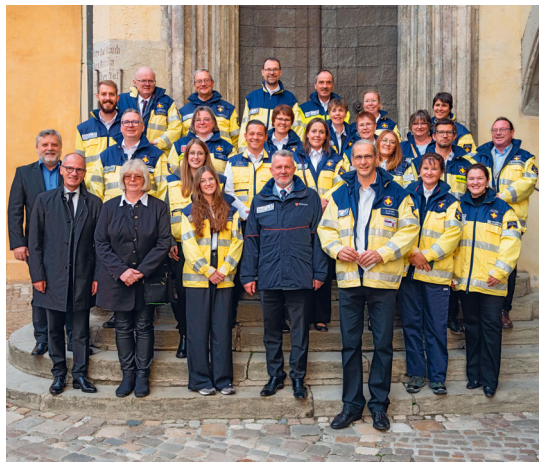
Gefeiert wurde im historischen Reichssaal der Stadt Regensburg.

Die Notfallseelsorge und der Kriseninterventionsdienst helfen nicht durch Medikamente und Arzneien, sondern durch das persönliche „Da-Sein“!