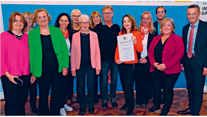
Feierliche Übergabe des Integrationspreises