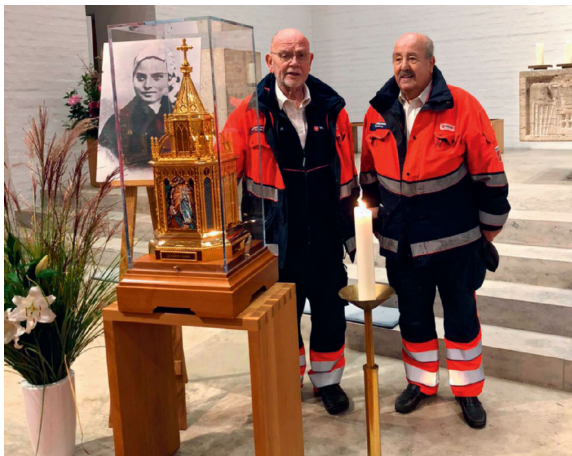
Das SEK der Malteser – immer gut für Einsätze besonderer Art

Der Reliquienschrein wurde vom spanischen Atelier Maison Granda hergestellt. Im Zuge der Seligsprechung im Jahr 1925 wurden dem exhumierten Leichnam Bernadettes kleine Fragmente entnommen, um eine Reliquienverehrung zu ermöglichen.