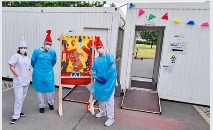
Der kleine Testzirkus in Nürnberg-Röthenbach

NÜRNBERG. Tatataaaa: Einen Tusch für die Mitarbeiterinnen und Mitarbeiter im Corona-Testzentrum in Nürnberg-Röthenbach. Um Kindern die Angst vorm Testen zu nehmen, haben sie den Containern kurzerhand einen Zirkusanstrich verpasst und ziehen die Schlumpfmütze über. So wurde aus dem Testzentrum ein Testzirkus. Eltern und Kinder sind begeistert. Und Tapferkeit wird auch noch belohnt: mit einem Tütchen Gummibären für die kleinen Helden! Her-einspaziert!