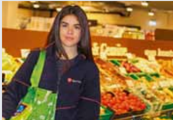
Einkaufshilfen der Malteser erleichtern den Alltag.