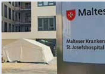
Malteser Zelte als Eingangsschleuse vor Krankenhäusern