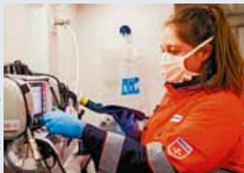
Patientenschutz in Coronazeiten

ERZBISTUM. Am 20. Januar gab das bayerische Gesundheitsministerium den ersten bestätigten Corona-Fall in Bayern bekannt. Acht Wochen später, am 16. März, rief Bayerns Ministerpräsident Markus Söder in Bayern den Katastrophenfall aus. Mit diesem Tag änderte sich für alle Menschen in Deutschland das normale Leben. Ausgangssperren und vorübergehende Geschäftsschließungen waren die Folge.