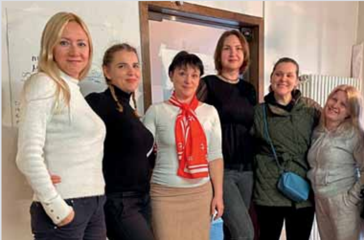
Oben: Ukrainische Frauen beim Frauentreff der MITmacherei Rechts: In Handarbeit gefertigte Taschen der MITnäherei Blick durch die Schaufenster auf Teilnehmende der MITnäherei bei der Arbeit