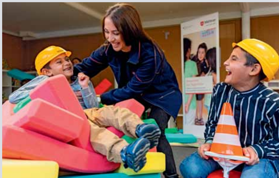
Frauentreff in einer Notunterkunft