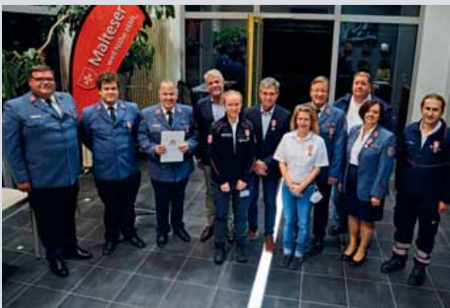
... sowie Helferinnen und Helfer in Nürtingen