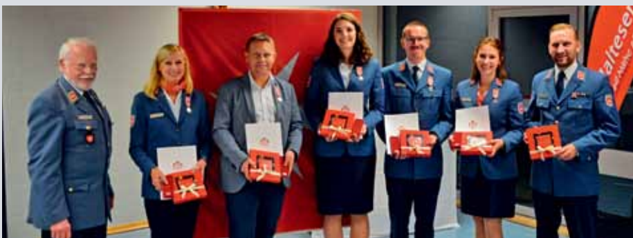
Festakt der Kreisgliederung Rems-Murr