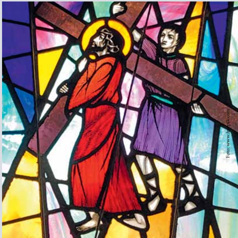
Simon von Kyrene hilft Jesus sein Kreuz zu tragen.