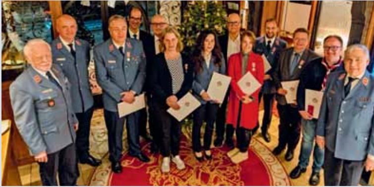
Verleihung an Vertreter des Innenministeriums Baden-Württemberg, der Stadt Stuttgart und des Diözesanvorstands