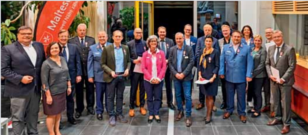
Die Geehrten aus den Kommunalverwaltungen und Verbänden im Kreis Esslingen ...