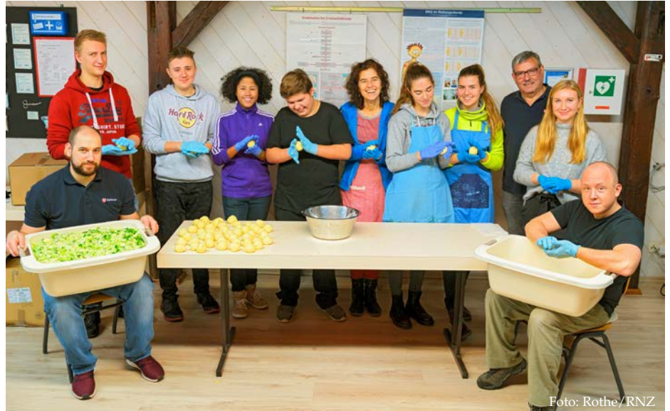
Jeder Knödel wird liebevoll gerollt: Seit 23 Jahren kochen die Heidelberger Malteser an Heiligabend für Obdachlose und Bedürftige.

150 Rettungsdienstmitarbeiter aus Haupt- und Ehrenamt der Wachen Freiburg, Münstertal, Offenburg und Schopfheim sowie 950 Polizisten übten zum ersten Mal in einem Fahrsimulator. Denn eine schnelle Einsatzfahrt mit Hindernissen oder Überraschungen wie zum Beispiel plötzliches Ausscheren von anderen Verkehrsteilnehmern kann man nicht auf der