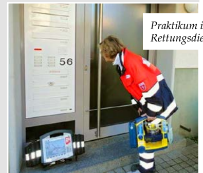
Praktikum im Rettungsdienst