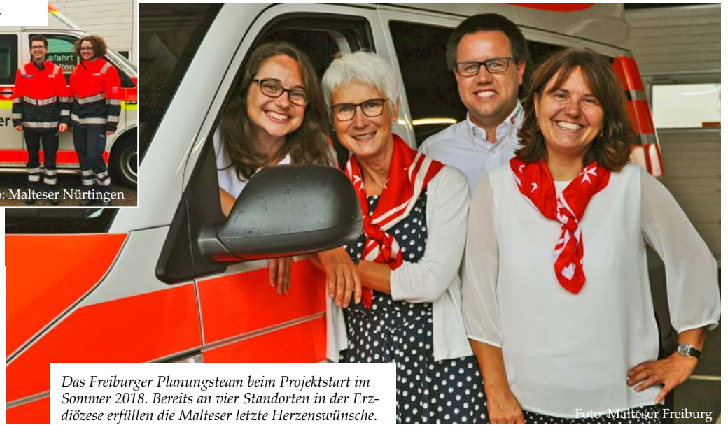
Das Freiburger Planungsteam beim Projektstart im Sommer 2018. Bereits an vier Standorten in der Erzdiözese erfüllen die Malteser letzte Herzenswünsche.