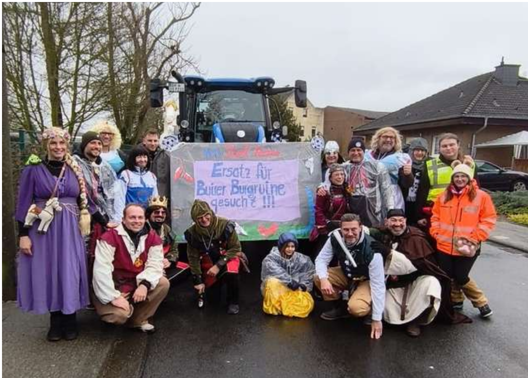
Unser Motto Schild und die Borussia Truppe

Unser Motto für 2026 war: "Ersatz für die Buirer Burgruine gesucht" in dem wir als Ritter, Schurken und Schlossdamen durch die Straßen zogen. Analog zu unserem Motto aus dem Vorjahr adressierten wir auch diesmal die Situation um den Neubau des Kunstrasenplatzes und dem Sportlerheim bei dem uns die Stadt Kerpen, trotz zahlreicher Versprechen, weiterhin hängen lässt und andere Ortsteile und Projekte bevorzugt. Von dieser Tatsache ließen sich die 16 TeilnehmerInnen auf unserem Wagen aber nicht die Laune vermiesen.