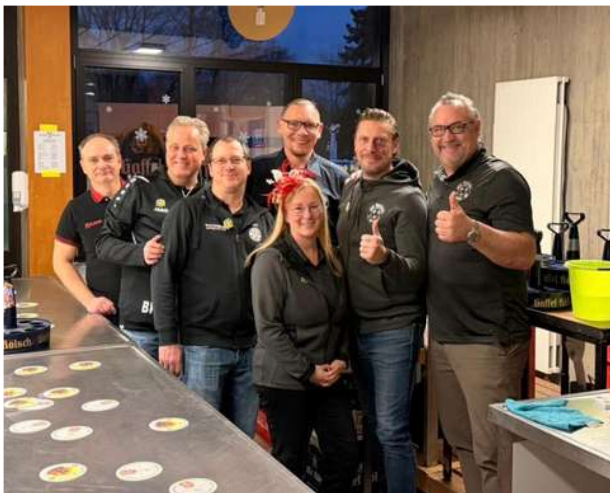
Impressionen der "Thekenmannschaft" bei der Sitzung der KG sowie unser Rosenmontagswagen samt Belegschaft