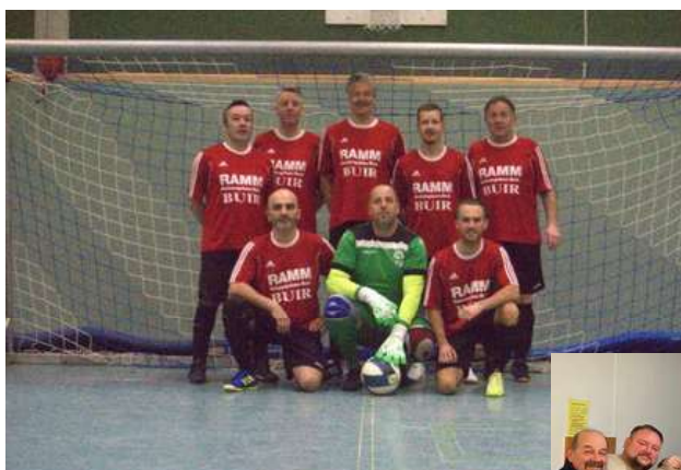
Impressionen von der Stadtmeisterschaft und dem Kegelabend

Am 03.01.2026 bestritt eine Delegation unserer Alten Herren die 5. Hallenstadtmeisterschaft der Kolpingstadt Kerpen. Mit einem Sieg (6:1 SG Mannheim/Blatzheim), einem Unentschieden (2:2 VfL Sindorf) und 3 Niederlagen (1:4 Horremer SV, 0:1 BW Kerpen, 0:3 SpVg BBT) erreichten wir einen 5. Platz beim kleinen Hallenstadtmeisterschaftsjubiläum. Die Stimmung war großartig und alle hatten sichtlich Spaß.