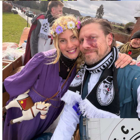
Weitere Impressionen vom Rosenmontag