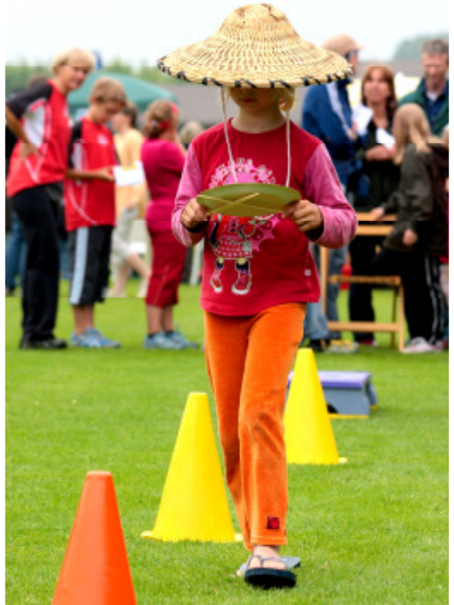
Oft war ein ruhiges Händchen gefragt...