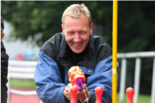
Wenn der Vater mit dem Sohne...

Doch jetzt lassen wir nach vielen Worten einmal Bilder sprechen: