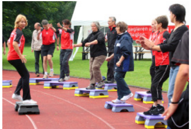
Kostproben aus unserem Programm für Groß und Klein.