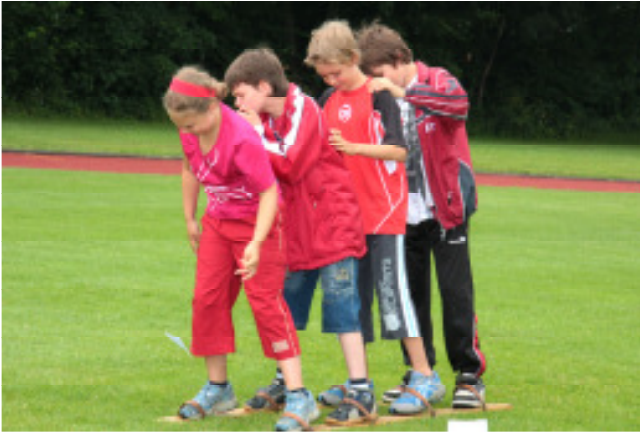
Und ohne Teamwork ging gar nichts.