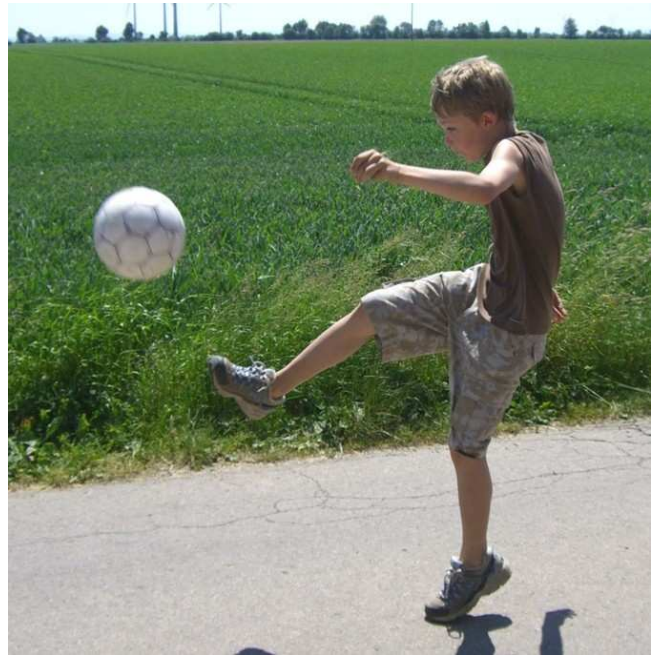
Nachwuchstalente im deutschen Fußball...

Schon bevor man überhaupt auf die Fahrräder gestiegen war, ging es noch auf dem Sportplatz mit Ziel-Werfen auf ein Tor los. Unterwegs auf der Strecke rund um Gymnich und den Konradsheimer Golfplatz folgten noch fünf weitere Stationen wie zum Beispiel Zeitschätzlauf, Stangenlauf und Weit-Schießen. Unter den Blicken der anderen Teilnehmer wurden Groß und Klein auf Zeit- und Ballgefühl und Koordination getestet.