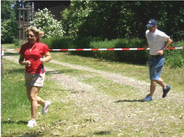
„Hasch mich! Ich bin der Frühling!“