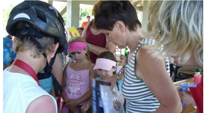
Fast wie Weihnachten