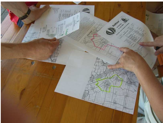
Wieso so kompliziert? Das Runde muss in das Eckige!