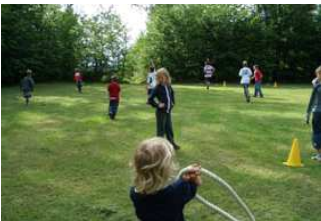
Auch die Kleinsten hatten ihren Spaß.