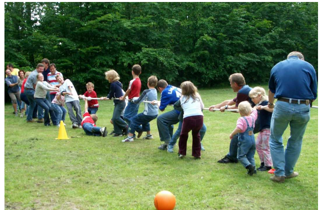
Erwachsenen und Kinder maßen ihre Kräfte im Tauziehen. Wer ist denn wohl stärker?