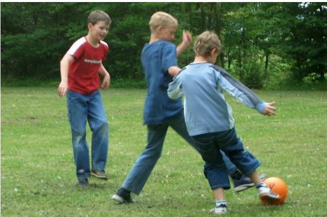
Die große Wiese eignete sich hervorragend zum Fußballspielen

Schließlich kam es zur Preisverleihung. Das Ergebnis war auch diesmal wieder ganz knapp. Die Siegergruppe wurde prämiert und zusätzlich wurde jedes teilnehmende Kind der Fahrradrallye mit einem Preis belohnt.