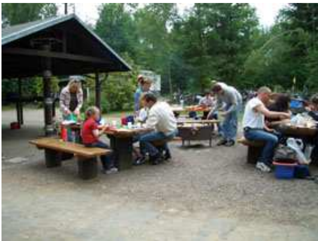
Sport macht hungrig ....