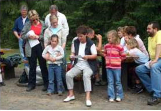
Alle lauschten aufmerksam den Gedichtvorträgen.