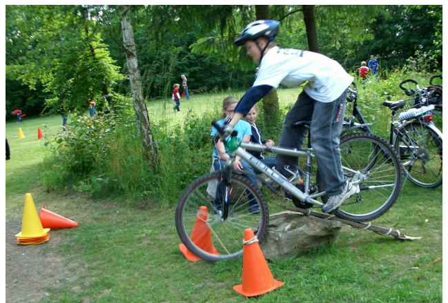
Geschicklichkeitsfahren über ein selbstgebautes Hindernis.

Nachdem am Grillplatz wieder alles aufgeräumt war, nahm der Bagagewagen das Leergut auf und die Radler traten gegen 18.00 Uhr ein wenig müde den Heimweg an.