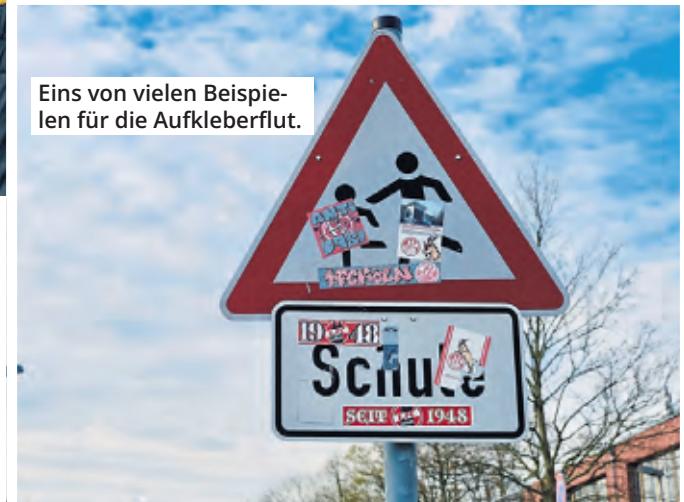
Eins von vielen Beispielen für die Aufkleberflut.

nicht: Die Schilder seien möglicherweise beim Derby des FC gegen Borussia Mönchengladbach und/oder bei einem Rhein-Ruhr-Derby der Regionalliga West gegen den VFL Bochum zugeklebt worden, vermutet eine Sprecherin der Polizei. „Uns liegt aber keine Anzeige vor“, betont sie. Normalerweise zeige die Stadt als Eigentümerin der Straßenschilder die Sachbeschädigung an. Allerdings könnten je nach Einzelfall auch andere Straftatbestände durch das Schilderbekleben erfüllt sein. Es könnte einen gefährlichen Eingriff in den Straßenverkehr darstellen, wenn Menschen dadurch konkret gefährdet würden. Zudem könnten Hassbotschaften Beleidigungstatbestände erfüllen. Welches Delikt konkret vorliegt, prüft nach Anzeige und Ermittlungen die Staatsanwaltschaft.