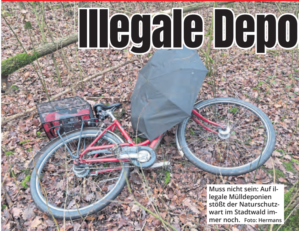
Muss nicht sein: Auf illegale Mülldeponien stößt der Naturschutzwart im Stadtwald immer noch.