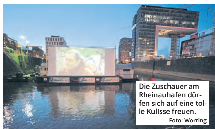
Die Zuschauer am Rheinauhafen dürfen sich auf eine tolle Kulisse freuen.

Spiele ab 22 Uhr laufen auf der Kinoleinwand, alle Partien, die früher beginnen, auf einer 30 Quadratmeter großen LED-Wand. Der Eintritt kostet jeweils 12 Euro und beinhaltet zwei Getränke. (red)