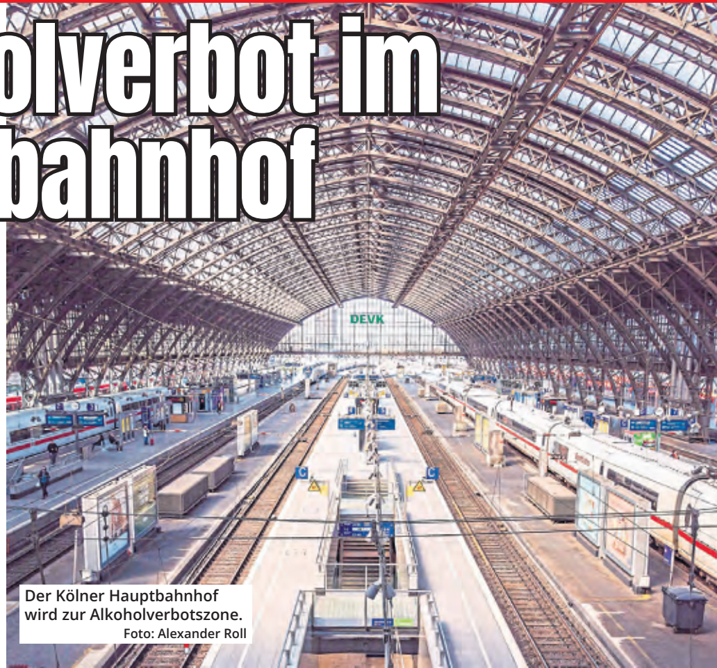
Der Kölner Hauptbahnhof wird zur Alkoholverbotzone.

Die Deutsche Bahn hat im Kölner Hauptbahnhof ein Alkoholverbot eingeführt. Seit Anfang April ist es nicht mehr erlaubt, Alkohol zu trinken oder alkoholische Getränke mitzubringen, um sie im Bahnhof zu konsumieren. Das Verbot gilt im gesamten Bahnhof einschließlich der Bahnsteige und aller Zuwege.