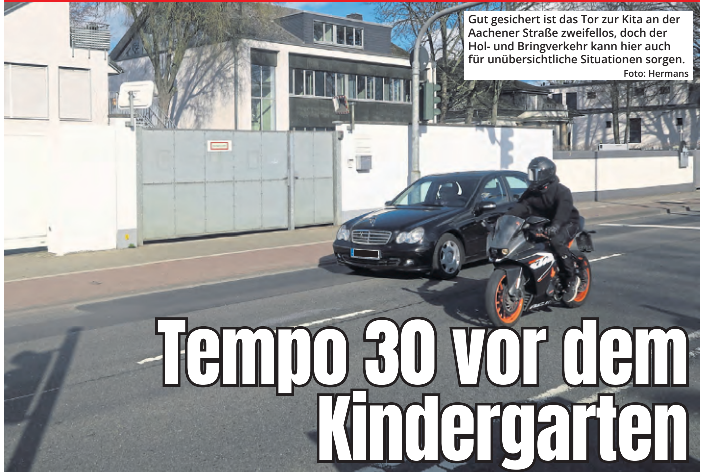
Gut gesichert ist das Tor zur Kita an der Aachener Straße zweifellos, doch der Hol- und Bringverkehr kann hier auch für unübersichtliche Situationen sorgen.