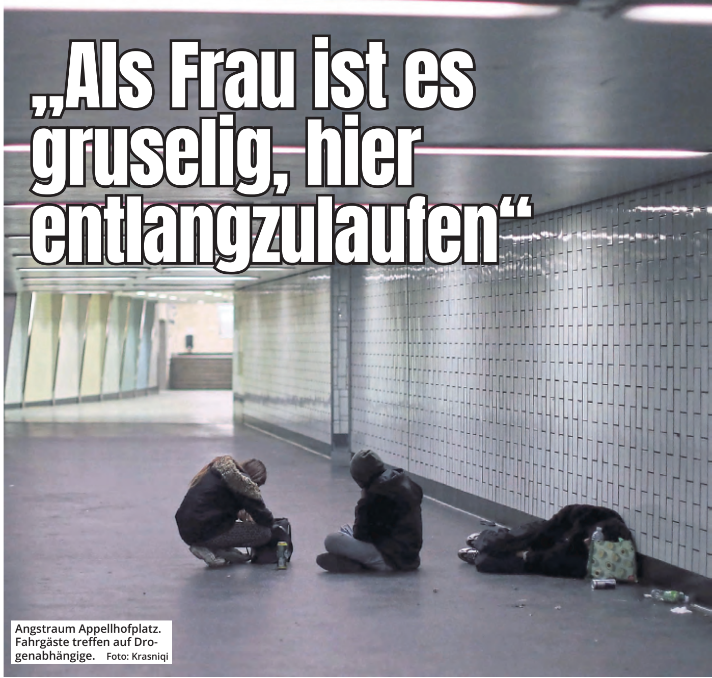
Angstram Appellhofplatz. Fahrgäste treffen auf Drogenabhängige.

Die Kölnerin Sabine M. (57) ist geschockt über den Zustand an der KVB-Haltestelle Appellhofplatz. Der Weg zur Arbeit bedeutet für sie vor allem eins: Angst. Sie berichtet von herumliegenden Junkies, Erbrochenem und Blutlachen.