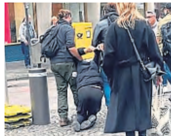
Polizisten in Zivil führen einen Taschendieb in der Trankgasse ab.

Bei den Straßen und Plätzen mit den meisten registrierten Taschendiebstählen gab es einen Wechsel: Die Trankgasse in Köln rangiert nun als heißestes Pflaster in NRW auf Platz Eins (498 Fälle) knapp vor dem Bahnhofsvorplatz in Düsseldorf (496). Im vergangenen Jahr war es den Angaben zufolge umgekehrt.