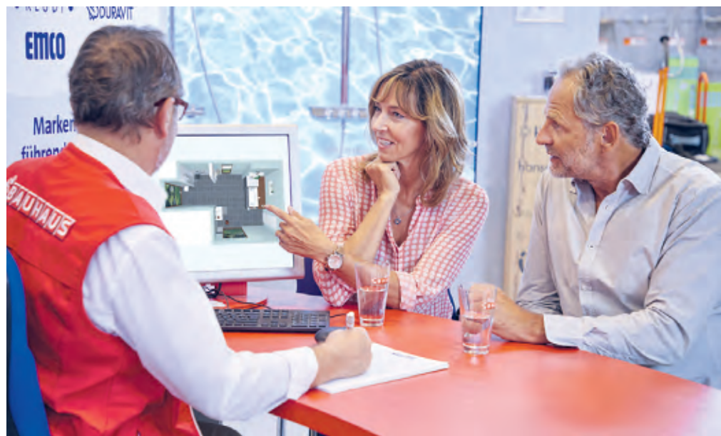
Das BAUHAUS Frechen bietet mit dem „360° Service“ eine einzigartige Dienstleistung: alle Produkte und die komplette Montage für ein neues Badezimmer aus einer Hand – von der Beratung und Planung bis zum Einbau.

BAUHAUS Frechen bietet Produkte, Badplanung und Montage