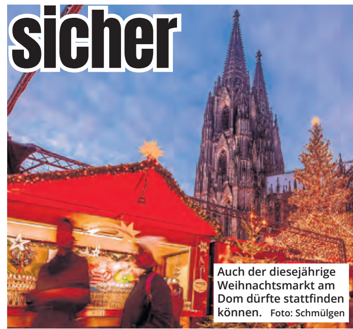
Auch der diesjährige Weihnachtsmarkt am Dom dürfte stattfinden können.

Bis zum Herbst dieses Jahres will die Stadt für 4,1 Millionen Euro die größten akuten Schäden in der Tiefgarage am Dom mit 520 Stellplätzen ausbessern, weil Statik und Brandschutz Probleme bereitet hatten. Der Stadtrat soll die Summe am 12. Mai genehmigen. Erst danach soll die Generalsanierung durchgeführt werden. Wann sie stattfindet und wie viel sie kostet, ist laut Verwaltung bisher nicht absehbar.