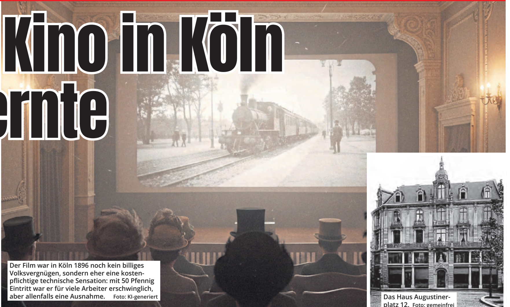
Der Film war in Köln 1896 noch kein billiges Volksvergnügen, sondern eher eine kostenpflichtige technische Sensation: mit 50 Pfennig Eintritt war er für viele Arbeiter erschwinglich, aber allenfalls eine Ausnahme.

Wie stark bereits die Premiere im April wirkte, zeigt der Bericht der „Kölnischen Zeitung“ einen Tag später in ihrer Abendausgabe. Es sei, so der Reporter, als „wenn wir an einem weitgeöffneten Fenster stünden und hinausblickten, bald auf einen Fabrikhof, bald auf das weite Meer, bald auf einen großstädtischen Bahnhof. Alles erscheint vor den Augen des Publikums mit solcher Natürlichkeit, dass dieses Ausrufe des Erstaunens nicht unterdrücken kann“. Seine Vorhersage sollte sich bestätigen: „Zweifellos wird der Apparat hier in Köln großes Aufsehen erregen.“ Und das tat er. Aufführungen gab es fortan täglich von 11 bis 13 Uhr, und von 15 bis 22 Uhr. Für 50 Pfennig – reservierte Plätze kosteten eine Mark – bekamen die Zuschauer im Saal des ersten Stocks etwa 30 Minuten lang zehn „lebendige Bilder“ mit dem Kinematographen vorgeführt. Ein billiges Vergnügen war das nicht.