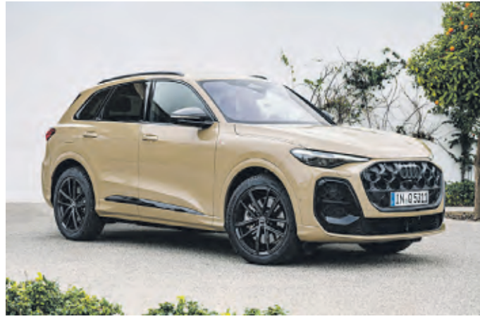
Audi hat die Q5-Familie erweitert