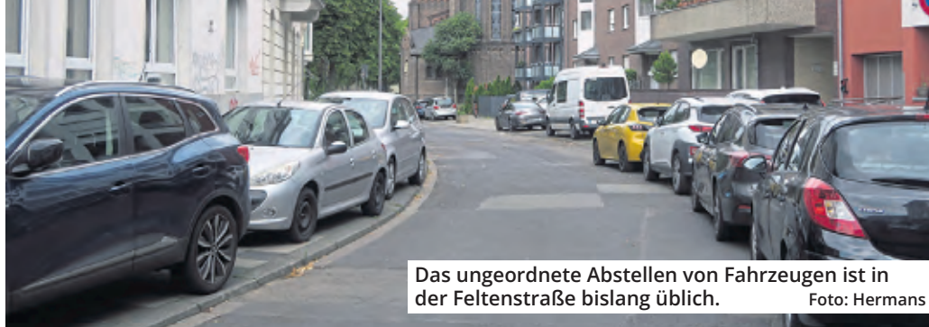
Das ungeordnete Abstellen von Fahrzeugen ist in der Feltenstraße bislang üblich.