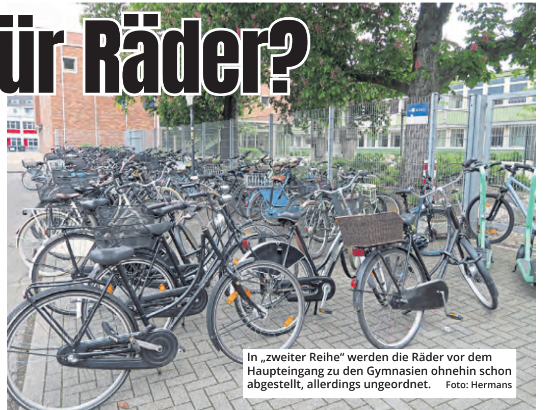
In „zweiter Reihe“ werden die Räder vor dem Haupteingang zu den Gymnasien ohnehin schon abgestellt, allerdings ungeordnet.

dringend benötigten Fahrradständern ausgestattet werden. Alternativ, oder gerne auch zusätzlich, könnten auf Teilen der Fläche in der Mitte des Wendehammers, die derzeit als Pkw-Parkplatz genutzt wird, künftig Räder abgestellt werden. Mindestens acht Pkw-Stellplätze würden dann entfallen. Ob alle 32 Parkplätze umgewidmet werden können, soll zumindest geprüft werden. Mit diesen Maßnahmen möchten die Bezirksvertreter auch bislang skeptische Schüler dazu anregen, mit dem Fahrrad zur Schule zu fahren. Das fördere die Gesundheit und komme der Umwelt zugute.