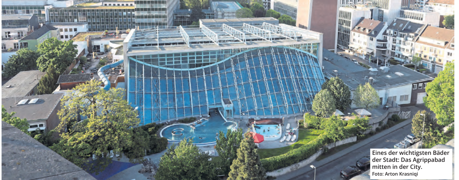
Eines der wichtigsten Bäder der Stadt: Das Agrippabad mitten in der City.