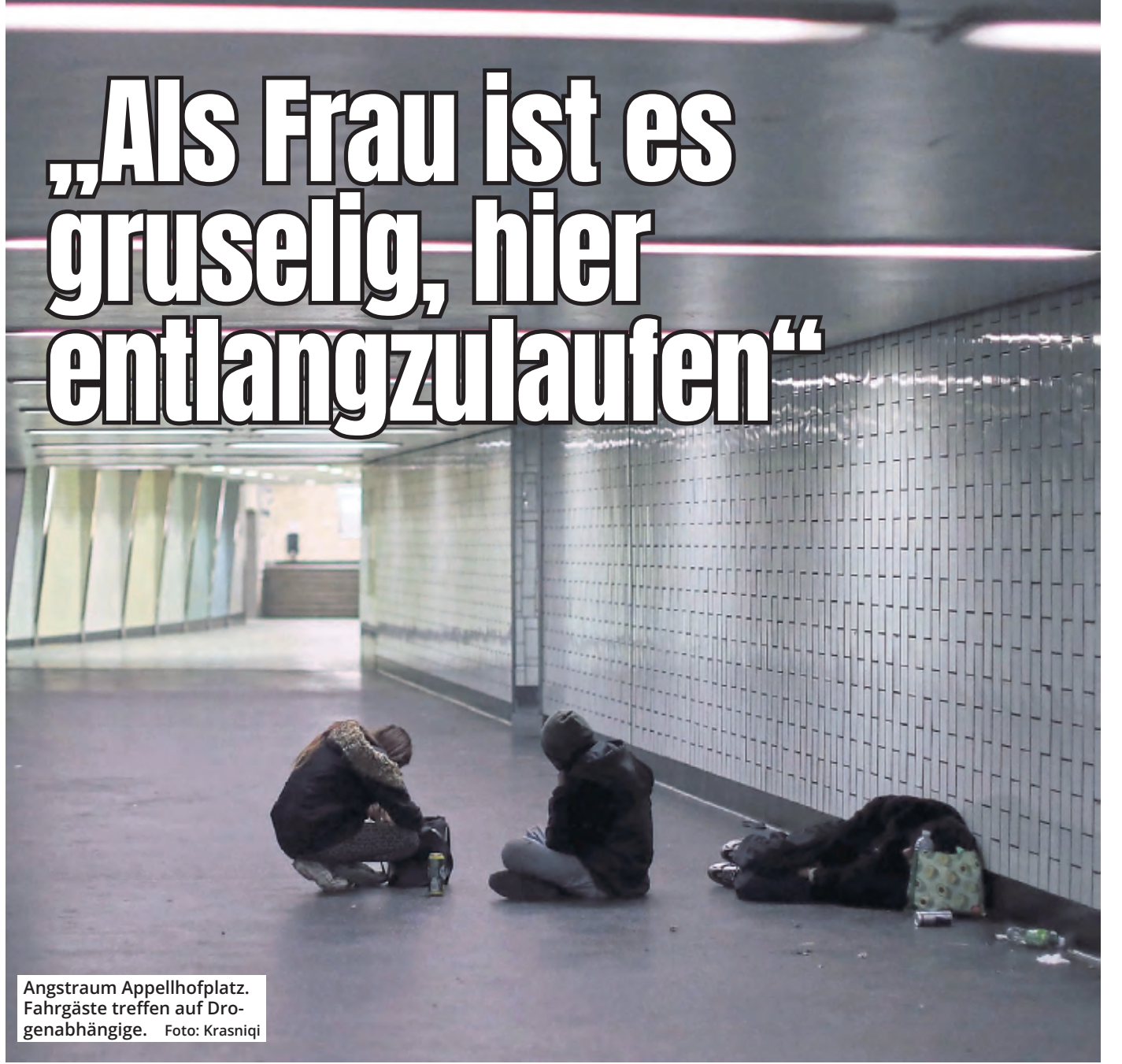
Angstraum Appellhofplatz. Fahrgäste treffen auf Drogenabhängige.

Die Kölnerin Sabine M. (57) ist geschockt über den Zustand an der KVB-Haltestelle Appellhofplatz. Der Weg zur Arbeit bedeutet für sie vor allem eins: Angst. Sie berichtet von herumliegenden Junkies, Erbrochenem und Blutlachen.