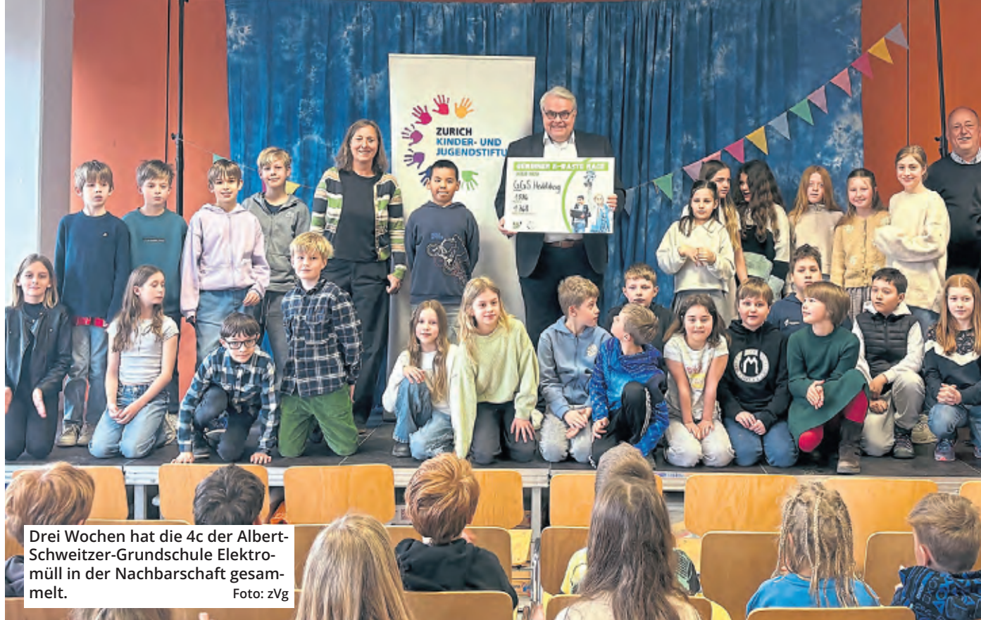
Drei Wochen hat die 4c der Albert-Schweitzer-Grundschule Elektromüll in der Nachbarschaft gesammelt.