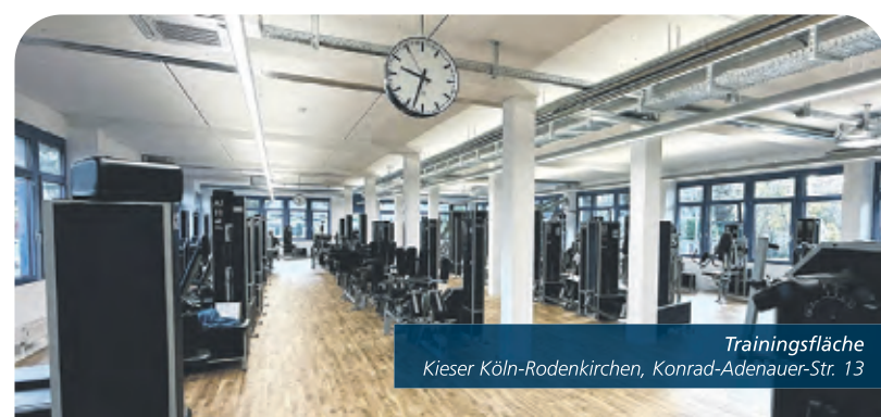
Trainingsfläche Kieser Köln-Rodenkirchen, Konrad-Adenauer-Str. 13

Kieser Köln-Rodenkirchen Konrad-Adenauer-Straße 13 50996 Köln Telefon (0221) 17 00 160 koeln7@kieser.com Kostenlose Kundenparkplätze Mehr Infos unter kieser.com