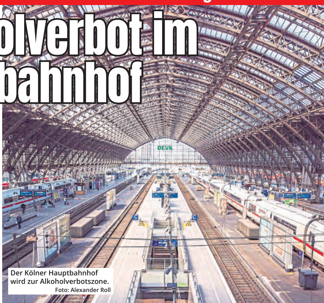
Der Kölner Hauptbahnhof wird zur Alkoholverbotzone.

Die Deutsche Bahn hat im Kölner Hauptbahnhof ein Alkoholverbot eingeführt. Seit Anfang April ist es nicht mehr erlaubt, Alkohol zu trinken oder alkoholische Getränke mitzubringen, um sie im Bahnhof zu konsumieren. Das Verbot gilt im gesamten Bahnhof einschließlich der Bahnsteige und aller Zuwege.