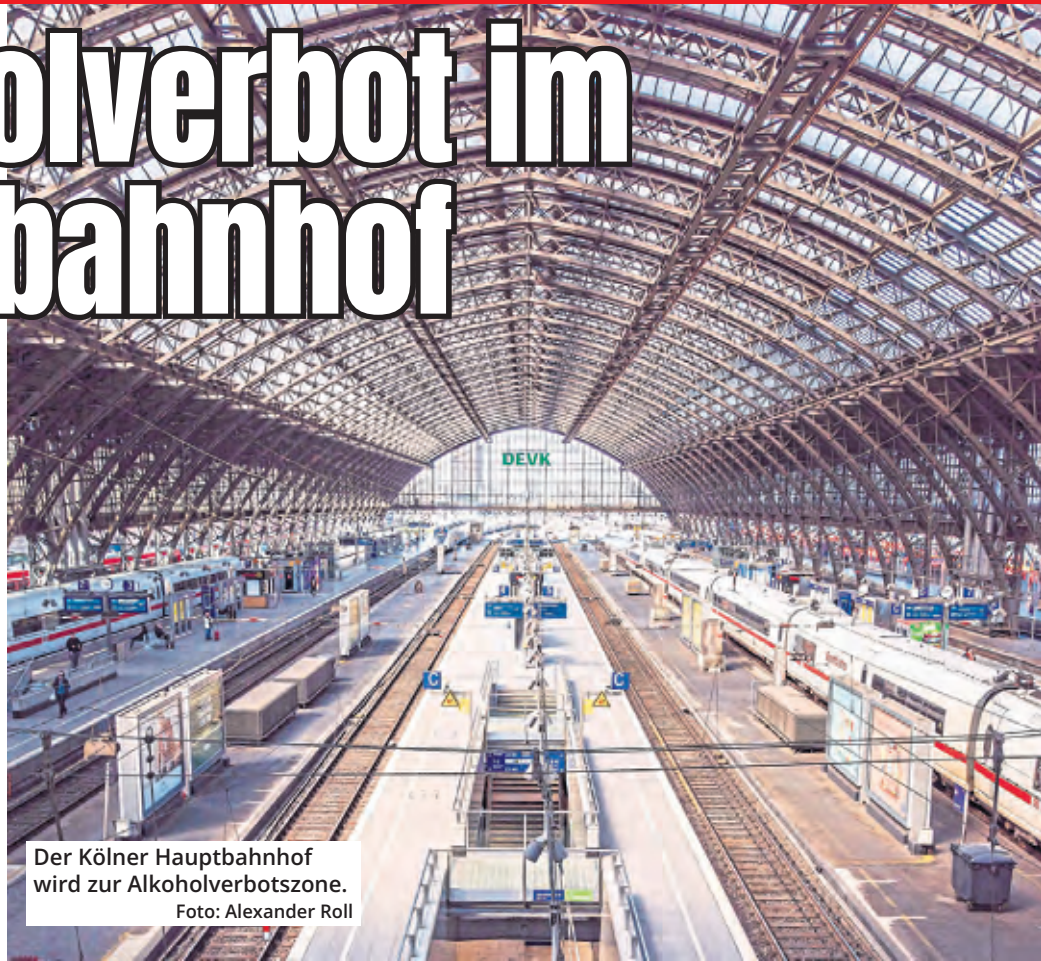
Der Kölner Hauptbahnhof wird zur Alkoholverbotzone.

Die Deutsche Bahn hat im Kölner Hauptbahnhof ein Alkoholverbot eingeführt. Seit Anfang April ist es nicht mehr erlaubt, Alkohol zu trinken oder alkoholische Getränke mitzubringen, um sie im Bahnhof zu konsumieren. Das Verbot gilt im gesamten Bahnhof einschließlich der Bahnsteige und aller Zuwege.