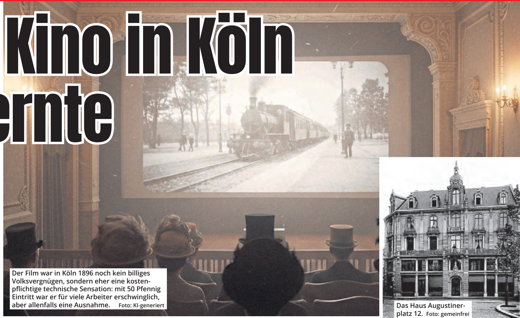
Der Film war in Köln 1896 noch kein billiges Volksvergnügen, sondern eher eine kostenpflichtige technische Sensation: mit 50 Pfennig Eintritt war er für viele Arbeiter erschwinglich, aber allenfalls eine Ausnahme.

Wie stark bereits die Premiere im April wirkte, zeigt der Bericht der „Kölnischen Zeitung“ einen Tag später in ihrer Abendausgabe. Es sei, so der Reporter, als „wenn wir an einem weitgeöffneten Fenster stünden und hinausblickten, bald auf einen Fabrikhof, bald auf das weite Meer, bald auf einen großstädtischen Bahnhof. Alles erscheint vor den Augen des Publikums mit solcher Natürlichkeit, dass dieses Ausrufe des Erstaunens nicht unterdrücken kann“. Seine Vorhersage sollte sich bestätigen: „Zweifellos wird der Apparat hier in Köln großes Aufsehen erregen.“ Und das tat er. Aufführungen gab es fortan täglich von 11 bis 13 Uhr, und von 15 bis 22 Uhr. Für 50 Pfennig – reservierte Plätze kosteten eine Mark – bekamen die Zuschauer im Saal des ersten Stocks etwa 30 Minuten lang zehn „lebendige Bilder“ mit dem Kinematographen vorgeführt. Ein billiges Vergnügen war das nicht.