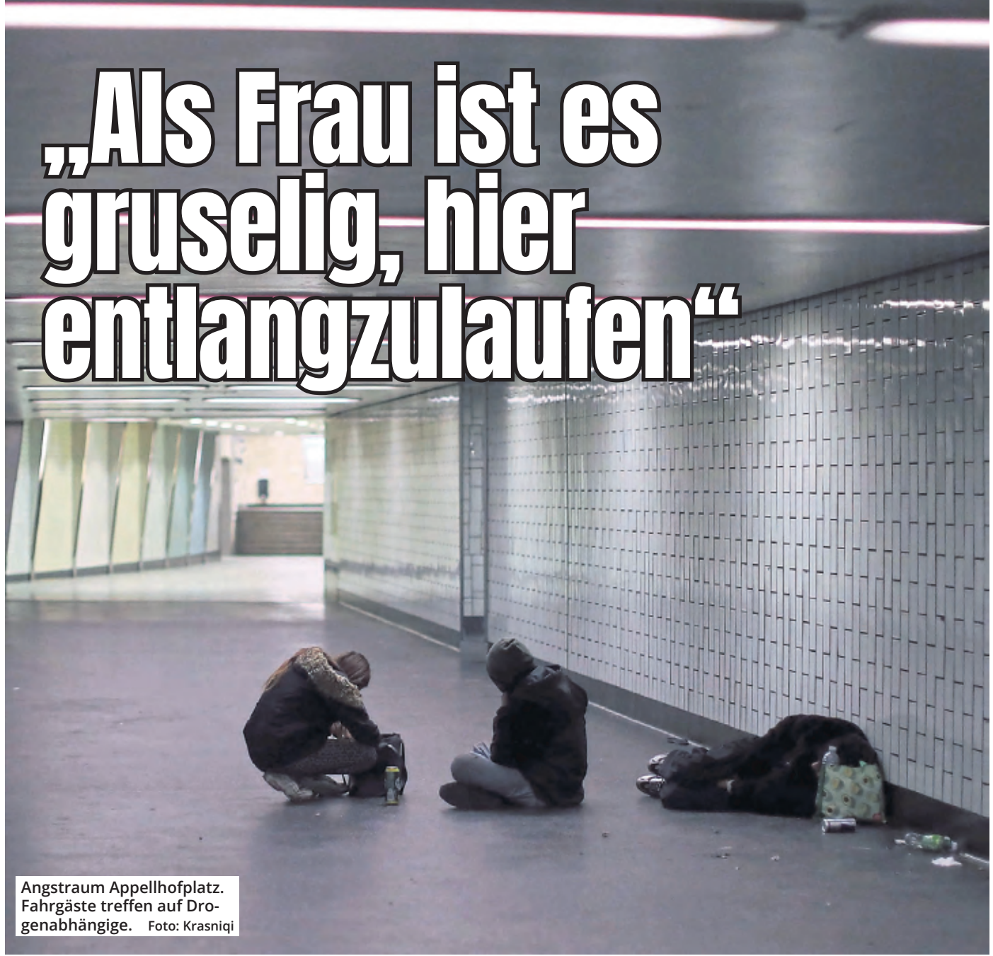
Angstraum Appellhofplatz. Fahrgäste treffen auf Drogenabhängige.

Die Kölnerin Sabine M. (57) ist geschockt über den Zustand an der KVB-Haltestelle Appellhofplatz. Der Weg zur Arbeit bedeutet für sie vor allem eins: Angst. Sie berichtet von herumliegenden Junkies, Erbrochenem und Blutlachen.