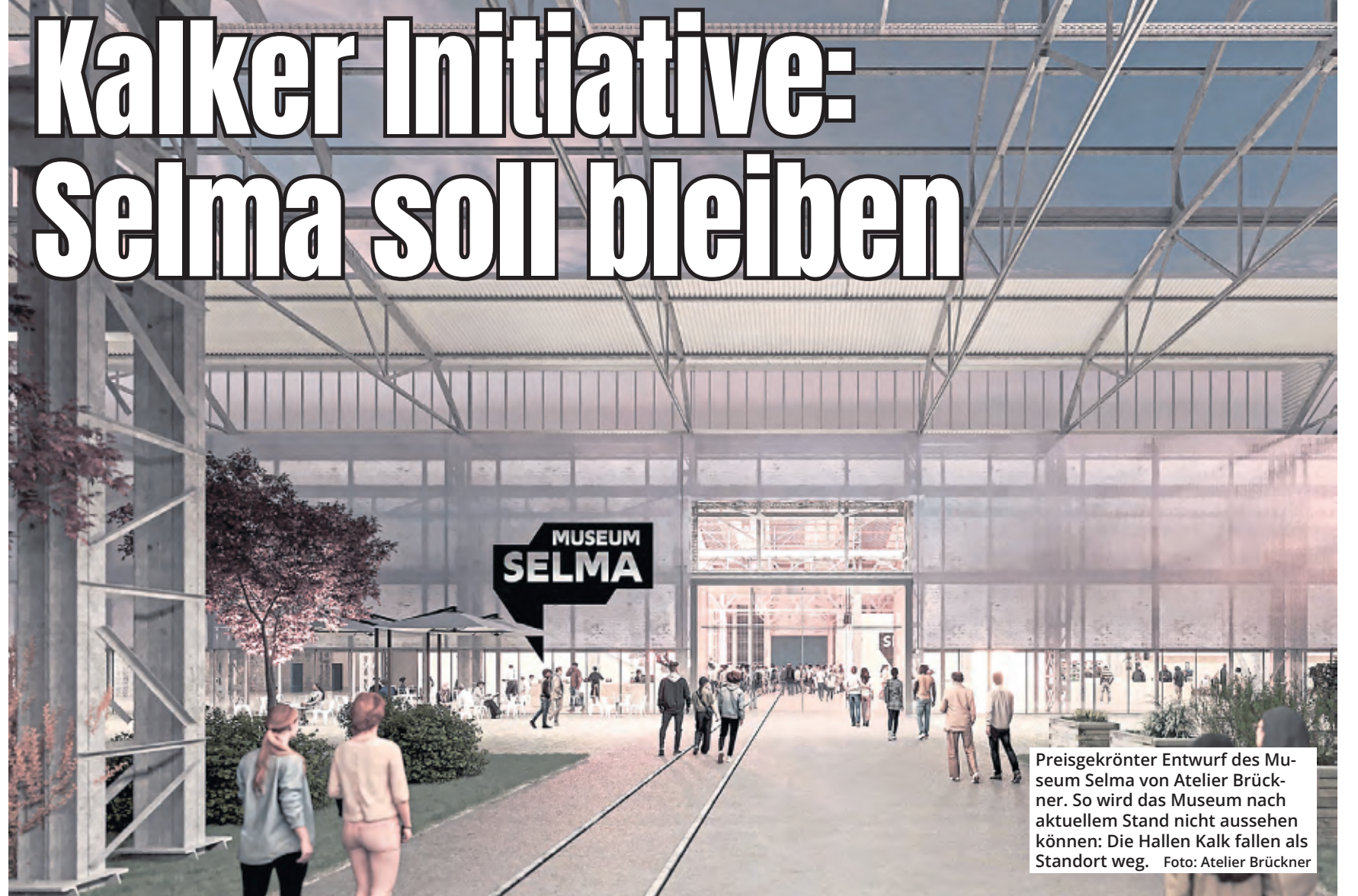
Preisgekrönter Entwurf des Museum Selma von Atelier Brückner. So wird das Museum nach aktuellem Stand nicht aussehen können: Die Hallen Kalk fallen als Standort weg.