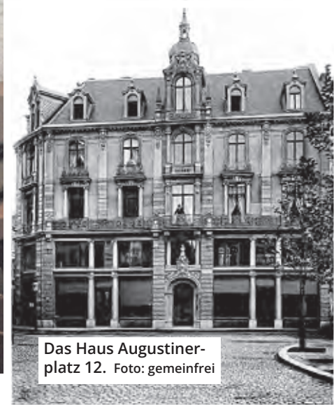
Das Haus Augustinerplatz 12.

Und auch kein abendfüllendes. Doch darauf kam es gar nicht an. Entscheidend war der Effekt: Anziehungskraft hatte die bis dahin einmalige naturgetreue Projektion von Bewegung auf eine große Leinwand.