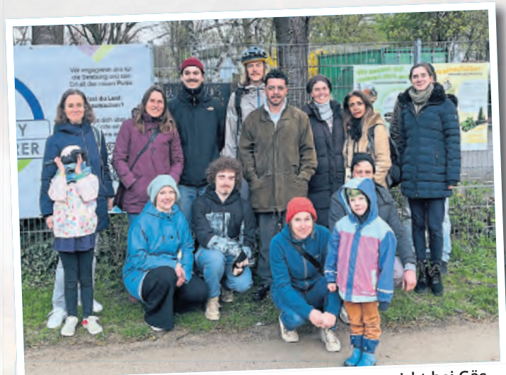
Eine wachsende Gemeinschaft von Kümmerern wirbt bei Gästen um das Verantwortungsgefühl für den Park.

den sammeln, mit denen für besonders eifrige junge Müllsammelnde kleine Belohnungen beschafft werden können“, sagt sie.