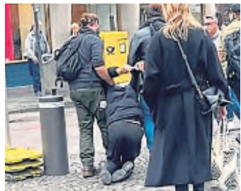
Polizisten in Zivil führen einen Taschendieb in der Trankgasse ab.

Bei den Straßen und Plätzen mit den meisten registrierten Taschendiebstählen gab es einen Wechsel: Die Trankgasse in Köln rangiert nun als heißestes Pflaster in NRW auf Platz Eins (498 Fälle) knapp vor dem Bahnhofsvorplatz in Düsseldorf (496). Im vergangenen Jahr war es den Angaben zufolge umgekehrt.