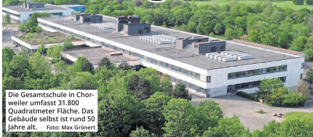
Die Gesamtschule in Chorweiler umfasst 31.800 Quadratmeter Fläche. Das Gebäude selbst ist rund 50 Jahre alt.

Belastung für den Haushalt Für die Heinrich-Böll-Gesamtschule ließ die Stadt 2023 eine Machbarkeitsrechnung anstellen, mit der