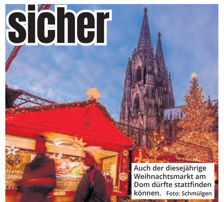
Auch der diesjährige Weihnachtsmarkt am Dom dürfte stattfinden können.

Bis zum Herbst dieses Jahres will die Stadt für 4,1 Millionen Euro die größten akuten Schäden in der Tiefgarage am Dom mit 520 Stellplätzen ausbessern, weil Statik und Brandschutz Probleme bereitet hatten. Der Stadtrat soll die Summe am 12. Mai genehmigen. Erst danach soll die Generalsanierung durchgeführt werden. Wann sie stattfindet und wie viel sie kostet, ist laut Verwaltung bisher nicht absehbar.