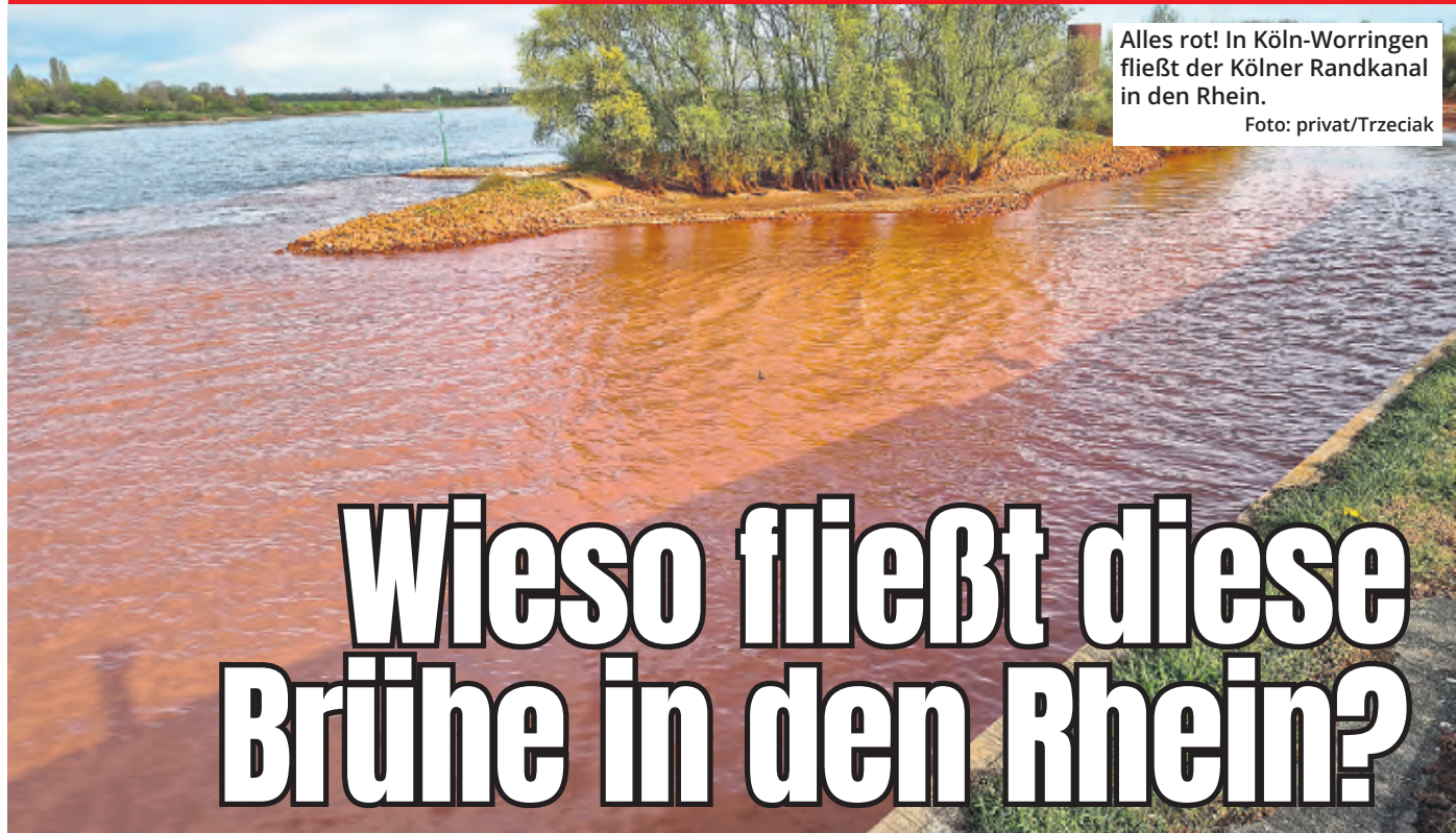
Alles rot! In Köln-Worringen fließt der Kölner Randkanal in den Rhein.