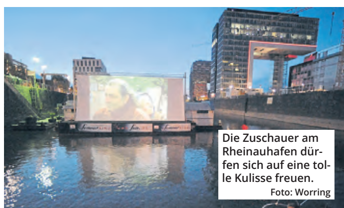
Die Zuschauer am Rheinauhafen dürfen sich auf eine tolle Kulisse freuen.

Spiele ab 22 Uhr laufen auf der Kinoleinwand, alle Partien, die früher beginnen, auf einer 30 Quadratmeter großen LED-Wand. Der Eintritt kostet jeweils 12 Euro und beinhaltet zwei Getränke. (red)