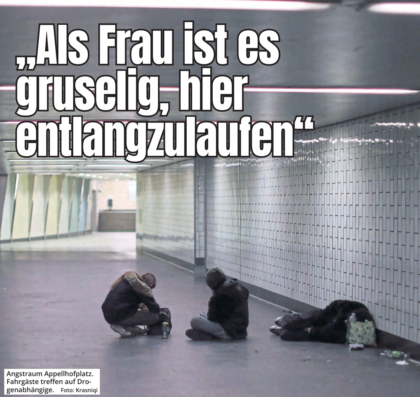
Angstraum Appellhofplatz. Fahrgäste treffen auf Drogenabhängige.

Die Kölnerin Sabine M. (57) ist geschockt über den Zustand an der KVB-Haltestelle Appellhofplatz. Der Weg zur Arbeit bedeutet für sie vor allem eins: Angst. Sie berichtet von herumliegenden Junkies, Erbrochenem und Blutlachen.