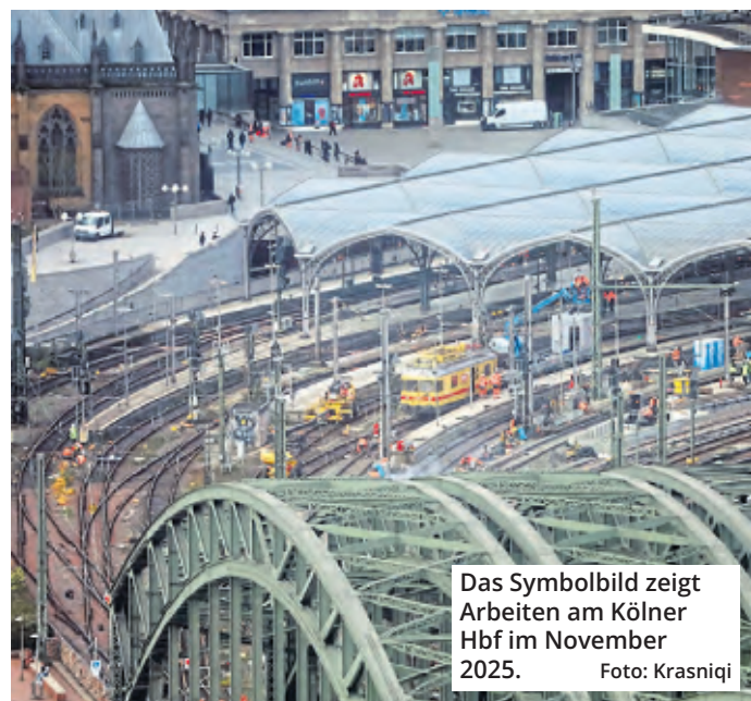
Das Symbolbild zeigt Arbeiten am Kölner Hbf im November 2025.

„Wir wollen schnell beginnen“, sagte Verkehrsminister Krischer. Er könne sich vorstellen, dass der Bau der neuen Bahnsteige im Hauptbahnhof und Deutz ohne größere Einschränkungen des Bahnverkehrs möglich ist.