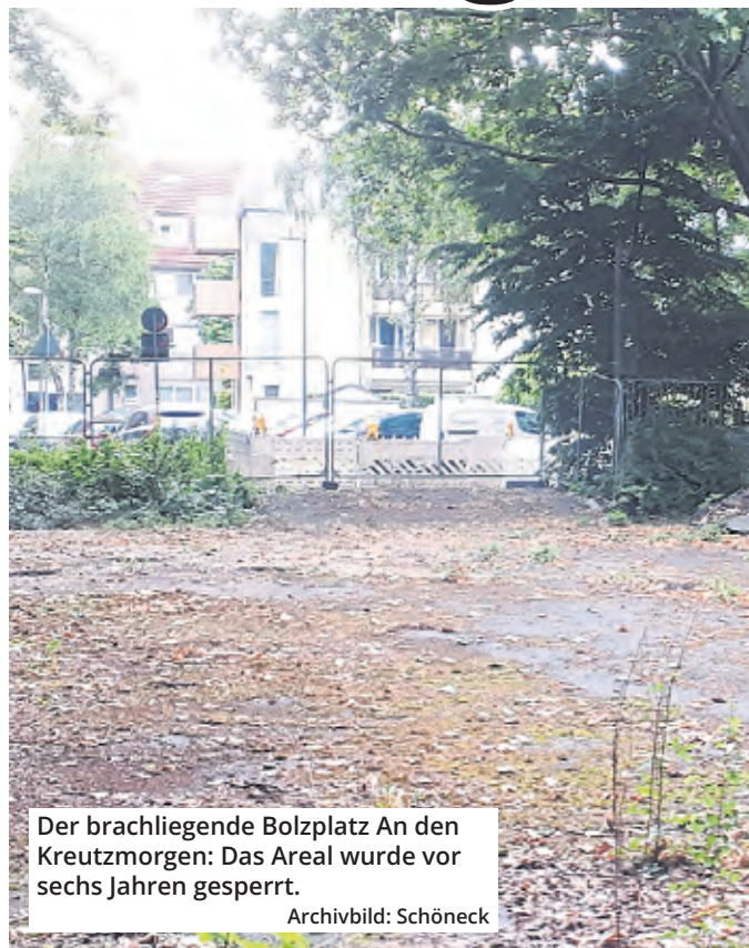
Der brachliegende Bolzplatz An den Kreuzmorgen: Das Areal wurde vor sechs Jahren gesperrt.

ben hatten, war der Platz im Frühjahr 2020 gesperrt worden, später wurden auch die Tore demontiert. 2022 fand eine Ideenwerkstatt auf dem Areal mit Familien und Jugendlichen statt. Im Vorjahr wurde die Sanierung des Bolzplatzes mit erhöhter Spielfläche und Kunstrasen-Belag beschlossen. Alle Bäume sollen erhalten bleiben; der neue Platz wird jedoch nur 325 statt 650 Quadratmeter umfassen, weil ein die Spielfläche umlaufender Streifen entsiegelt wird. Seitdem rätselte man im Veedel, wann es mit dem Gelände weitergeht. Das Bolzplatz-Areal ist unterdessen weiterhin abgesperrt. Im Umkreis des Platzes ist eine kleine Baustelle eingerichtet, für die zwei Pkw-Stellplätze entfallen sind. Für die Rückkehr des Platzes hatte sich unter anderem das nahe Jugendzentrum „Dachlow“ eingesetzt. Auch bei der Online-Kinder- und Jugendbeteiligung „Hey Nippes“ im Jahr 2024 fand eine Rückkehr des Platzes viele unterstützende Stimmen.