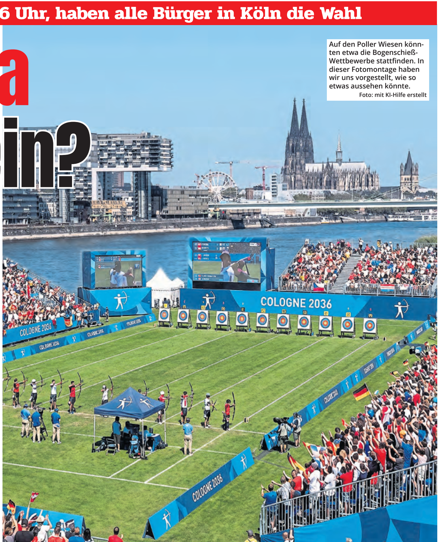
Auf den Poller Wiesen könnten etwa die Bogenschieß-Wettbewerbe stattfinden. In dieser Fotomontage haben wir uns vorgestellt, wie so etwas aussehen könnte.

Müssen neue Sportstätten gebaut werden? Das Konzept sieht vor, dass alle Wettkämpfe in bereits bestehenden oder temporären Sportstätten ausgetragen werden sollen. Lediglich das temporäre Leichtathletik-Stadion sowie das Olympische Dorf sollen im neuen Kölner Stadtteil Kreuzfeld entstehen, nach den Spielen aber anderweitig weitergenutzt werden. Das Ziel dabei: Beide Infrastrukturprojekte sollen Kreuzfeld als Wohnquartier einen dauerhaften Mehrwert bieten. Der neue Stadtteil könne dadurch als vielseitiger Sport-, Spiel-, Erholungs-, Bildungs- und Wohnraum weiterentwickelt werden.