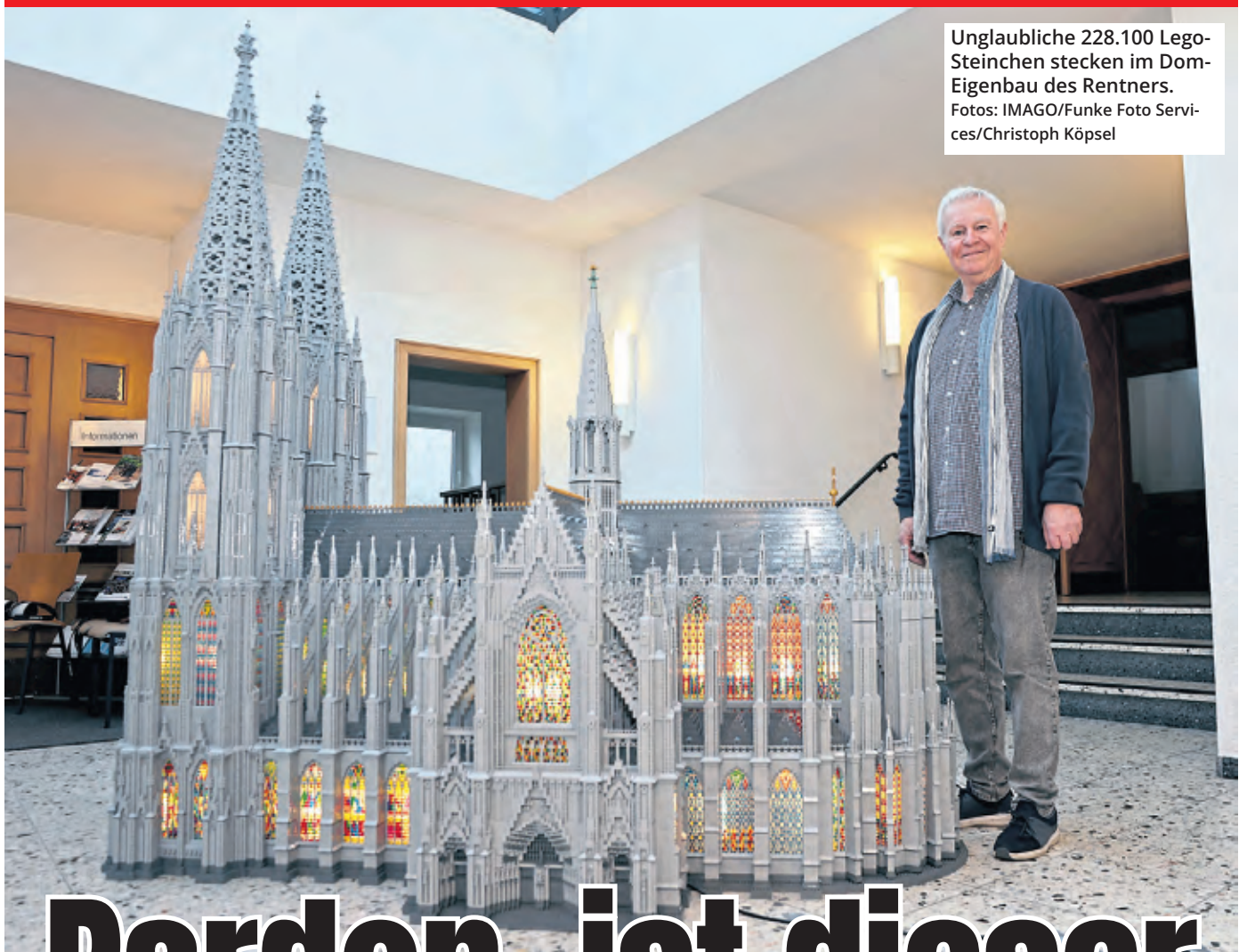
Unglaubliche 228.100 Lego-Steinchen stecken im Dom-Eigenbau des Rentners.