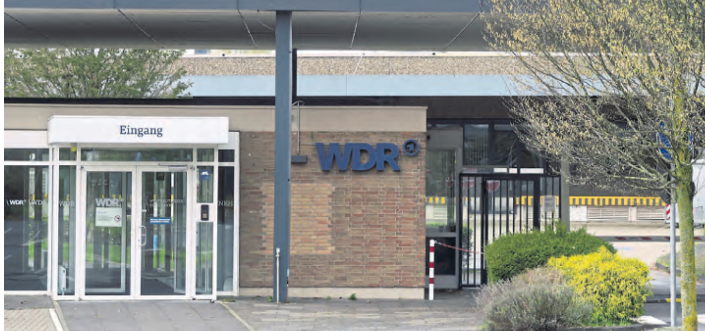
Nicht ausgelastet: Der WDR möchte das Gelände am Freimersdorfer Weg verkaufen.

Bocklemünd/Widdersdorf. Gegen den gemeinsamen Antrag von Grünen, SPD und Die Linke sprach sich lediglich die AfD-Fraktion aus, CDU und FDP enthielten sich der Stimme. Die Antragsteller betonen, dass die Zukunft des rund 41 Fußballfelder großen Areals, das der WDR wegen mangelnder Auslastung bis 2035 verkaufen will, einen erheblichen Einfluss auf den Stadtbezirk haben werde. Deshalb müsse es „in öffentlicher Kontrolle bleiben.“ Denkbar sei „ein breites Spektrum“ an künftigen