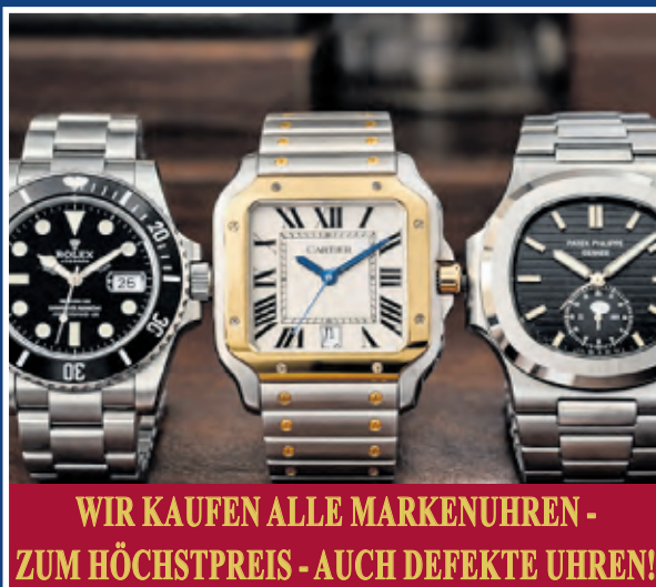
WIR KAUFEN ALLE MARKENUHREN - ZUM HÖCHSTPREIS - AUCH DEFEKTE UHREN!

Bei uns wird nicht nur der Goldwert berechnet, sondern zusätzlich der Schmuckpreis, der in der Regel 15-20 % über dem reinen Materialwert liegt – egal ob Altgold oder Bruchgold. Für jedes Stück haben wir einen fairen und individuellen Preis. Familiengeführt seit 1977 mit über 49 Jahren Erfahrung stehen wir für Fachwissen, Vertrauen und ehrliche Bewertung.