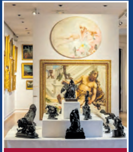
Skulpturen / Möbelstücke

Viele Menschen zögern, alte Schätze zu verkaufen, weil sie denken, Verkauf bedeute Geldnot. Doch genau das ist nicht der Fall. Oft geht es darum, dass wertvolle Stücke in gute Hände kommen und auch in Zukunft respektiert, gepflegt und geschätzt werden. Bei dem Auktionshaus von Falkenberg sorgen wir dafür, dass jedes Objekt mit Würde weitergegeben wird und seine Geschichte bewahrt bleibt. So finden alte Schätze einen neuen Platz, an dem sie weiterleben dürfen. 8 TAGE. 10 EXPERTEN. KOSTENLOSE BEWERTUNG - JETZT TERMIN SICHERN!