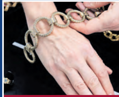
Wir zahlen Schmuckpreise