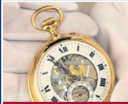
Uhren / Taschenuhren