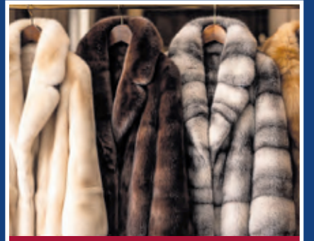
Pelze aller Art