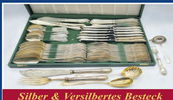
Silber & Versilbertes Besteck