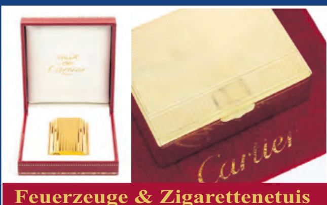
Feuerzeuge & Zigarettenetuis

Kostenlose Expertise & Bewertung - Wir zahlen bis zu 167,50 € pro Gramm!