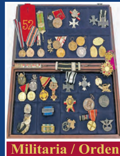
Militaria / Orden