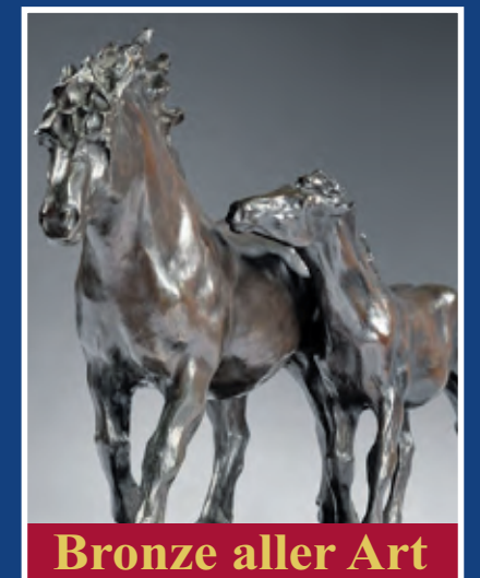
Bronze aller Art

Kostenlose Expertise & Bewertung - Wir zahlen bis zu 167,50 € pro Gramm!