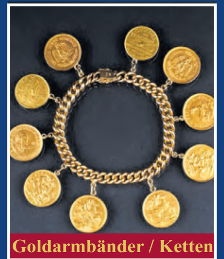
Goldarmbänder / Ketten

Bei uns wird nicht nur der Goldwert berechnet, sondern zusätzlich der Schmuckpreis, der in der Regel 15-20 % über dem reinen Materialwert liegt – egal ob Altgold oder Bruchgold. Für jedes Stück haben wir einen fairen und individuellen Preis. Familiengeführt seit 1977 mit über 49 Jahren Erfahrung stehen wir für Fachwissen, Vertrauen und ehrliche Bewertung.