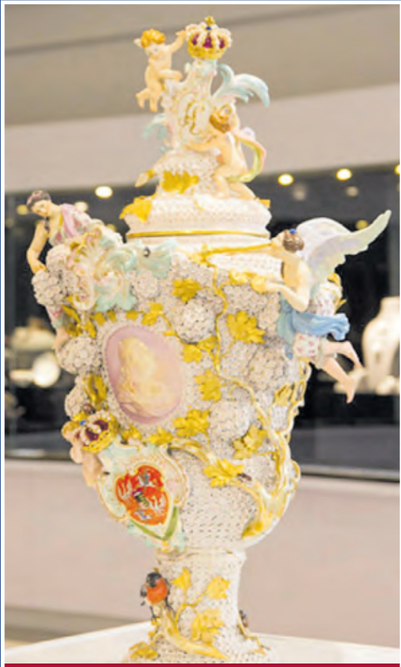
Porzellan aller Munufakturen