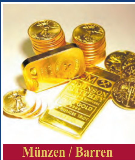
Münzen / Barren