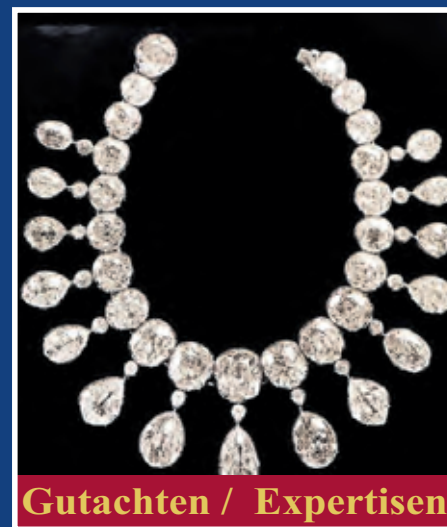
Gutachten / Expertisen