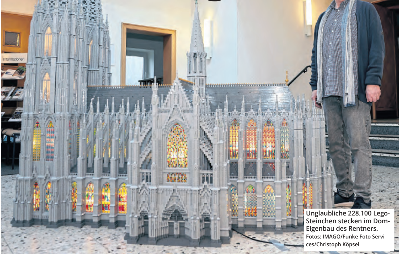
Unglaubliche 228.100 Lego-Steinchen stecken im Dom-Eigenbau des Rentners.