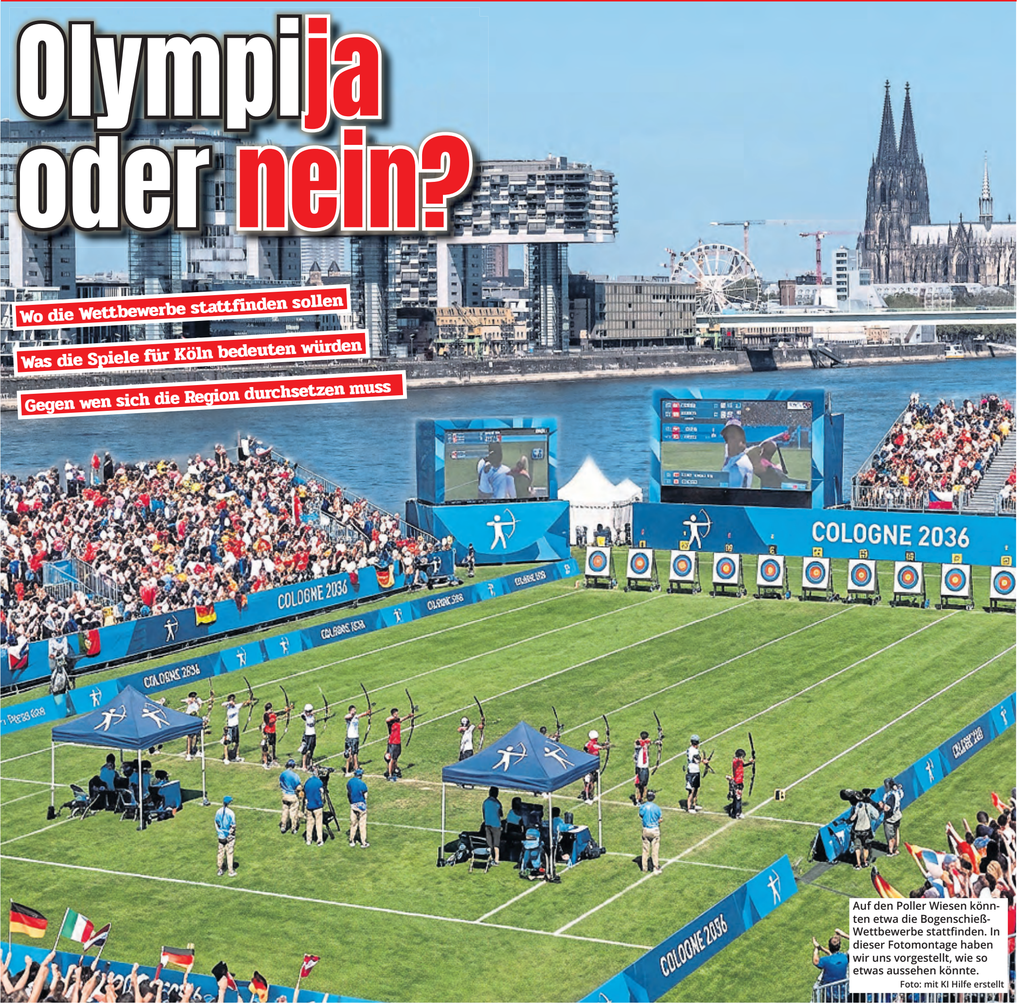
Auf den Poller Wiesen könnten etwa die Bogenschieß-Wettbewerbe stattfinden. In dieser Fotomontage haben wir uns vorgestellt, wie so etwas aussehen könnte.

Gegen wen sich die Region durchsetzen muss