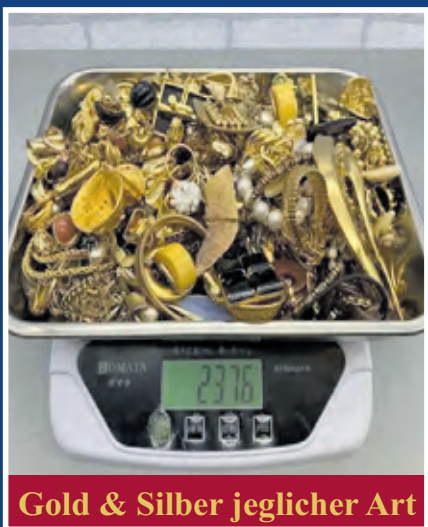
Gold & Silber jeglicher Art