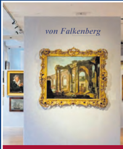
Gemälde aller Epochen