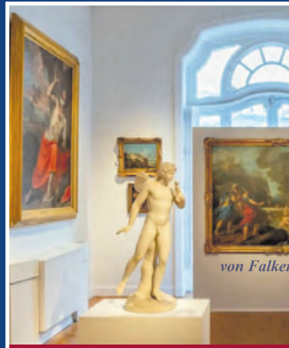
Jagdliches / Trophäen