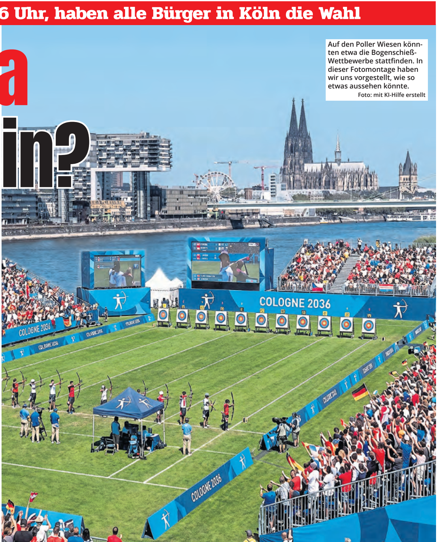
Auf den Poller Wiesen könnten etwa die Bogenschieß-Wettbewerbe stattfinden. In dieser Fotomontage haben wir uns vorgestellt, wie so etwas aussehen könnte.

Müssen neue Sportstätten gebaut werden? Das Konzept sieht vor, dass alle Wettkämpfe in bereits bestehenden oder temporären Sportstätten ausgetragen werden sollen. Lediglich das temporäre Leichtathletik-Stadion sowie das Olympische Dorf sollen im neuen Kölner Stadtteil Kreuzfeld entstehen, nach den Spielen aber anderweitig weitergenutzt werden. Das Ziel dabei: Beide Infrastrukturprojekte sollen Kreuzfeld als Wohnquartier einen dauerhaften Mehrwert bieten. Der neue Stadtteil könne dadurch als vielseitiger Sport-, Spiel-, Erholungs-, Bildungs- und Wohnraum weiterentwickelt werden.