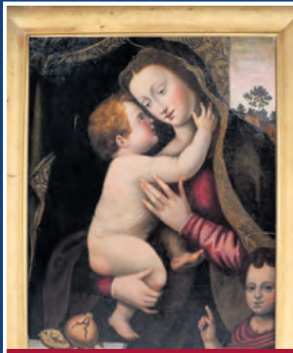
Antiquitäten aller Art