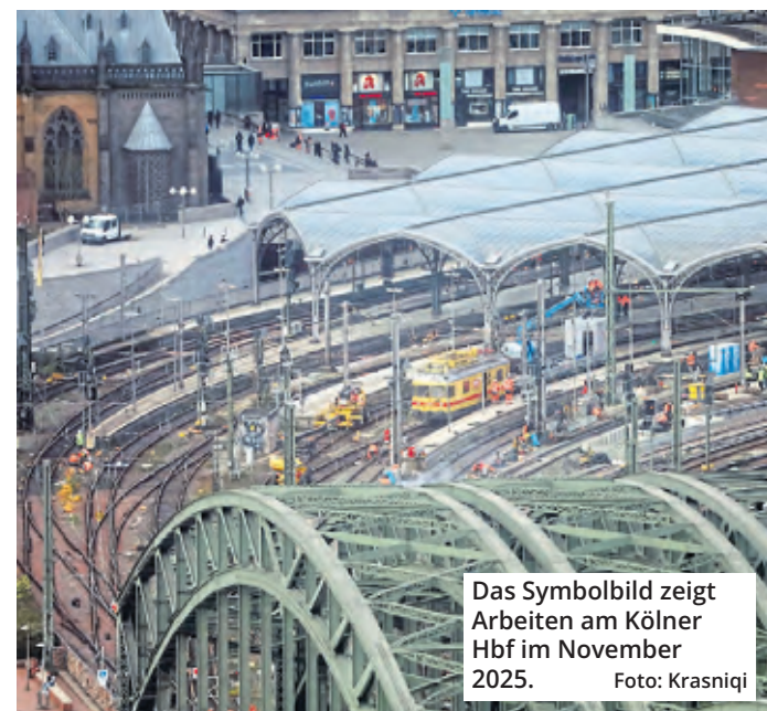
Das Symbolbild zeigt Arbeiten am Kölner Hbf im November 2025.

„Wir wollen schnell beginnen“, sagte Verkehrsminister Krischer. Er könne sich vorstellen, dass der Bau der neuen Bahnsteige im Hauptbahnhof und Deutz ohne größere Einschränkungen des Bahnverkehrs möglich ist.