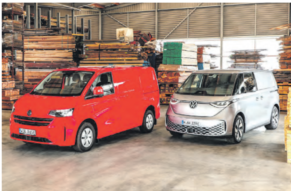
Bereit für nützliche Aufgaben: Der e-Transporter (links) und der ID. Buzz Cargo