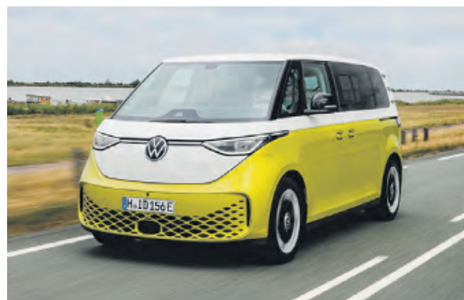
Der ID. Buzz bietet viele attraktive Modellvarianten

Entwickelt wurde diese Lösung gemeinsam mit dem niederländischen Unternehmen Snoeks Automotive. Die Trennwand wird direkt bei der Neuwagen-Konfi-