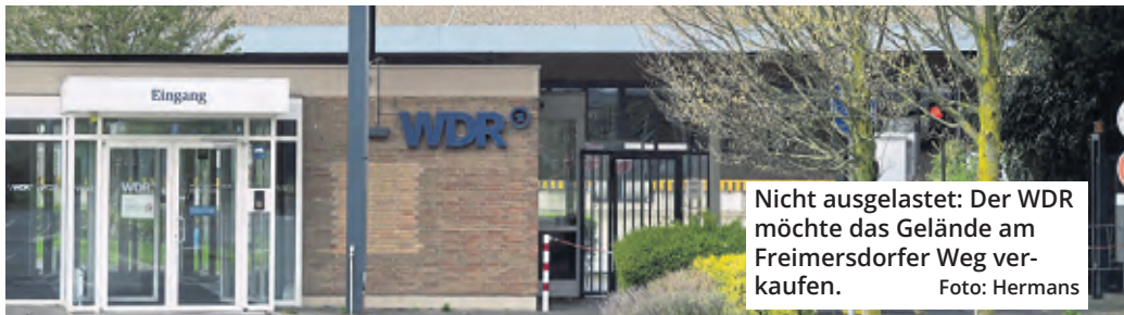
Nicht ausgelastet: Der WDR möchte das Gelände am Freimersdorfer Weg verkaufen.