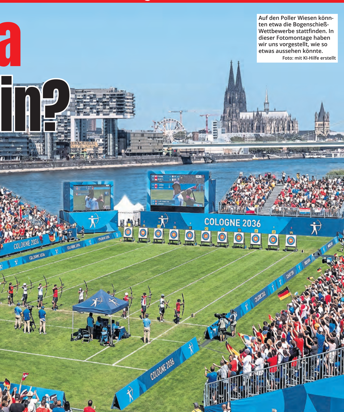
Auf den Poller Wiesen könnten etwa die Bogenschieß-Wettbewerbe stattfinden. In dieser Fotomontage haben wir uns vorgestellt, wie so etwas aussehen könnte. Foto: mit KI-Hilfe erstellt

Müssen neue Sportstätten gebaut werden? Das Konzept sieht vor, dass alle Wettkämpfe in bereits bestehenden oder temporären Sportstätten ausgetragen werden sollen. Lediglich das temporäre Leichtathletik-Stadion sowie das Olympische Dorf sollen im neuen Kölner Stadtteil Kreuzfeld entstehen, nach den Spielen aber anderweitig weitergenutzt werden. Das Ziel dabei: Beide Infrastrukturprojekte sollen Kreuzfeld als Wohnquartier einen dauerhaften Mehrwert bieten. Der neue Stadtteil könne dadurch als vielseitiger Sport-, Spiel-, Erholungs-, Bildungs- und Wohnraum weiterentwickelt werden.