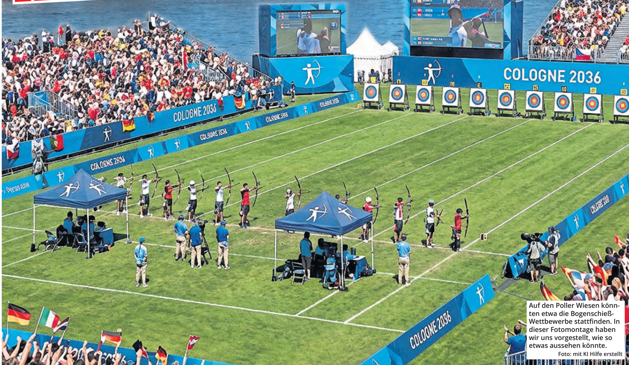
Auf den Poller Wiesen könnten etwa die Bogenschieß-Wettbewerbe stattfinden. In dieser Fotomontage haben wir uns vorgestellt, wie so etwas aussehen könnte.

Gegen wen sich die Region durchsetzen muss