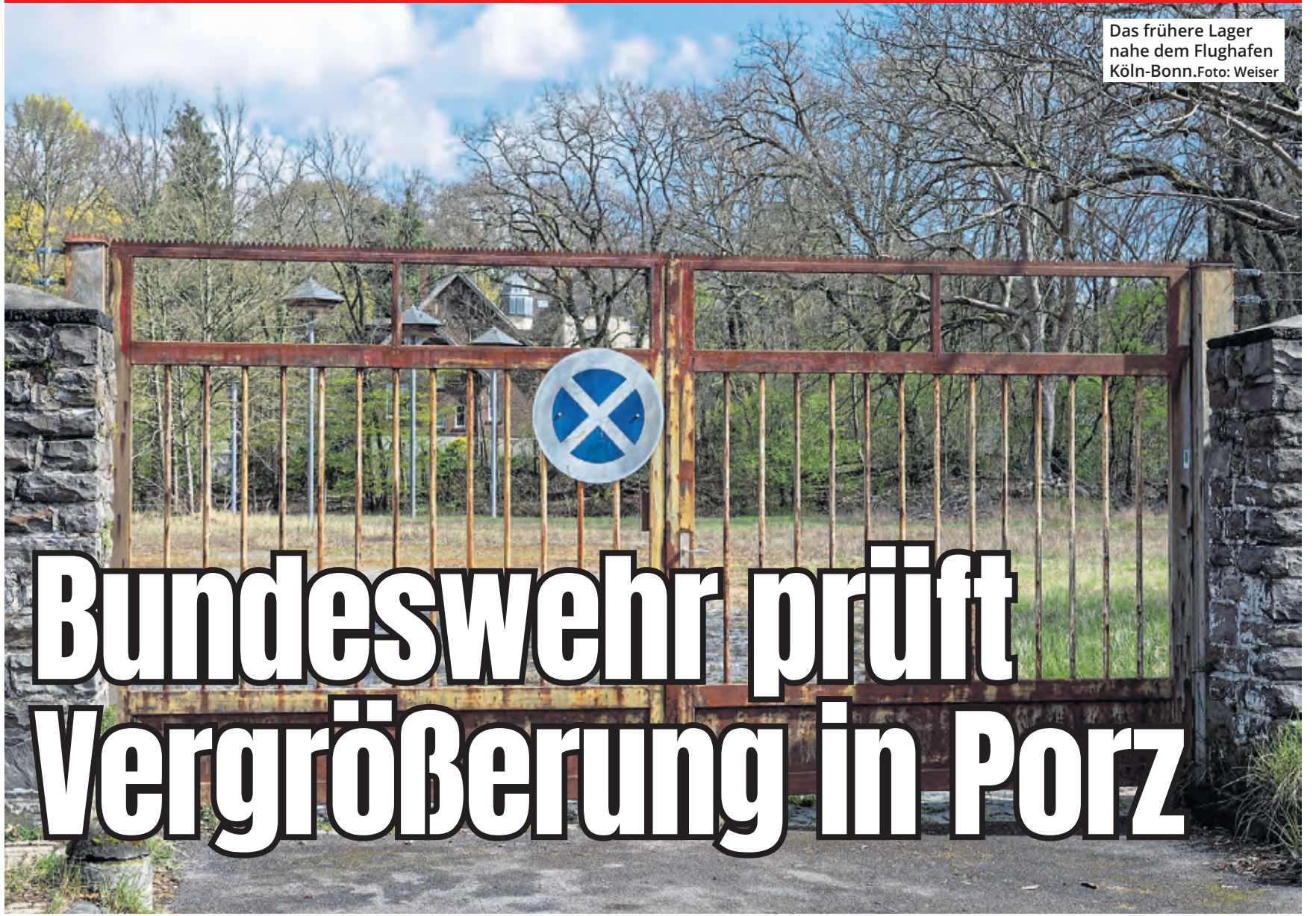
Das frühere Lager nahe dem Flughafen Köln-Bonn.