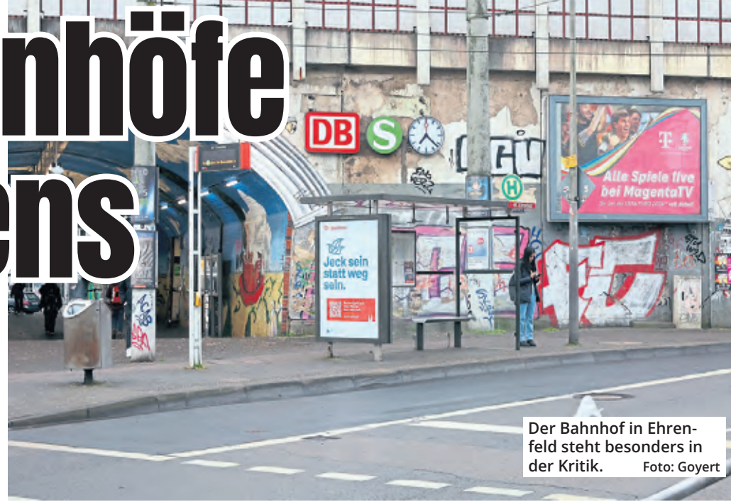
Der Bahnhof in Ehrenfeld steht besonders in der Kritik.

Die Deutsche Bahn, die für die meisten Bahnhöfe (143) verantwortlich ist, hat nach eigenen Angaben mit Unterstützung von