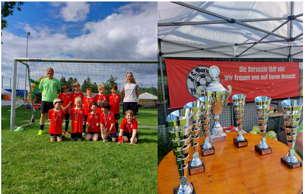
Impressionen vom 2. Karl-Ludwig Vaaßen Cup

Die Bourssia aus Buir veranstaltete am Samstag, den 22.06. sowie am Sonntag, den 23.06.2024 die zweite Austragung des Karl-Ludwig Vaaßen Cup. Die Jugendturniere (G- bis C-Jugend) erfreuten sich an einer großen Teilnehmerzahl und fußballbegeisterten Zuschauern. In der G-Jugend holten sich die Kicker des SV Horrem den Siegerpokal, während die Mannschaften des SV Ertstolz Niederaußem (als Zweitplatzierte) und SV Fühligen-Chorweiler sich über ihre Platzierungen (und Pokale) auf dem Siegestreppchen freuen durften. In der F-Jugend bezwang die Mannschaft des VfL Vichtal unsere Jungs vom FC Borussia Buir in einer heiß umkämpften und sehenswerten Partie mit 4:2 und gingen als Turniersieger hervor. Der drittplatzierte Ballverein aus Bedburg durfte sich ebenfalls über einen Pokal freuen. In der E-Jugend behielt der GKSC Hürth mit am Ende zwei Punkten Vorsprung die Nase knapp vorne und holte sich den 1. Platz, während der 1.FC Quadrath-Ichendorf das Nachsehen hatte, sich aber ungeschlagen mit dem 2. Platz anfreunden konnte. Den dritten Platz holten sich unsere Nachbarn vom VfL Sindorf hauchzart vor den Jungs des Gastgebers.