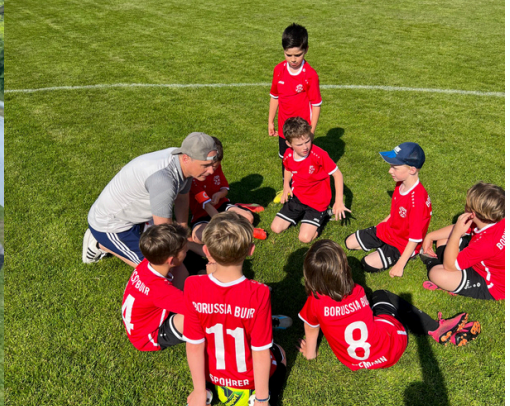
Impressionen von unserer Jugend im Laufe der abgelaufenen Spielzeit