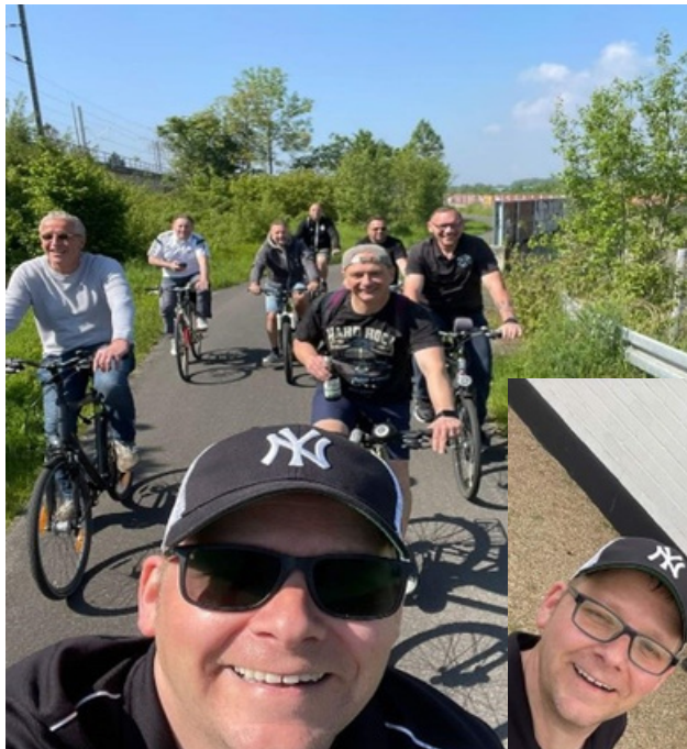
Impressionen von der Vatertagstour der Alten Herren.

Am diesjährigen Vatertag zog es 8 Sportkameraden der Alten Herren auf eine kleine Rundreise mit dem Fahrrad. Reiseroute: Buir - Elsdorf - Heppendorf - Sindorf - Horrem - Buir. Wir trafen uns vor dem Vereinsheim und die Stimmung war zu diesem Zeitpunkt schon großartig. Bei einem ersten Bierchen wurde die Route besprochen. Wir fuhren zum Aussichtspunkt TerraNova und spielten eine Partie Minigolf.