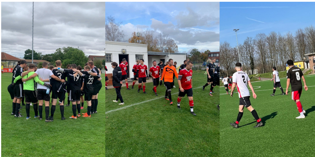
Impressionen aus der vergangenen Saison

Trotz aller Bemühungen endete die durchwachsene Saison auf Rang neun in der Schlusstabelle. Den insgesamt neun Siegen und vier Unentschieden standen 13 Niederlagen gegenüber, was letztlich eine Position im unteren Mittelfeld zur Folge hatte. Ein Hauptproblem lag dabei in der Defensive, die mit insgesamt 78 Gegentreffern zu den anfälligsten der Liga zählte. Diese Schwäche zog sich durch die gesamte Saison und verhinderte eine bessere Platzierung. Auch ein notwendiger Wechsel auf der Position des Torhüters zur Rückrunde konnte den Trend nicht umkehren. Besonders schmerzlich war der Verlust mehrerer langjähriger Leistungsträger, deren Abgänge nur schwer zu kompensieren waren. Das junge Team zeigte zwar immer wieder Ansätze von Potential und Kampfgeist, jedoch reichte dies – gepaart mit weiterem Verletzungspech – oft nicht aus, um sich gegen erfahrenere Mannschaften durchzusetzen. Trotz allem gab es auch positive Aspekte, auf die aufgebaut werden kann: der Zusammenhalt im Team und die Unterstützung der Fans blieben ungebrochen stark.