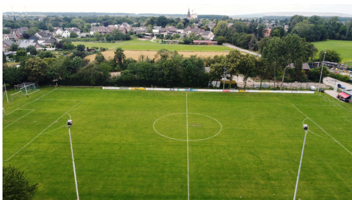
Blick auf die aktuelle Sportanlage des FC Borussia Buir

In der Folge wurde aber auch die Idee des FC Borussia Buir 1919 erneut betrachtet, mit der wir als Bauherr für das gesamte Neubauprojekt am Blatzheimer Weg mit einem hohen Förderungsanteil der Kolpingstadt Kerpen den Bau des neuen Sportplatzes eigenverantwortlich umsetzen wollten.