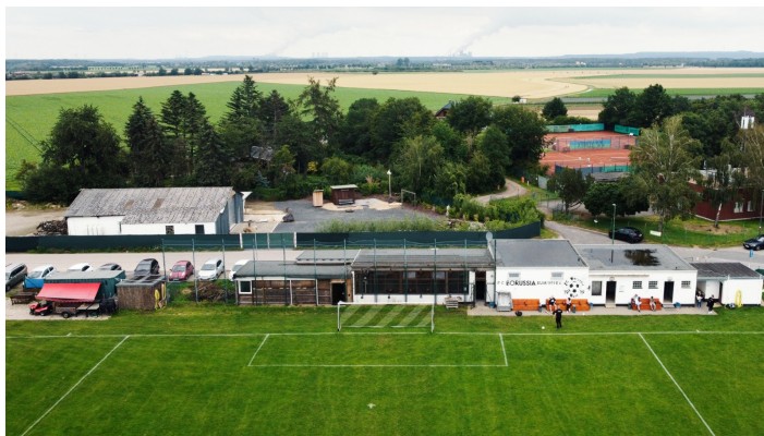
Blick auf die aktuelle Sportanlage und das Sportlerheim des FC Borussia Buir

Derzeit ist es feste Absicht, das Projekt gemeinsam mit der Kolpingstadt Kerpen und dem FC Borussia Buir erfolgreich umzusetzen. Alle Beteiligten bleiben gegenwärtig bei der Vereinbarung der letzten Jahre, nur noch zwingend notwendige Sanierungsarbeiten an den bestehenden Plätzen und dem Vereinsheim in Abstimmung mit dem Verein umzusetzen. Beispielhaft ist die aufkommende Minimalsanierung des Flutlichtes mit nur einem Interims-Lichtmast zu erwähnen.