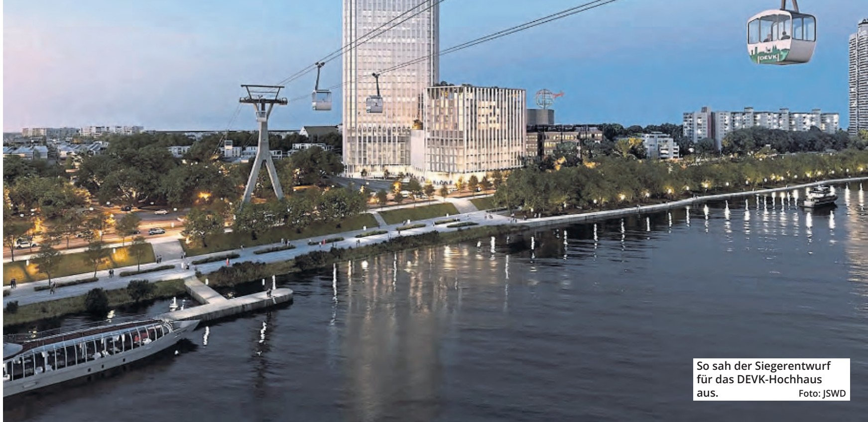
So sah der Siegerentwurf für das DEVK-Hochhaus aus.

Der Versicherer träumte von einem 144-Meter-Büroturm, doch jetzt ist endgültig klar: Das Gebäude an der Zoostraße kommt nicht.