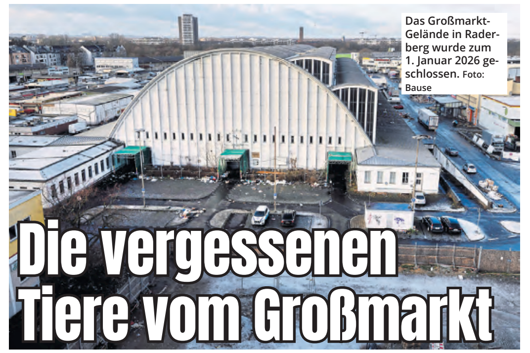
Das Großmarkt-Gelände in Raderberg wurde zum 1. Januar 2026 geschlossen.