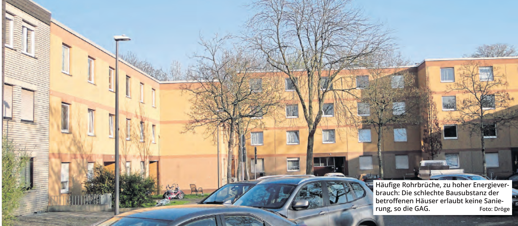
Häufige Rohrbrüche, zu hoher Energieverbrauch: Die schlechte Bausubstanz der betroffenen Häuser erlaubt keine Sanierung, so die GAG.

Anstelle der 34 Wohneinheiten in den nicht mehr zeitgemäßen und von zahlreichen Mängeln gezeichneten 70er-Bauten solle ein modernes Ensemble mit 62 öffentlich geförderten Wohneinheiten entstehen, führte Rickmann aus. „Wir schaffen an dieser Stelle 28 neue Wohneinheiten, insgesamt 38 Prozent mehr Wohnfläche“, sagte er. Die geplanten Gebäude sollen modernen Energiestandards genügen, die Wohnungen bar-