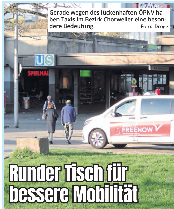
Gerade wegen des lückenhaften ÖPNV haben Taxis im Bezirk Chorweiler eine besondere Bedeutung.