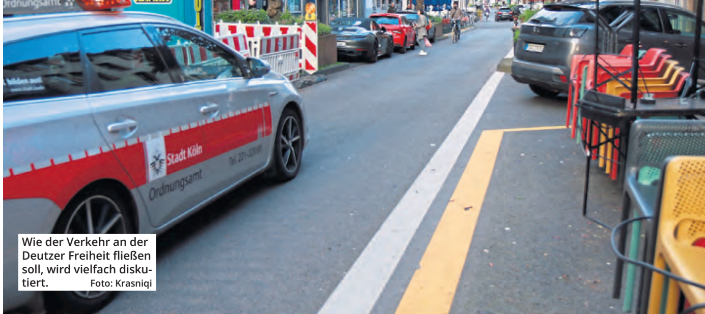
Wie der Verkehr an der Deutzer Freiheit fließen soll, wird vielfach diskutiert.

Ob die Deutzer Freiheit in Zukunft autofrei sein wird, liegt in den Händen der Bezirksvertretung Innenstadt. Als Grundlage für eine Entscheidung soll, wie berichtet, ein Bürgerdialog dienen, der derzeit hinter verschlossenen Türen läuft. Dem Vernehmen nach werden drei Varianten diskutiert, wie sich die Straße in Zukunft umgestalten ließe. Die Teilnehmer der Mediation haben auf Wunsch des Mobilitätsdezernats eine Schweigevereinbarung getroffen, die bis zum Abschluss am 17. April gilt. Laut der Stadt ist eine öffentliche Informationsveranstaltung geplant. Aus der Wirtschaft gab es bereits kritische Stimmen.