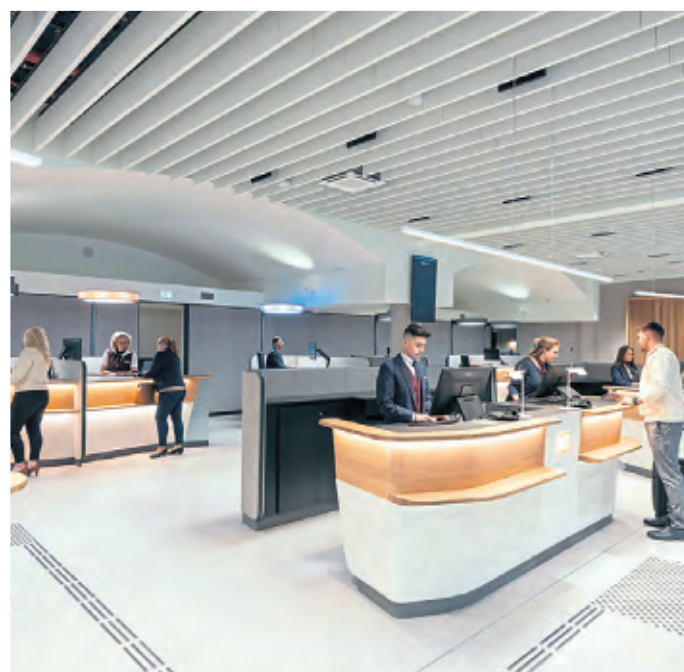
An insgesamt zwölf Beratungs- und Verkaufsschaltern werden Kunden bedient.