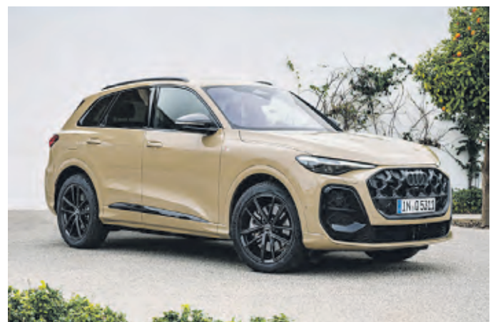
Audi hat die Q5-Familie erweitert