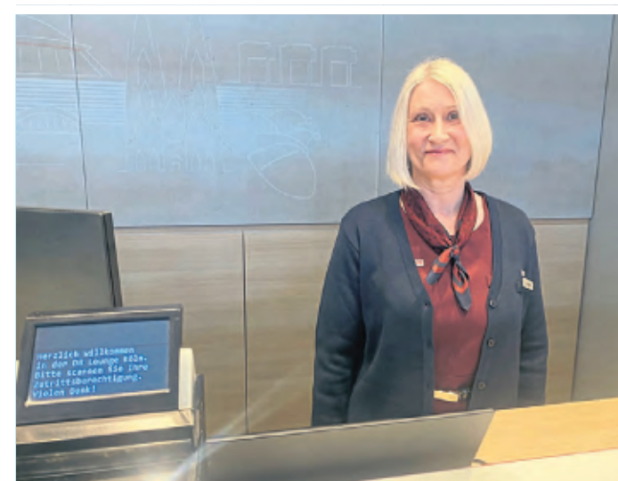
Reisende werden mit einem freundlichen Lächeln empfangen.

die Bevölkerung einer Stadt wie Hamm an- oder abfahren. Insgesamt frequentieren den Hauptbahnhof 300.000 Menschen täglich. Nach Düsseldorf, Nürnberg, Hamburg und Berlin ist das Reisezentrum in Köln das sechste, das nach dem neuen DB-Konzept modernisiert wurde. In diesem Jahr sollen noch Mannheim, Dresden und Göttingen folgen. In neuem Glanz eröffnete in Köln auch die vom Gleis 1 erreichbare DB Lounge für Premiumkunden der Bahn. Designerlampen des Herstellers „Ochchio“ im Stückwert von über 3000 Euro schweben über der Cafeteria, an der Kaffeespezialitäten „in Barista-Qualität“ und Snacks, aber auch warme Speisen angeboten werden.