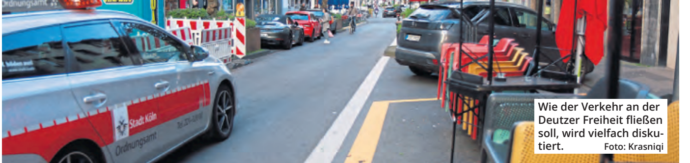
Wie der Verkehr an der Deutzer Freiheit fließen soll, wird vielfach diskutiert.

Ob die Deutzer Freiheit autofrei sein wird, liegt in den Händen der Bezirksvertretung Innenstadt. Als Grundlage für eine Entscheidung soll ein Bürgerdialog dienen, der hinter verschlossenen Türen läuft. Dabei werden drei Varianten diskutiert, wie sich die Straße in Zukunft umgestalten ließe. Die Teilnehmer der Mediation haben auf Wunsch des Mobilitätsdezernats eine Schweigevereinbarung getroffen, die bis zum Abschluss am 17. April gilt. Laut der Stadt ist eine Infoveranstaltung geplant. Aus der Wirtschaft gab es bereits kritische Stimmen.