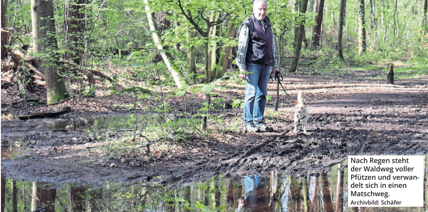
Nach Regen steht der Waldweg voller Pfützen und verwandelt sich in einen Matschweg.

2016 wandte sich Brochhagen erstmals an den Forstbetrieb Dünnwald, später an das Grünflächenamt sowie an Politik und Verwaltung – ohne sichtbaren Erfolg. Nach einem Artikel dieser Zeitung kam 2024 Bewegung in die Sache, als das Grünflächenamt einen Ortstermin zusagte. Gemeinsam mit den Verantwortlichen Michael Hundt und Jörn Anlauf wurde der Weg begutachtet. „Sie haben mir zugesagt, dass die Vertiefungen im Weg aufgefüllt werden sollen und die Stellen der Pfützen bearbeitet werden sollen, sodass