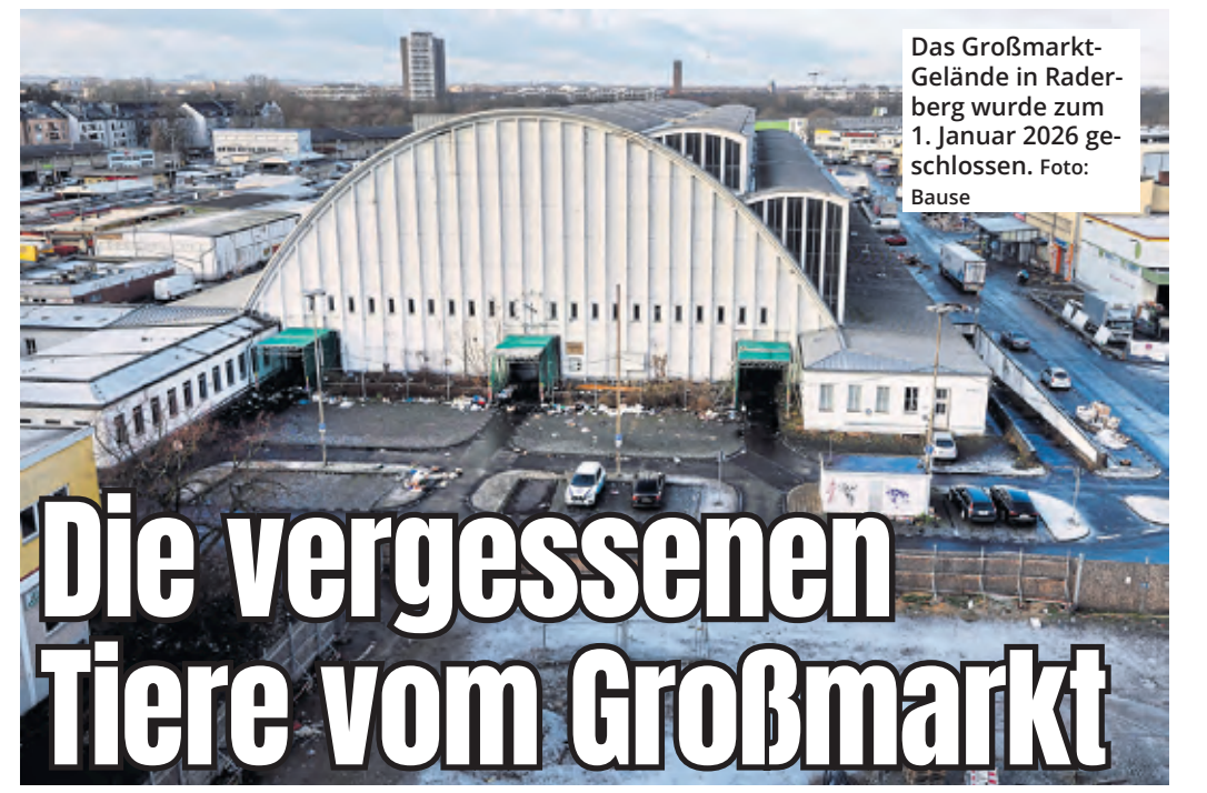
Das Großmarkt-Gelände in Raderberg wurde zum 1. Januar 2026 geschlossen.