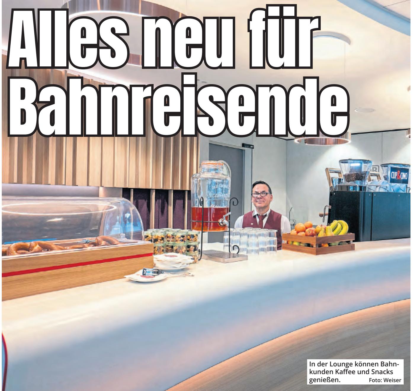
In der Lounge können Bahnkunden Kaffee und Snacks genießen.