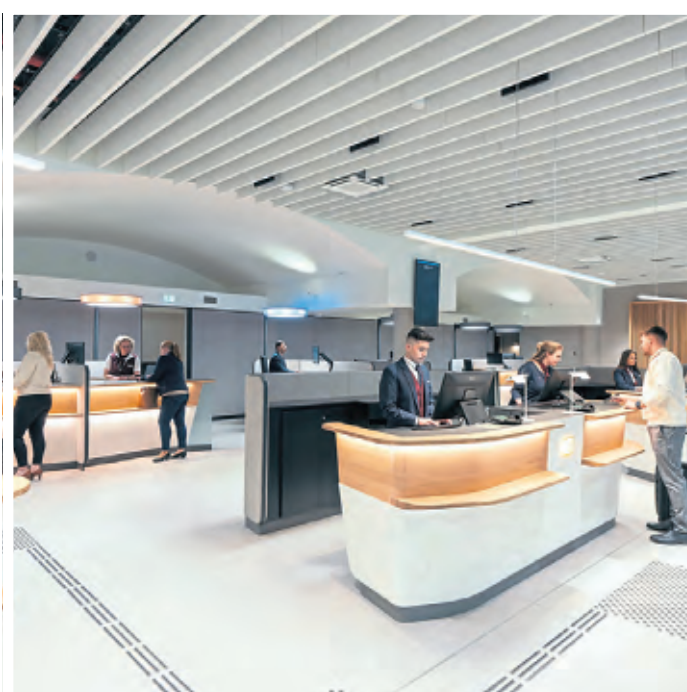
Reisende werden mit einem freundlichen Lächeln empfangen.

die Bevölkerung einer Stadt wie Hamm an- oder abfahren. Insgesamt frequentieren den Hauptbahnhof 300.000 Menschen täglich. Nach Düsseldorf, Nürnberg, Hamburg und Berlin ist das Reisezentrum in Köln das sechste, das nach dem neuen DB-Konzept modernisiert wurde. In diesem Jahr sollen noch Mannheim, Dresden und Göttingen folgen. In neuem Glanz eröffnete in Köln auch die vom Gleis 1 erreichbare DB Lounge für Premiumkunden der Bahn. Designerlampen des Herstellers „Ochchio“ im Stückwert von über 3000 Euro schweben über der Cafeteria, der Kaffeespezialitäten „in Barista-Qualität“ und Snacks, aber auch warme Speisen angeboten werden.