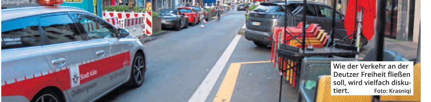
Wie der Verkehr an der Deutzer Freiheit fließen soll, wird vielfach diskutiert.

Ob die Deutzer Freiheit autofrei sein wird, liegt in den Händen der Bezirksvertretung Innenstadt. Als Grundlage für eine Entscheidung soll ein Bürgerdialog dienen, der hinter verschlossenen Türen läuft. Dabei werden drei Varianten diskutiert, wie sich die Straße in Zukunft umgestalten ließe. Die Teilnehmer der Mediation haben auf Wunsch des Mobilitätsdezernats eine Schweigevereinbarung getroffen, die bis zum Abschluss am 17. April gilt. Laut der Stadt ist eine Infoveranstaltung geplant. Aus der Wirtschaft gab es bereits kritische Stimmen.