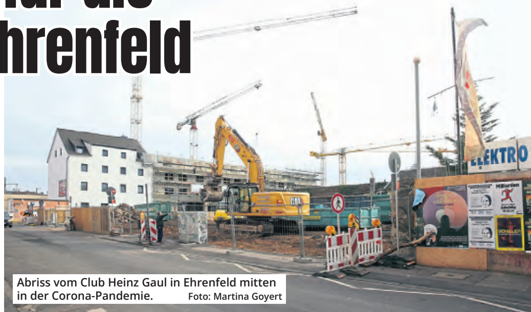
Abriß vom Club Heinz Gaul in Ehrenfeld mitten in der Corona-Pandemie.

stellt der Flächennutzungsplan im nördlichen Bereich des Änderungsgebiets Wohnbaufläche und Grünfläche dar, im südwestlichen Bereich sind Gewerbe- und Industriegebiete ausgewiesen. Im nördlichen Teilbereich sind außerdem Post, Kindertageseinrichtung, Jugendeinrichtung und Grünfläche verzeichnet. Im Mittelpunkt der neuen Planung steht der Schutz der bestehenden Clubs vor weiteren Verdrängungsmechanismen. Deshalb sollen die Bereiche der bestehenden Clubs künftig als Mischfläche ausgewiesen werden. Für das Thyssen-Gelände an der Oskar-Jäger-Straße ist dagegen ein Gewerbegebiet vorgesehen, weil die Planung dort bereits weiter fortgeschritten ist. Um das Vorhaben umzusetzen, sind planungsrechtli-