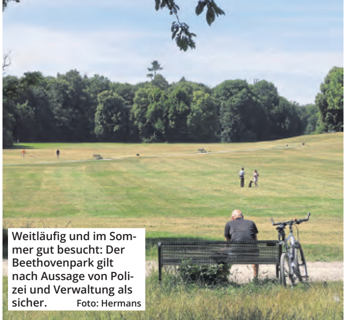
Weitläufig und im Sommer gut besucht: Der Beethovenpark gilt nach Aussage von Polizei und Verwaltung als sicher.