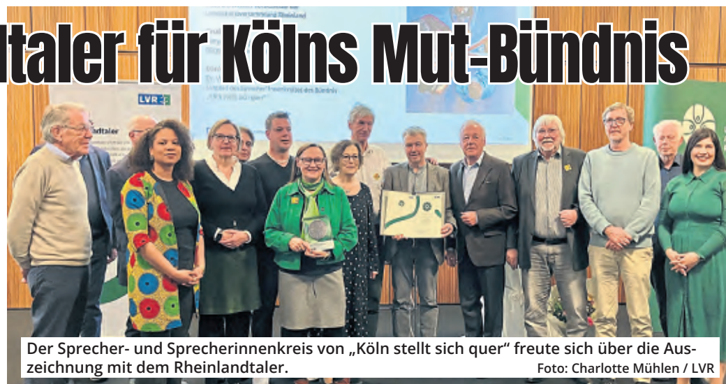
Der Sprecher- und Sprecherinnenkreis von „Köln stellt sich quer“ freute sich über die Auszeichnung mit dem Rheinlandtaler.

Seit 2008 setzen sich dort Vertreter aus Kirchen und Religionsgemeinschaften, Gewerkschaften, demokratischen Parteien im Kölner Rat, Vereinen, Verbänden und Bürgerinitiativen gegen Rechtsextremismus,