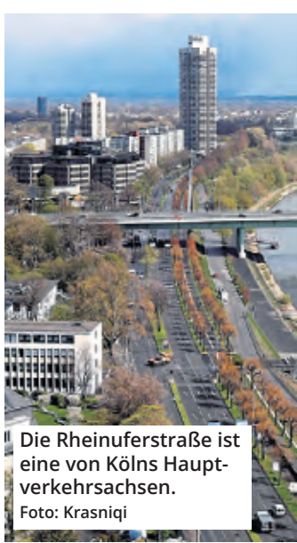
Die Rheinuferstraße ist eine von Kölns Hauptverkehrsachsen.