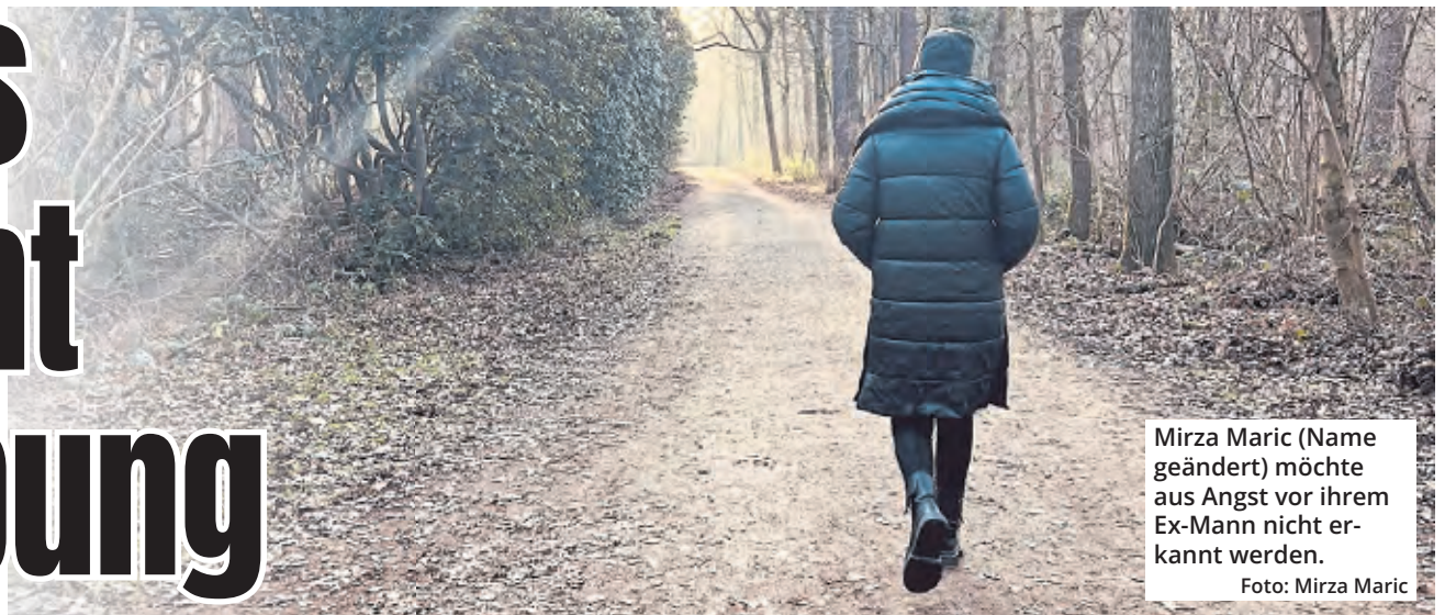
Mirza Maric (Name geändert) möchte aus Angst vor ihrem Ex-Mann nicht erkannt werden. Foto: Mirza Maric