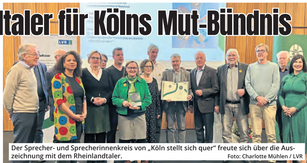
Der Sprecher- und Sprecherinnenkreis von „Köln stellt sich quer“ freute sich über die Auszeichnung mit dem Rheinlandtaler.

Seit 2008 setzen sich dort Vertreter aus Kirchen und Religionsgemeinschaften, Gewerkschaften, demokratischen Parteien im Kölner Rat, Vereinen, Verbänden und Bürgerinitiativen gegen Rechtsextremismus,