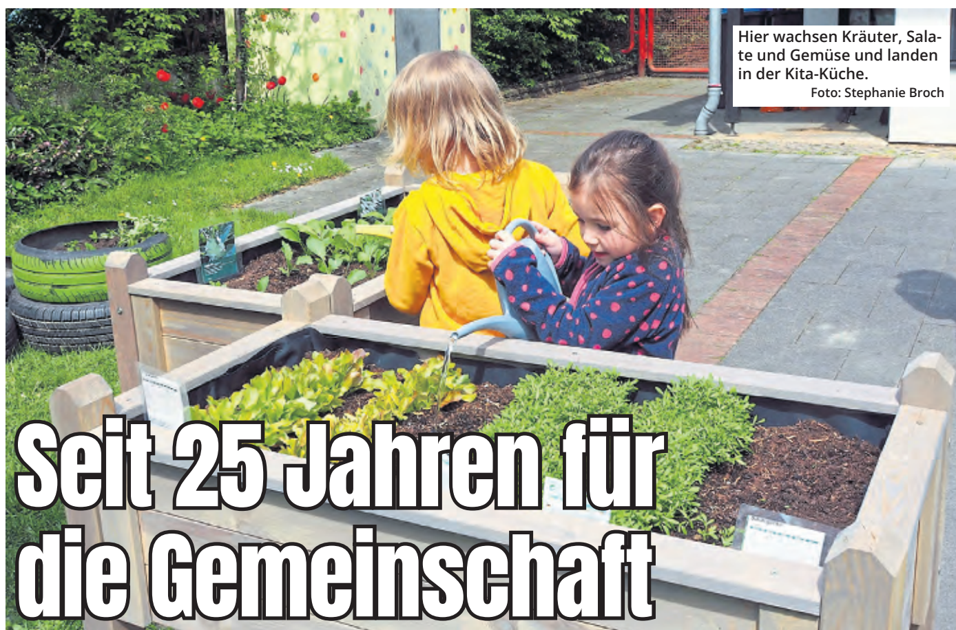
Hier wachsen Kräuter, Salate und Gemüse und landen in der Kita-Küche.

für die Bürgerinnen und Bürger der Stadt – ist enorm, weil Köln durch solche Versammlungen regelmäßig lahmgelegt wird.“ Der stockende Verkehrsfluss und das gestiegene Einsatzaufkommen tragen laut Polizeidirektor Lotz auch dazu bei, dass die Polizei im vergangenen Jahr länger bis zum Einsatzort gebraucht hat als noch 2024. Im Schnitt waren es 2025 17 Minuten und 19 Sekunden – gegenüber 16 Minuten und 50 Sekunden im Vorjahr.