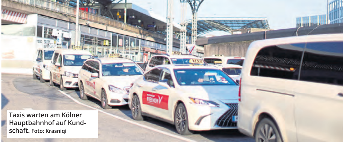
Taxis warten am Kölner Hauptbahnhof auf Kundenschaft.

Eine Fahrt mit dem Taxi in Köln wird so teuer wie nirgendwo sonst in Deutschland. Eine deutliche Anhebung der Tarife wurde vergangene Woche vom Kölner Stadtrat beschlossen. Gleichzeitig verteuern sich dadurch Uber-Fahrten extrem.