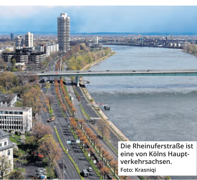
Die Rheinuferstraße ist eine von Kölns Hauptverkehrsachsen.