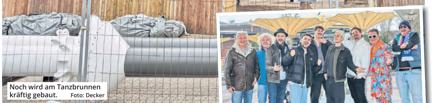
Noch wird am Tanzbrunnen kräftig gebaut.

Haftbefehl und Jazeek dabei. Busta Rhymes und Treach of Naughty by Nature sind beim Old-but-Gold-Event am 4. Juli zu erleben. Stars wie Chris de Burgh (14. Juli), Seal (20. Juli), Rick Astley (4. August), Tream (8. August) und Mark Forster (13. August) stehen auch auf dem Programm.