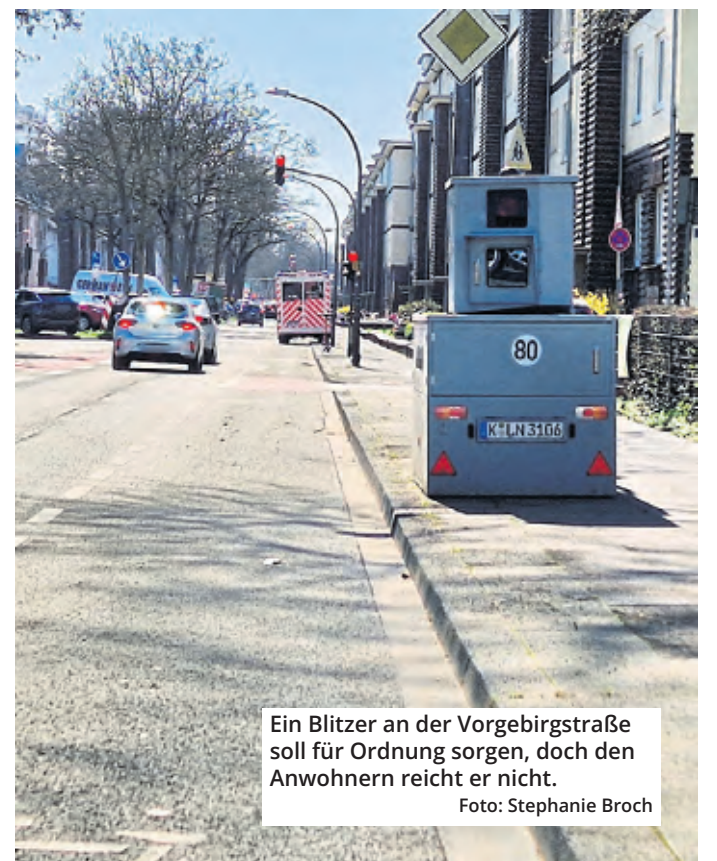
Ein Blitzer an der Vorgebirgstraße soll für Ordnung sorgen, doch den Anwohnern reicht er nicht.

Aufgrund der Zusage der Verwaltung zog die CDU ihren Antrag zurück. Wann die Seitenradarmessungen vorgenommen werden sollen, steht noch nicht fest.