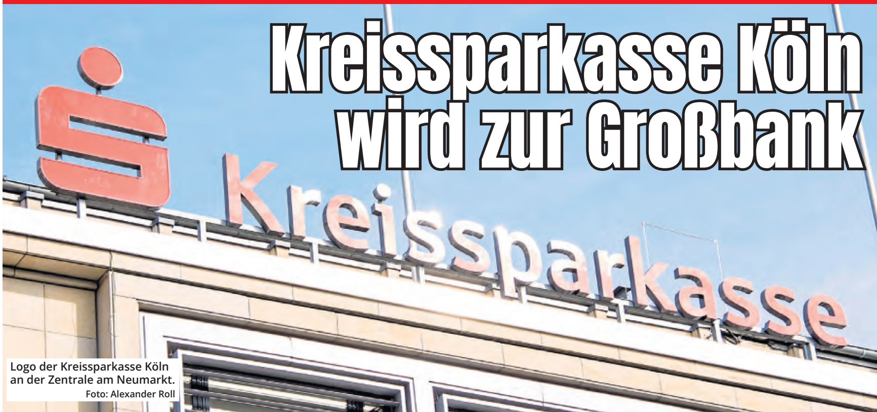
Logo der Kreissparkasse Köln an der Zentrale am Neumarkt.

Viele Jahre hat die Kreissparkasse diesen Schritt vorbereitet, nun ist es so weit. Für das Berichtsjahr 2025 gilt die größte kommunale Sparkasse Deutschlands als Großbank. Erstmals wurde im abgelaufenen Jahr die Marke von 30 Milliarden Euro bei der Bilanzsumme nach oben gerissen. Der Grund, warum man diesen Schritt lange hinauszögert hat: Ab dieser Grenze fallen Kreditinstitute unter die Aufsicht der Europäischen Zentralbank.