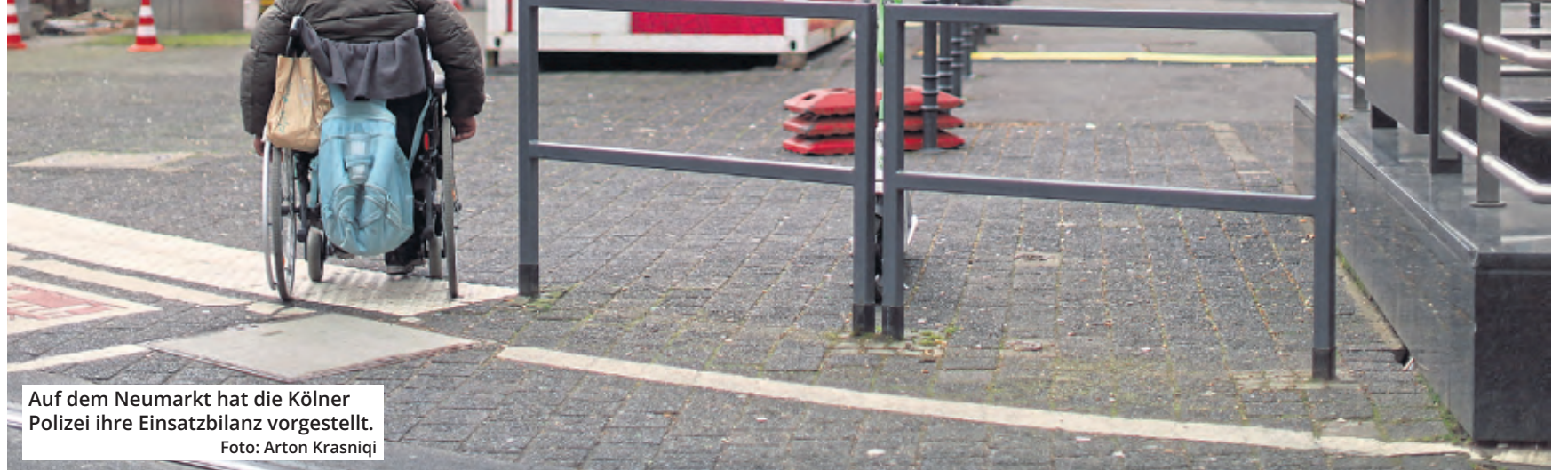
Auf dem Neumarkt hat die Kölner Polizei ihre Einsatzbilanz vorgestellt.

Diesen personellen Aufwand könne die Polizei derzeit noch stemmen, so Lotz, auch mithilfe von Einsatzkräften aus anderen Städten, die in Köln unterstützen. Dennoch sei klar: „Das sind Kräfte, die woanders fehlen. Wenn dieser Einsatz zulasten anderer Maßnahmen geht, werden wir das verlagern.“ Polizeipräsident Hermanns betonte zugleich, dass das Problem am Neumarkt und den anderen Drogenhotspots der Stadt allein mit polizeilichen Mitteln nicht zu lösen sei. „Bei allem Unbill dürfen wir nicht vergessen, dass wir es bei den Konsumenten mit kranken Menschen zu tun haben, die Hilfe brauchen.“ Die Diskussi-