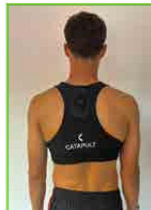
© WS-Leistungssportler mit GPS-Tracker und WHOOP-Band