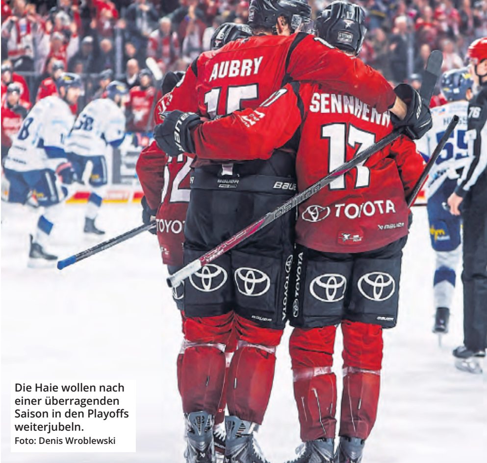
Die Haie wollen nach einer überragenden Saison in den Playoffs weiterjubeln.

116 Punkte, die beste Saison der Vereinsgeschichte und zum ersten Mal Tabellenplatz 1 seit 1999/00. Besser hätte die reguläre Spielzeit für die Kölner Haie kaum laufen können. Doch der KEC will mehr. In den Playoffs soll ab Mittwoch (19.30 Uhr, Magenta Sport) unbedingt der erste Meistertitel seit dem Jahr 2002 her.