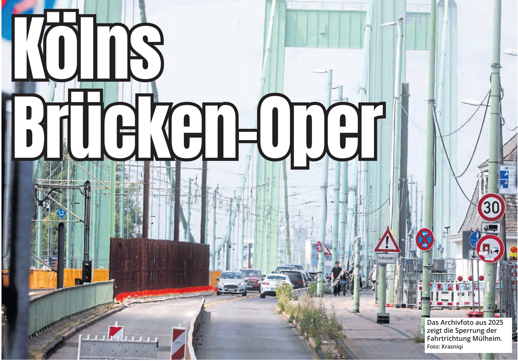
Das Archivfoto aus 2025 zeigt die Sperrung der Fahrtrichtung Mülheim.

Die Mülheimer Brücke: Seit Jahrzehnten ein Symbol dafür, wie sehr Köln mit seinen Rheinquerungen ringt. Und wie empfindlich diese Verbindungen inzwischen geworden sind. Die jüngste „Spontan-Sperrung“ einer Hälfte der Mülheimer Brücke am vergangenen Freitag reiht sich nahtlos ein in eine lange Geschichte von Schäden, Sanierungen und Teilspernungen. Von den Kosten ganz zu schweigen.