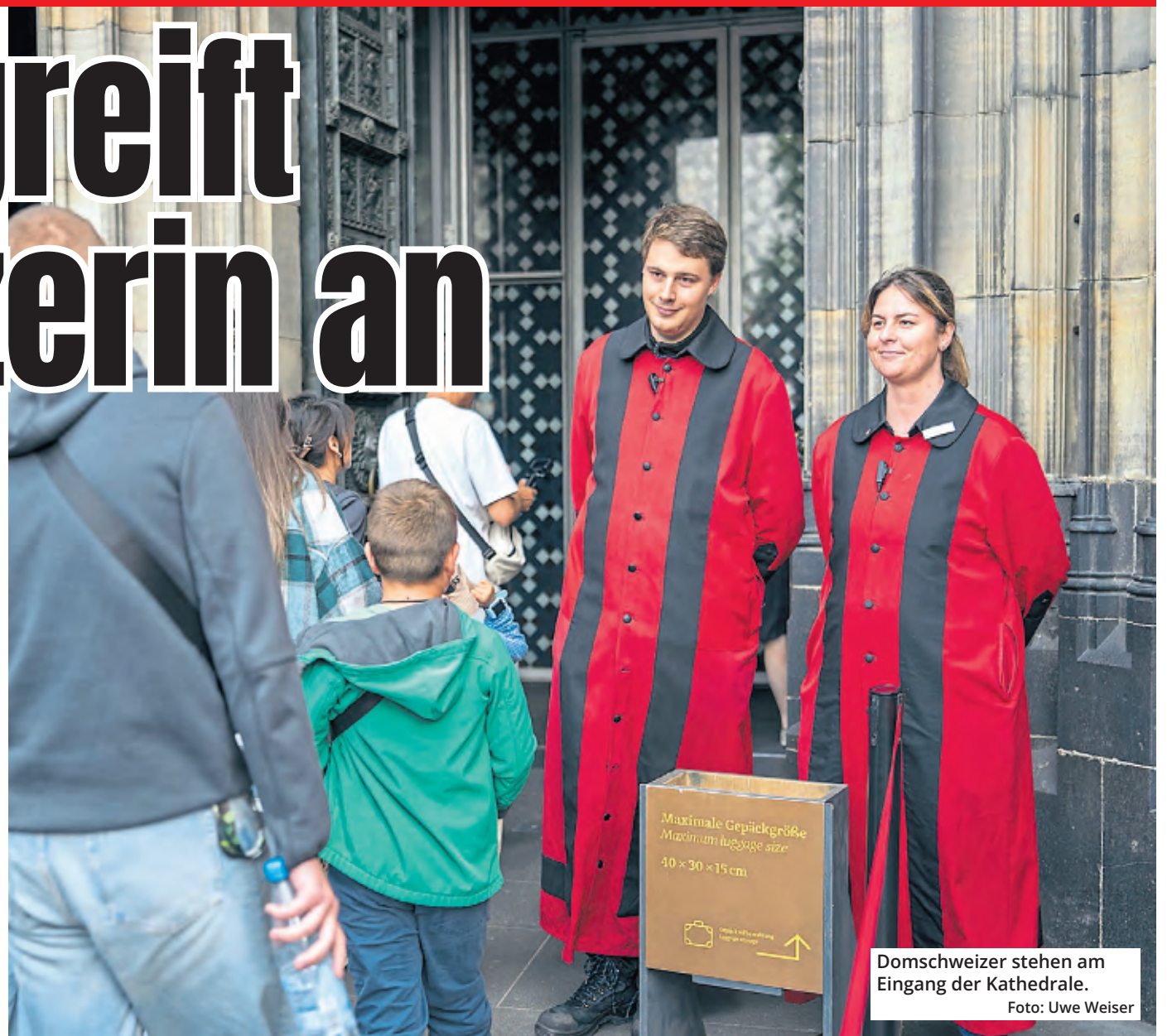
Domschweizer stehen am Eingang der Kathedrale.

„Ich war damals echt nicht zurechnungsfähig und kann auch gar nicht verstehen, wa-