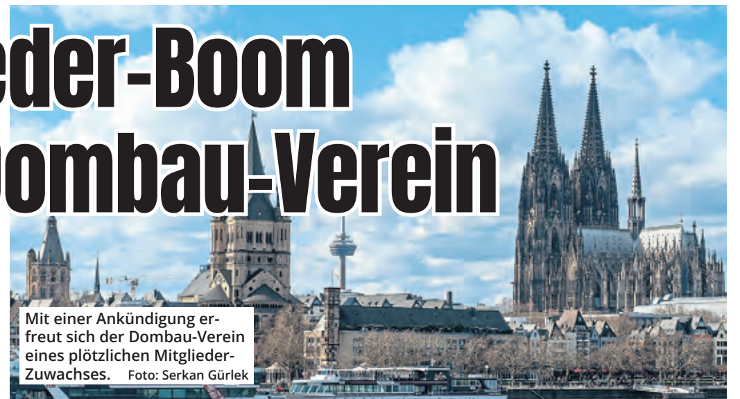
Mit einer Ankündigung erfreut sich der Dombau-Verein eines plötzlichen Mitglieder-Zuwachses.

Zwei Drittel der Neumitglieder im ZDV kommen den Angaben zufolge aus dem Postleitzahlbereich 5 mit Schwerpunkt auf Köln und Region. Ein weiteres Drittel der Eingetretenen stamme aus dem gesamten Bundesgebiet. Ein Neumitglied lebt sogar in New York. Es handelt sich hier, den Erkenntnissen des ZDV zufolge, um „versprengte Kölnerinnen und Kölner, die gelegentlich ihre Familien im Rheinland besuchen und dann ganz selbstverständlich auch in den Dom gehen wollen“.