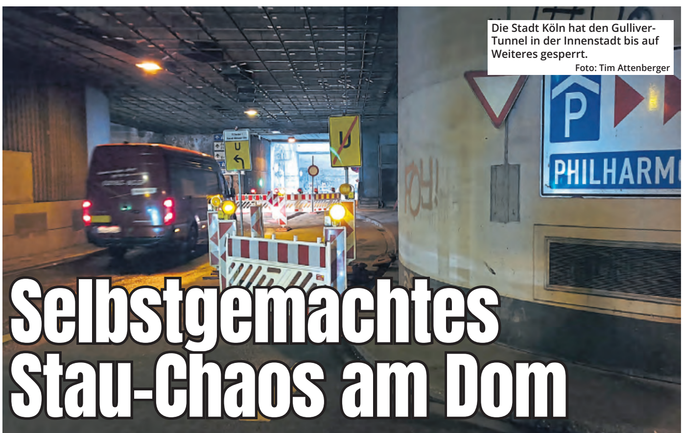
Die Stadt Köln hat den Gulliver-Tunnel in der Innenstadt bis auf Weiteres gesperrt.

Die vier Häuser sind laut Stadt seit Ende des vergangenen Jahres baulich fertiggestellt, obwohl nun noch der Einbau „der restlichen Technik, der Innenausbau und die Möblierung“ erfolgen. Auch müssen die Gebäude noch auf ihre Funktionalität überprüft werden, etwa beim Brandschutz.