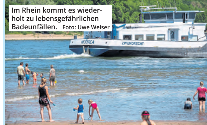
Im Rhein kommt es wiederholt zu lebensgefährlichen Badeunfällen.

Köln. Die Zahl der tödlichen Badeunfälle in Nordrhein-Westfalen ist im vergangenen Jahr zwar gesunken – doch Entwarnung gibt es nicht. Nach Angaben der Deutschen Lebensrettungs-Gesellschaft (DLRG) kamen 2025 landesweit 48 Menschen beim Baden ums Leben. Das sind neun weniger als im Jahr zuvor. Gleichzeitig zeigt die Statistik eine bedenkliche Entwicklung: Vor allem der außergewöhnlich heiße Juni ließ die Zahl der Todesfälle deutlich ansteigen. Starben in diesem Monat 2024 noch fünf Menschen, waren es 2025 bereits zwölf.