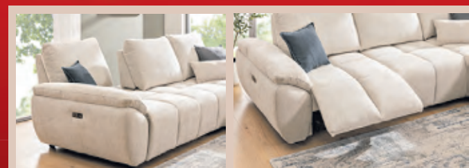
(A) inkl. Sitztiefeverstellung (B) inkl. motorischer Relaxfunktion

Polstergarnitur „Pesaro“ Stoffbezug, inkl. manueller Sitztiefeverstellung und motorischer Relaxfunktion im äußeren Sitz, best. aus: Sofa 2-Sitzer mit Armlehne links und Longchair mit Armlehne rechts, Stellmaß ca. 278x179 cm. 3873815 Preis gültig bis 28.03.2026