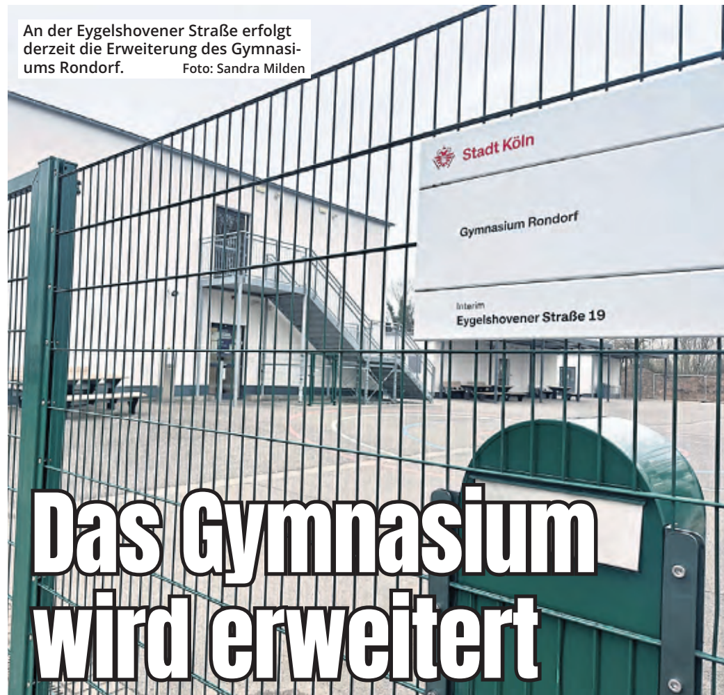
An der Eygelschovener Straße erfolgt derzeit die Erweiterung des Gymnasiums Rondorf.

jüngst mitteilte, nehmen auch die Anträge betreffend Unterbringungen nach dem PsychKG zu – 2413 Fälle im Jahr 2025 und damit knapp 100 mehr als im Vorjahr. Im Rahmen dieser Maßnahme können akut psychisch erkrankte Menschen zum Selbstschutz oder zur Gefahrenabwehr zunächst bis zu sechs Wochen in eine geschlossene Einrichtung eingewiesen werden. In 610 Fällen wurden in Köln 2025 auch Fixierungen und ähnliche Maßnahmen angeordnet.