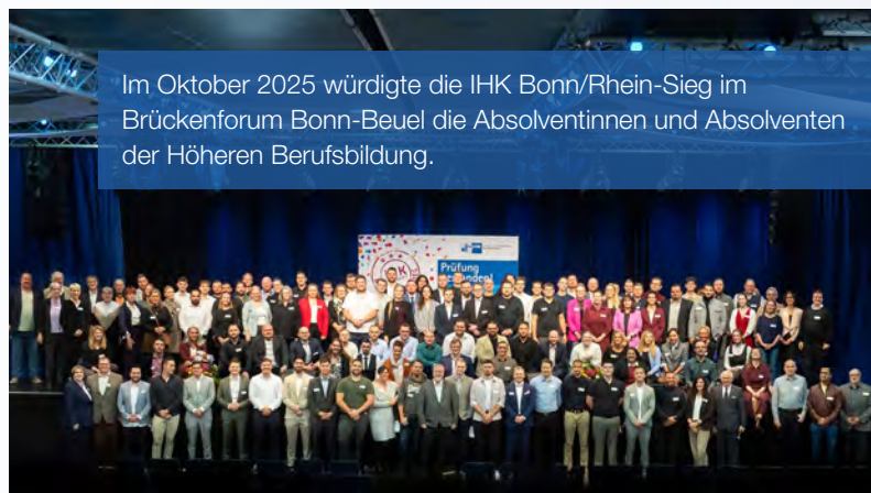
Im Oktober 2025 würdigte die IHK Bonn/Rhein-Sieg im Brückenforum Bonn-Beuel die Absolventinnen und Absolventen der Höheren Berufsbildung.