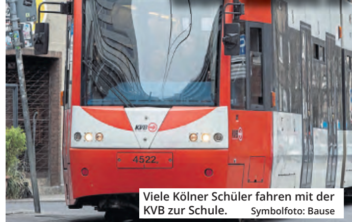
Viele Kölner Schüler fahren mit der KVB zur Schule.