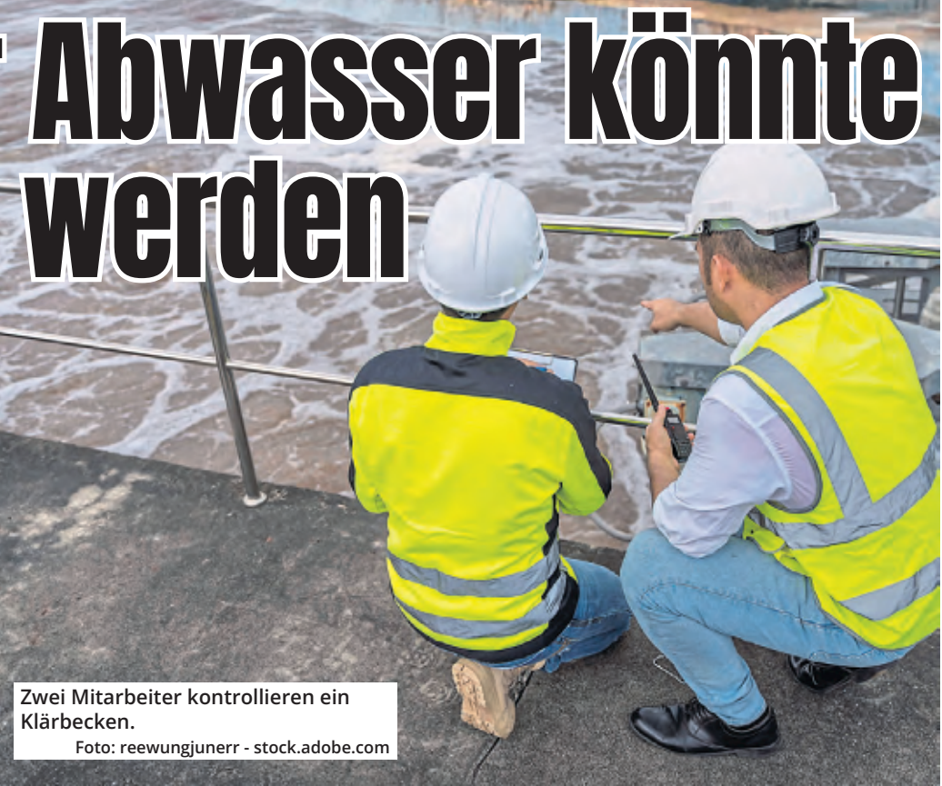
Zwei Mitarbeiter kontrollieren ein Klärbecken.

Köln. Die Kölnerinnen und Kölner sollen ab 2026 erneut mehr Abwassergebühren bezahlen. Das sehen die Pläne der Stadtentwässerungsbetriebe (StEB) vor, über die der Rat am 16. Dezember entscheiden soll. Demnach müsste eine vierköpfige Familie mit einem statistischen Schmutzwasseranfall von 200 Kubikmetern und einem Einfamilienhaus mit Kanalanchluss 532,70 Euro im Jahr zahlen. Dieses Jahr waren es nur 497,60 Euro. Das entspricht einem Anstieg von 35,10 Euro (plus 7,1 Prozent). Eine StEB-Sprecherin teilte mit, dass es „diverse Ursachen“ gebe. Unter anderem sind ihrer Aussage nach die Materialkosten, Finanzierungskosten in Form von Zinsen sowie die Personalkosten gestiegen. Laut der Sprecherin decken die Gebühren aber nicht den Aufwand, und Köln gehöre damit zu den günstigen Kommunen im Vergleich. Tatsächlich lag Köln laut ei-