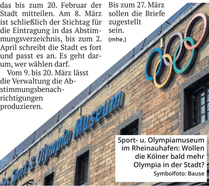
Sport- u. Olympiamuseum im Rheinauhafen: Wollen die Kölner bald mehr Olympia in der Stadt?

Bis zum 27. März sollen die Briefe zugestellt sein. (mhe.)