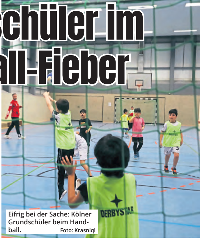
Eifrig bei der Sache: Kölner Grundschüler beim Handball.