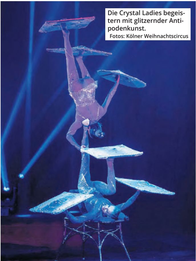
Die Crystal Ladies begeistern mit glitzernder Antipodenkunst.

tallen, ist zugleich kraftvoll und elegant – ein buchstäblich funkelnder Höhepunkt. Das Schönste an dieser Jubiläumsausgabe ist jedoch, wie alles nahtlos ineinandergreift: Musik, Licht, Tanz und Akrobatik verschmelzen zu einem stimmigen Gesamterlebnis. Das ist die Handschrift der im Zirkus geborenen und groß gewordenen Katja Smitt: Menschen etwas erleben zu lassen, wovon sie nicht wussten, dass sie es fühlen können. Nach zehn Jahren ist der Kölner Weihnachtscircus zu einer Tradition geworden, auf welche die Stadt stolz sein darf. Diese Jubiläumsausgabe beweist eindrucksvoll, dass Köln um eine Attraktion von echter Weltklasse reicher ist.