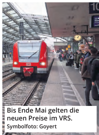
Bis Ende Mai gelten die neuen Preise im VRS.

Die Kurzstrecke erhöht sich um zehn Cent auf 2,80 Euro, die Preisstufen 1a und 1b – letztere gilt für die Stadtgebiete von Köln und Bonn – werden ebenfalls zehn Cent teurer, kosten ab Januar 3,20 (Bonn) und 3,80 Euro (Köln). Fahrgäste, die ihre Tickets über die VRS-App auf dem Smartphone kaufen, kommen etwas preiswerter davon. Die neuen Preise gelten nur bis zum 30. Mai.