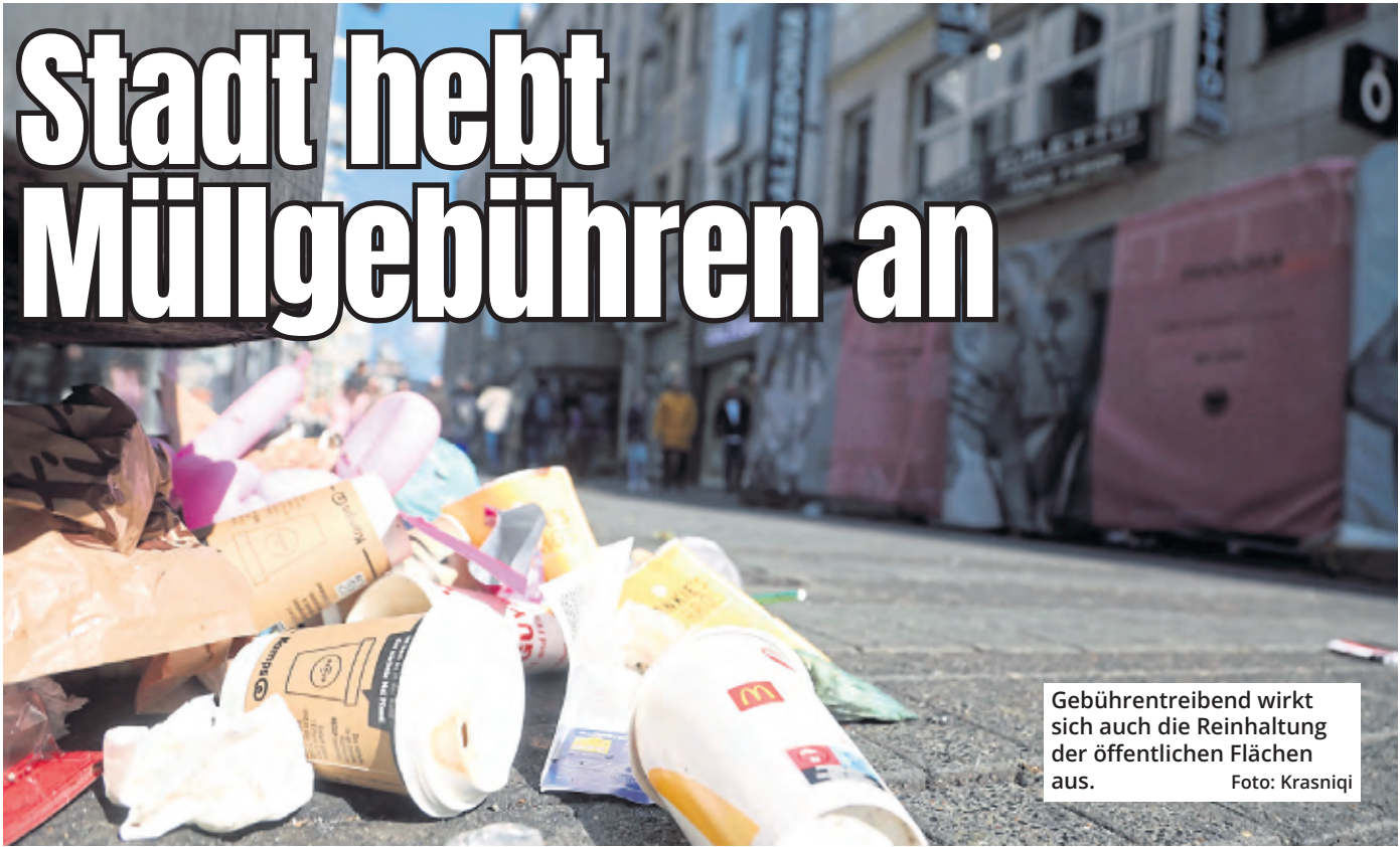
Gebührentreibend wirkt sich auch die Reinhaltung der öffentlichen Flächen aus.

Köln. Die Stadt Köln will im kommenden Jahr die Abfallgebühren deutlich anheben. Laut einer Beschlussvorlage für den Stadtrat steigen die Gebühren 2026 im Durchschnitt um 12,37 Prozent gegenüber dem Vorjahr – je nach Größe und Art des Abfallbehälters. Nach den neuen Satzungen sind damit zum Beispiel im Teilservice für eine 60-Liter-Tonne 428,76 Euro statt wie bisher 382,58 Euro. Für eine 120-Liter-Tonne 1047,54 Euro statt 924,06 Euro. Im Vollservice kostet eine 60-Liter-Tonne 499,54 Euro (zuvor 451,19 Euro), die 120-Li-