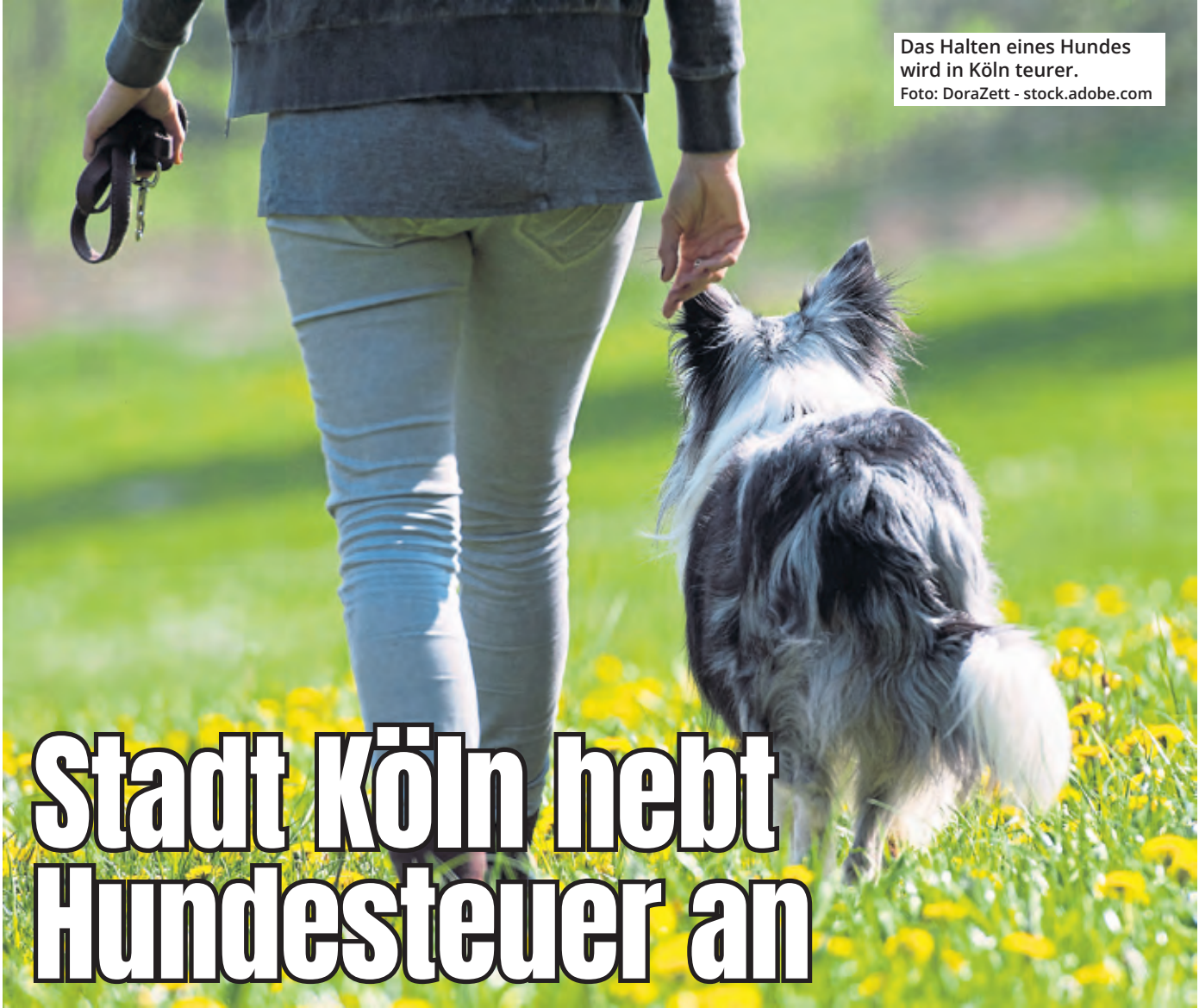
Das Halten eines Hundes wird in Köln teurer.