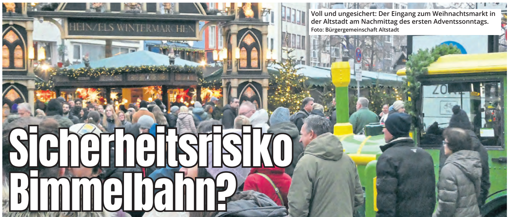
Voll und ungesichert: Der Eingang zum Weihnachtsmarkt in der Altstadt am Nachmittag des ersten Adventssonntags.