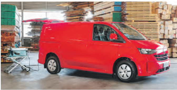
Transporter bietet viele Laderraum- und Antriebskombinationen

Köln – Höchste Vielfalt für ein maximales Einsatzspektrum – der neue Transporter von Volkswagen Nutzfahrzeuge bietet gegenüber seinem Vorgänger ein größeres Angebot an Karosserie-, Laderraum- und Antriebskombinationen. Das neue Spektrum reicht vom Kastenwagen in diverseren Varianten über den Transporter Pritschenwagen mit Doppelkabine bis hin zum Caravelle Style. Antriebsseitig kommen effiziente Turbodiesel- und E-Motoren zum Einsatz – zudem steht ein Plug-in-Hybridantrieb zur Verfügung. Darüber hinaus kann der Transporter mit Allradantrieb (4MOTION) bestellt werden. Darüber hinaus punktet die neue Transporter Generation mit fünf Jahren Neuwagen-Garantie sowie einem der dichtesten Service-Netze Europas.