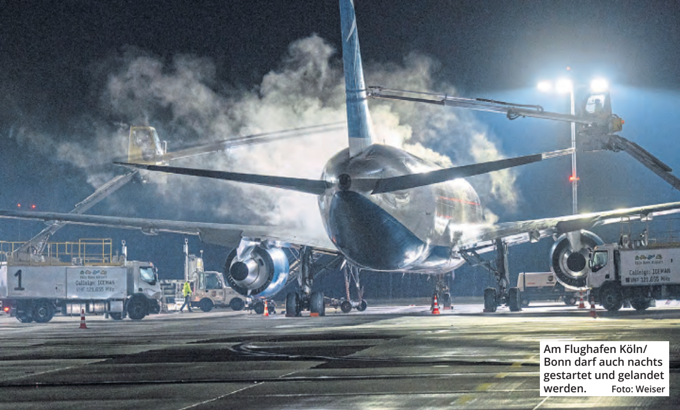
Am Flughafen Köln/Bonn darf auch nachts gestartet und gelandet werden.

Nachts sind es 3108,91 Euro, tagsüber mit Rabatten 346,31 Euro. Und auch ohne Rabatte ist das Flughafenentgelt tagsüber günstiger als nachts. Unter der Woche würden regulär 1853,51 Euro fällig werden, am Wochenende sind es 2346,31 Euro.