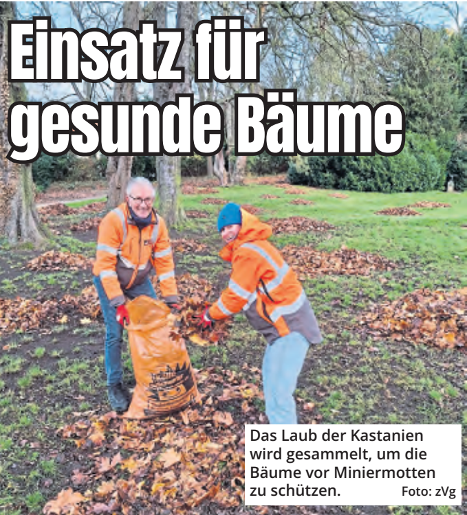
Das Laub der Kastanien wird gesammelt, um die Bäume vor Miniermotten zu schützen.

um erfuhr erst beim Dreh vom Drama um den Gründer der „California Sun“-Sonnenstudio-Kette: „Das ist bisher komplett an mir vorbeigegegangen.“ Bis zum 4. Dezember laufen noch die Dreharbeiten in Köln und Umgebung. Im kommenden Jahr wird dann das Kölner Krimi-Duo schon für den 100. Fall vor der Kamera stehen. 1997 legte das Erfolgsge-spann los. Welcher Fall im Jubiläum gelöst werden muss, steht noch in den Sternen. „Ich kenne noch kein Drehbuch. Vielleicht haben die Produzenten und die Regie etwas Besonderes vor. Wir werden es sehen und sind gespannt. Ich bin mir sicher, es wird nichts Schlechtes“, sagte Bär zu EXPRESS. In diesen Wochen ist Köln ohnehin wieder Tatort-Hochburg. Für die Ermittler-Teams aus Münster und Dortmund liefern ebenfalls Dreharbeiten in der Stadt.