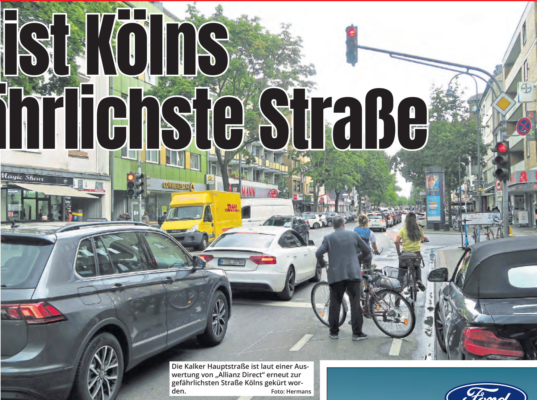
Die Kalker Hauptstraße ist laut einer Auswertung von „Allianz Direct“ erneut zur gefährlichsten Straße Kölns gekürt worden.

Bereits 2023 war die Kalker Hauptstraße die unfallreichste Straße Kölns – damals mit 55 Unfällen. Die Methodik der Allianz ist allerdings umstritten, da sich die ausgewerteten Straßen stark in Größe und Verkehrsbelastung unterscheiden können. Um sie dennoch vergleichbar zu machen, wurden die Daten nach Postleitzahlbereichen aufgeschlüsselt. Doch selbst das reichte nicht, sagte ADAC-Verkehrsexperte Roman Suthold bereits im vergangenen Jahr: „Selbst wenn man die Straßen nach Postleitzahlen unterteilt, sind die Unterschiede zwischen einzelnen Straßen zu groß, um