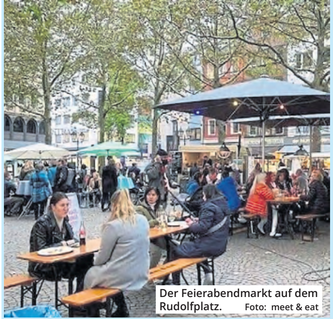
Der Feierabendmarkt auf dem Rudolfplatz.