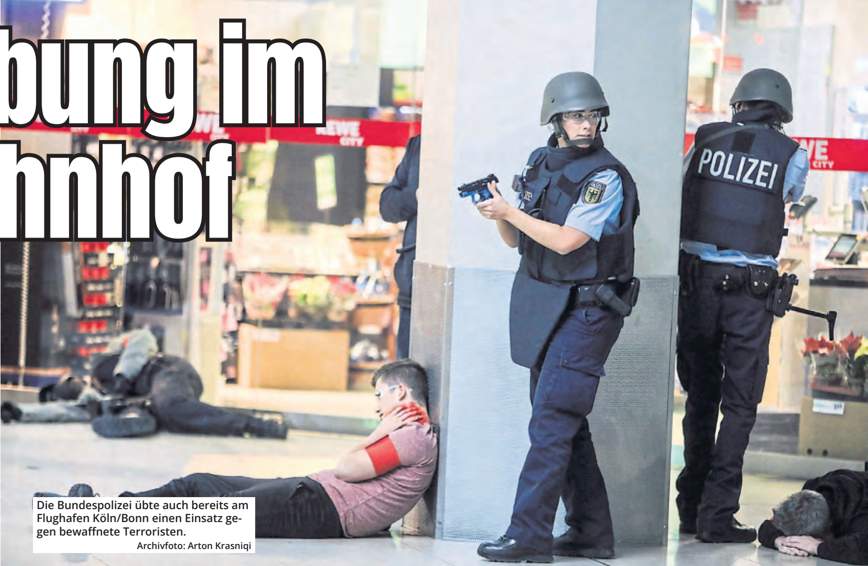
Die Bundespolizei übte auch bereits am Flughafen Köln/Bonn einen Einsatz gegen bewaffnete Terroristen.

Ein Jahr lang haben Planer die Übung vorbereitet. Federführend war die Bundespolizeidirektion St. Augustin, die auch für den Bereich Köln zuständig ist. Ähnliche Übungen gab es in den vergangenen Jahren zum Beispiel an den Flughäfen in Köln und Düsseldorf sowie