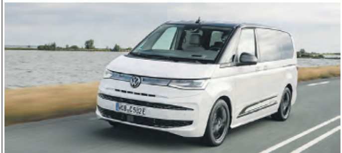
Plug-in-Hybrid und Allrad für den Multivan

zu 6 Sitzplätze), den Kastenwagen mit L-Trennwand (bis zu 5 Sitzplätze) für den Transport von Crew und sehr langen Gegenständen, den verglasten Kombi für den Güter- oder Personentransport, den Pritschenwagen mit 4,2 m² Lade- und Doppelkabine (6 Sitzplätze) und den Caravelle für den gewerblichen Personentransport (9 Sitzplätze). WMD