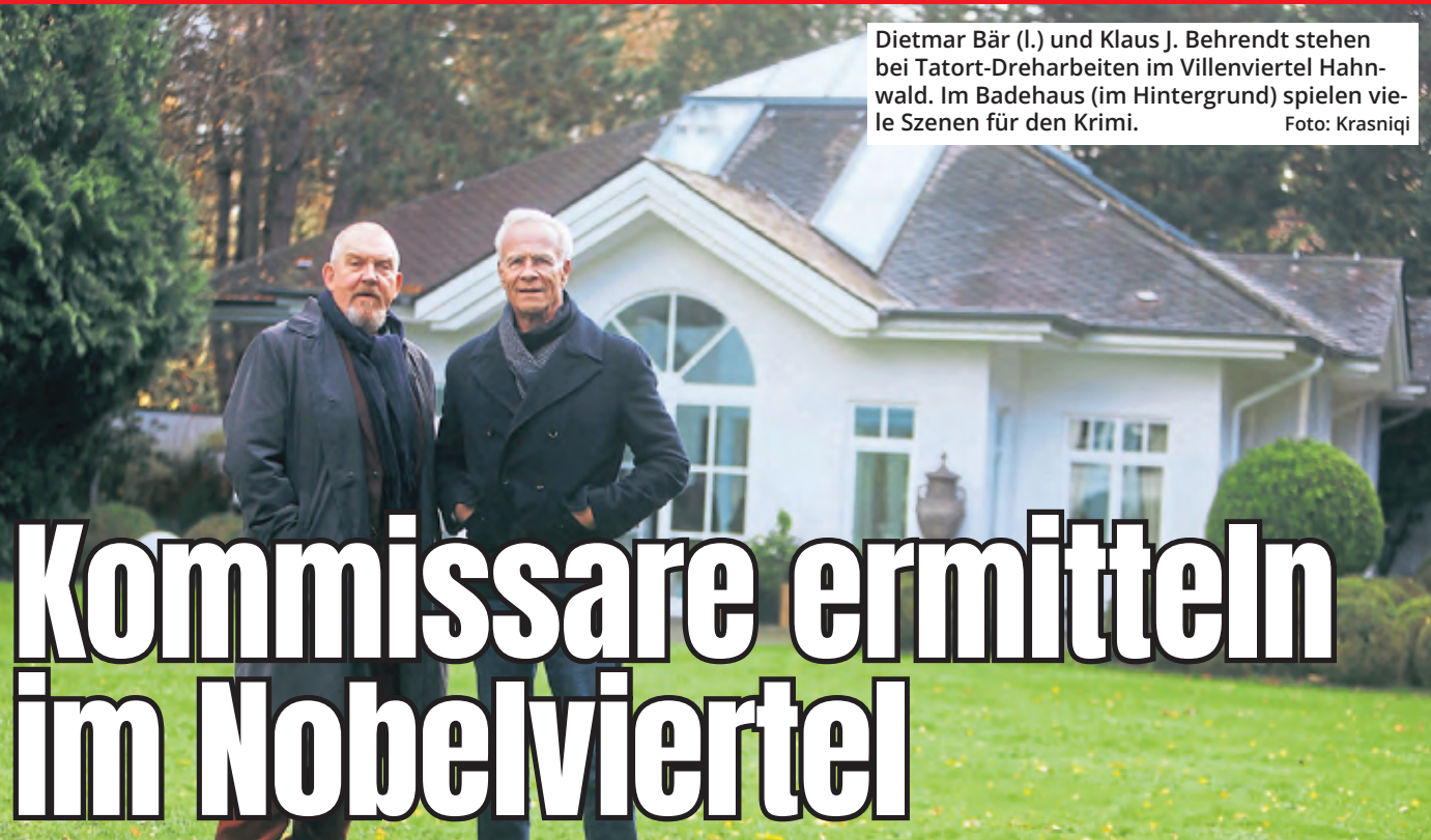
Dietmar Bär (l.) und Klaus J. Behrendt stehen bei Tatort-Dreharbeiten im Villenviertel Hahnwald. Im Badehaus (im Hintergrund) spielen viele Szenen für den Krimi.