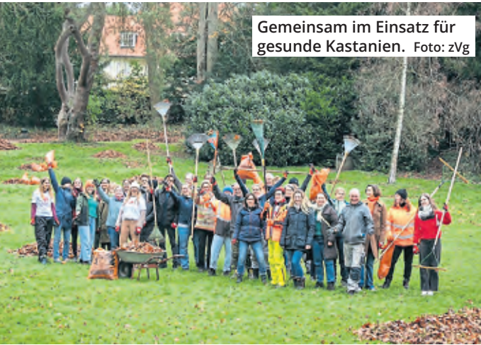
Gemeinsam im Einsatz für gesunde Kastanien.