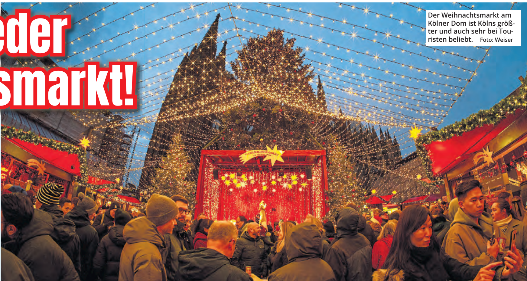
Der Weihnachtsmarkt am Kölner Dom ist Kölns größter und auch sehr bei Touristen beliebt.

Zu beachten: Bei einigen Märkten in dieser Aufzählung fehlen noch Teilangaben, die bis Redaktionsschluss nicht bekannt waren. Außerdem erhebt die Liste keinen Anspruch auf Vollständigkeit und ist natürlich ohne Gewähr.