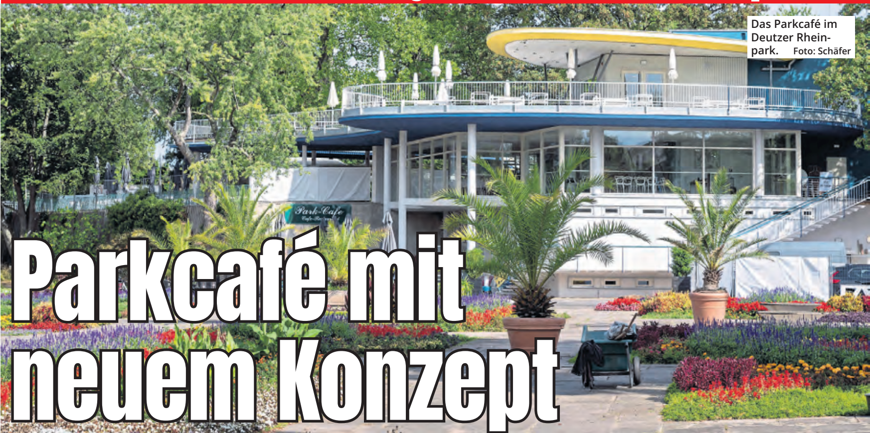
Das Parkcafé im Deutzer Rheinpark.