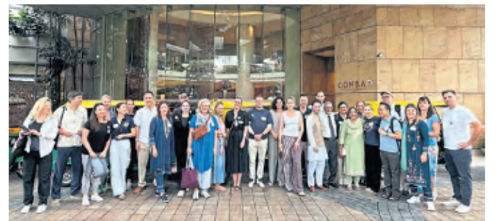
Das deutsche Team, bestehend aus medizinischen Kräften und der Kabinen-Crew, vor Abfahrt zur ersten Schule.