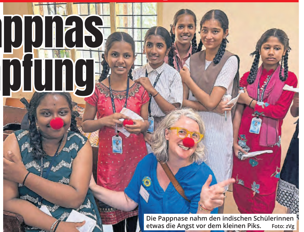
Die Pappnase nahm den indischen Schülerinnen etwas die Angst vor dem kleinen Piks.

Der Erfolg der Aktion beruhte auf einem starken Netzwerk.