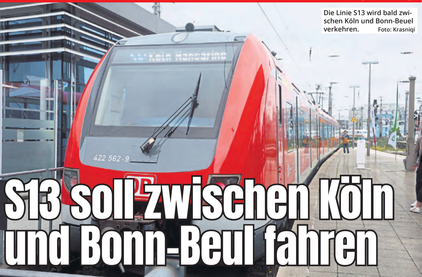
Die Linie S13 wird bald zwischen Köln und Bonn-Beuel verkehren.

Ein Arbeitskreis aus Kommunen, Politik und go.Rheinland hat zwei Betriebskonzepte erarbeitet, mit denen Bonn-Beuel bereits ab Ende 2026 erstmals direkt an das S-Bahn-Netz angebunden werden soll. Der Hauptausschuss empfiehlt nun ein stufenweises Vorgehen – ein wichtiger Schritt, um trotz laufender Bauprojekte neue Direktverbindungen nach Köln zu ermöglichen.