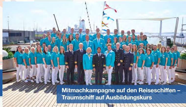
Mitmachkampagne auf den Reiseschiffen – Traumschiff auf Ausbildungskurs

Nutzen Sie die kostenlosen Werbemittelpakete, um mit Ihrem Ausbildungsmarketing Flagge zu zeigen – online, vor Ort oder auf Messen.