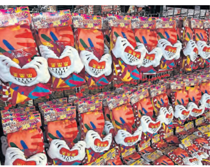
Der jecke Schal ist sofort verfügbar und auf 50.000 Stück limitiert.

Die dreidimensionalen Hände formen ein Herz rund um das kölsche Stadtwappen. Zudem gibt es auch wieder eine integrierte Tasche. „Zusammenhalt und Anstand sind in