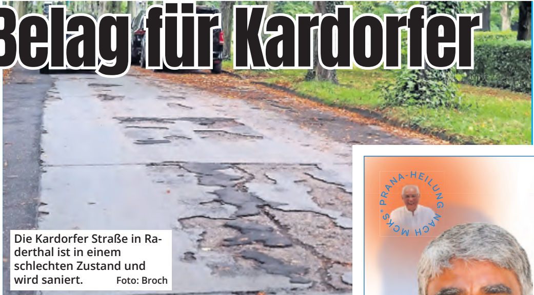
Die Kardorfer Straße in Raderthal ist in einem schlechten Zustand und wird saniert.

Raderthal. Schlaglöcher, Risse und Absackungen – die Kardorfer Straße in Raderthal ist in einem schlechten Zustand. Um die Verkehrssicherungspflicht zu erfüllen und die Substanz zu erhalten, will die Stadt die Straße zwischen der Rösberger Straße und der Hausnummer 17 general-sanieren. Der Fahrbahnbelag soll komplett erneuert werden, ebenfalls sollen die Entwässerungsanlagen wie Sinkkästen und Sinkkastenleitungen saniert werden. Des Weiteren soll die Straße im genannten Abschnitt eine neue Beleuchtung bekommen. Die Kosten für die Sanierung belaufen sich laut Stadt auf voraussichtlich rund 612.000 Euro.