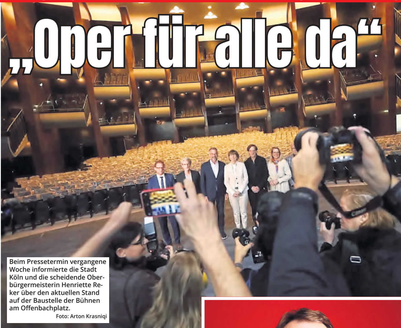
Beim Pressetermin vergangene Woche informierte die Stadt Köln und die scheidende Oberbürgermeisterin Henriette Reker über den aktuellen Stand auf der Baustelle der Bühnen am Offenbachplatz.