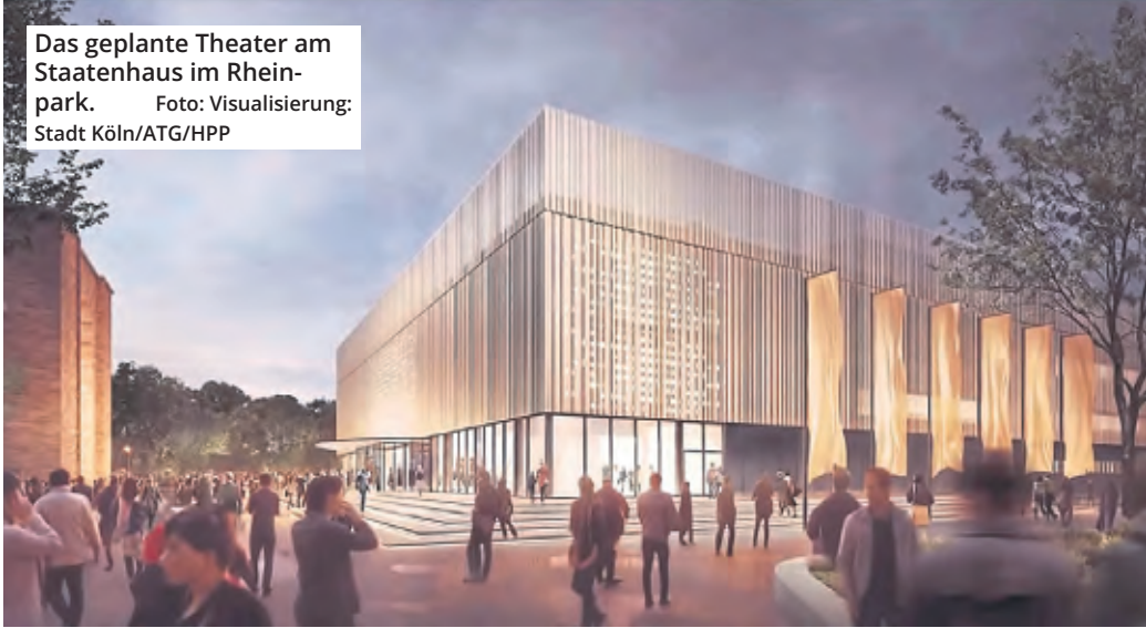
Das geplante Theater am Staatenhaus im Rheinpark. Foto: Visualisierung: Stadt Köln/ATG/HPP

So könnte 2026 tatsächlich das Jahr werden, in dem Köln nicht nur endlich wieder eine feste Oper hat, sondern auch ein neues Zuhause für die großen MusicalsShows zementiert. Nach Jahren der Baustellen-Schmach wächst am Rhein wieder etwas, das die Stadt zusammenbringen soll: Kultur für alle. (mit red/ bn.)