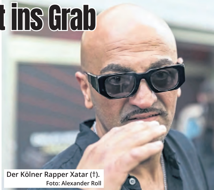
Der Kölner Rapper Xatar (†).