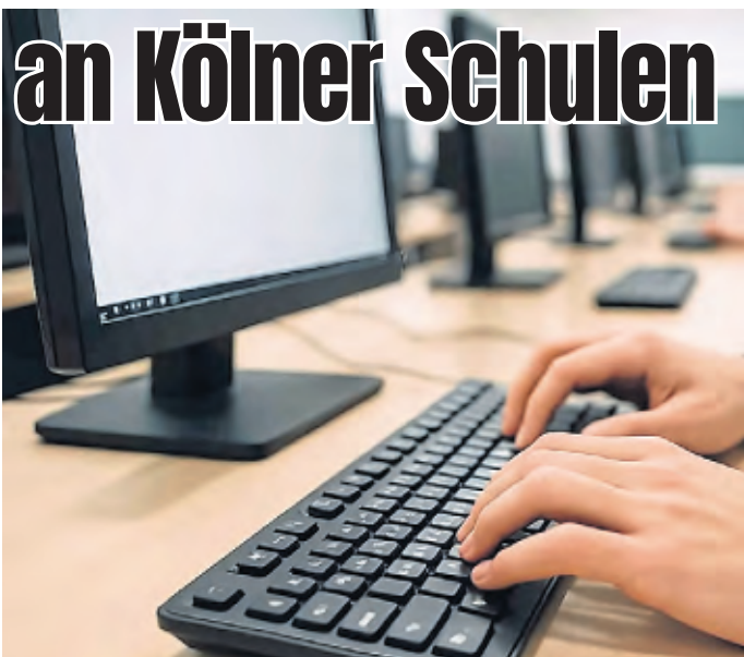
Künstliche Intelligenz erstreckt sich auf viele Bereiche unseres Lebens. Auch auf die Schule.

Köln. Künstliche Intelligenz verändert unser Leben – und nun auch die Kölner Schulen. Mit der „Innovationswerkstatt „Den Wandel gestalten! Schule trifft KI“ startet das Kommunale Medienzentrum der Stadt Köln (KOMEZ) ein Projekt, das Schulentwicklung im digitalen Zeitalter ganz neu denkt. Sieben Schulen aus unterschiedlichen Stadtteilen nehmen daran teil, begleitet von Fachleuten, die Impulse geben, zuhören und mitdiskutieren. In fünf Werkstatt-Terminen arbeiten Lehrkräfte, Schulleitungen und Experten Hand in Hand. Sie reden über Chancen und Risiken, über neue Unterrichtsformen; und natürlich auch über das, was Schule künftig leisten muss, wenn