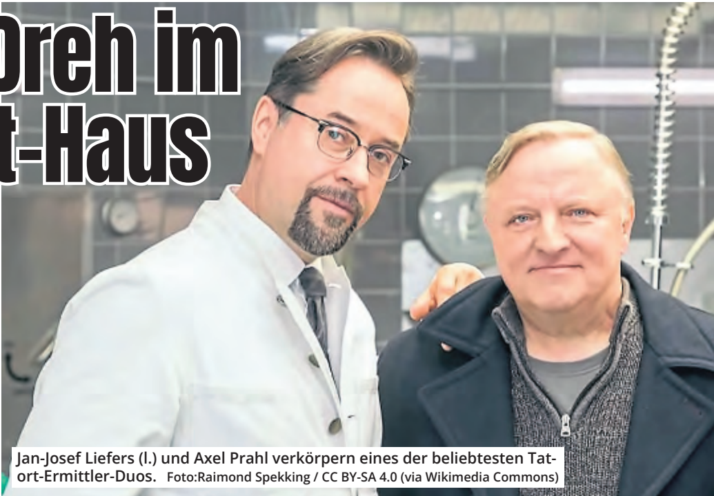
Jan-Josef Liefers (l.) und Axel Prahl verkörpern eines der beliebtesten Tatort-Ermittler-Duos.

An vier Tagen im September entstanden in Konferenzräumen und auf dem Gelände der ehemaligen Druckerei Szenen für den neuen TV-Krimi, der den Arbeitstitel „Maskerade“ trägt. Die Story spielt passenderweise während des