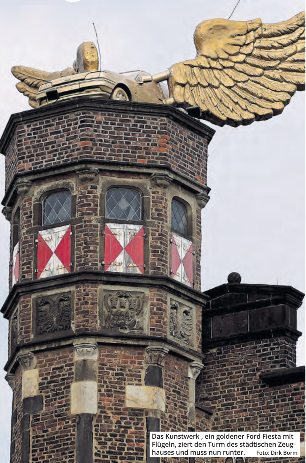
Das Kunstwerk, ein goldener Ford Fiesta mit Flügeln, zielt den Turm des städtischen Zeughauses und muss nun runter.

Allerdings: Das Landgericht hat im Streit um das Flügelauto zuletzt im Eilverfahren entschieden, dass die Stadt Eigentümer des Kunstwerks sei. Das dürfte für die Frage, wo das Kunstwerk möglicherweise zu sehen ist, wichtig werden. Schult scheiterte vor dem Landgericht Köln mit seinem Antrag auf eine einstweilige Verfügung gegen die Entfernung seines Flügelaautos vom Turm des Zeughauses. Wie berichtet, steht der umgestaltete Ford Fiesta mit den goldenen Flügeln seit 1991 auf dem Dach des Treppenturms des Zeughauses in der Innenstadt. Dort war viele Jahrzehnte das Kölnische Stadtmuseum (KSM) beheimatet, bevor das denkmalgeschützte Zeughaus aufgrund eines Wasserschadens nicht mehr nutzbar war. Mittlerweile stellt das Museum im umgebauten früheren Modehaus Sauer aus. In einem Brief hatte Kulturdezernent Stefan Charles HA Schult mitgeteilt, „dass das Flügelauto vom Turm abgenommen werden muss, um langfristig einen Einsturz des Turmes zu vermeiden“. Laut Stadt handelt es sich um eine Präventionsmaßnahme, um den Turm und Passanten zu schützen. Bis die Stadt das Auto möglicherweise an anderer Stelle aufstellt, sei eine „temporäre Einlagerung“ in einem Museumsdepot „unabdingbar“, auch eine Restaurierung sei nötig.