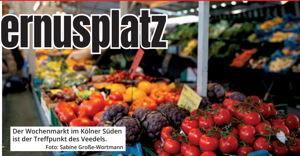
Der Wochenmarkt im Kölner Süden ist der Treffpunkt des Veedels.

se sind das Markenzeichen der Kölner Wochenmärkte. Dieses Event unterstreicht eindrucksvoll die Philosophie der Kölner Wochenmärkte: das Angebot von frischen und hochwertigen Lebensmitteln in einer Auswahl, die ihresgleichen sucht. Von regionalem Obst und Gemüse über erlesene Käse- und Wurstspezialitäten bis hin zu frischem Fisch und duftenden Backwaren – die Markt-