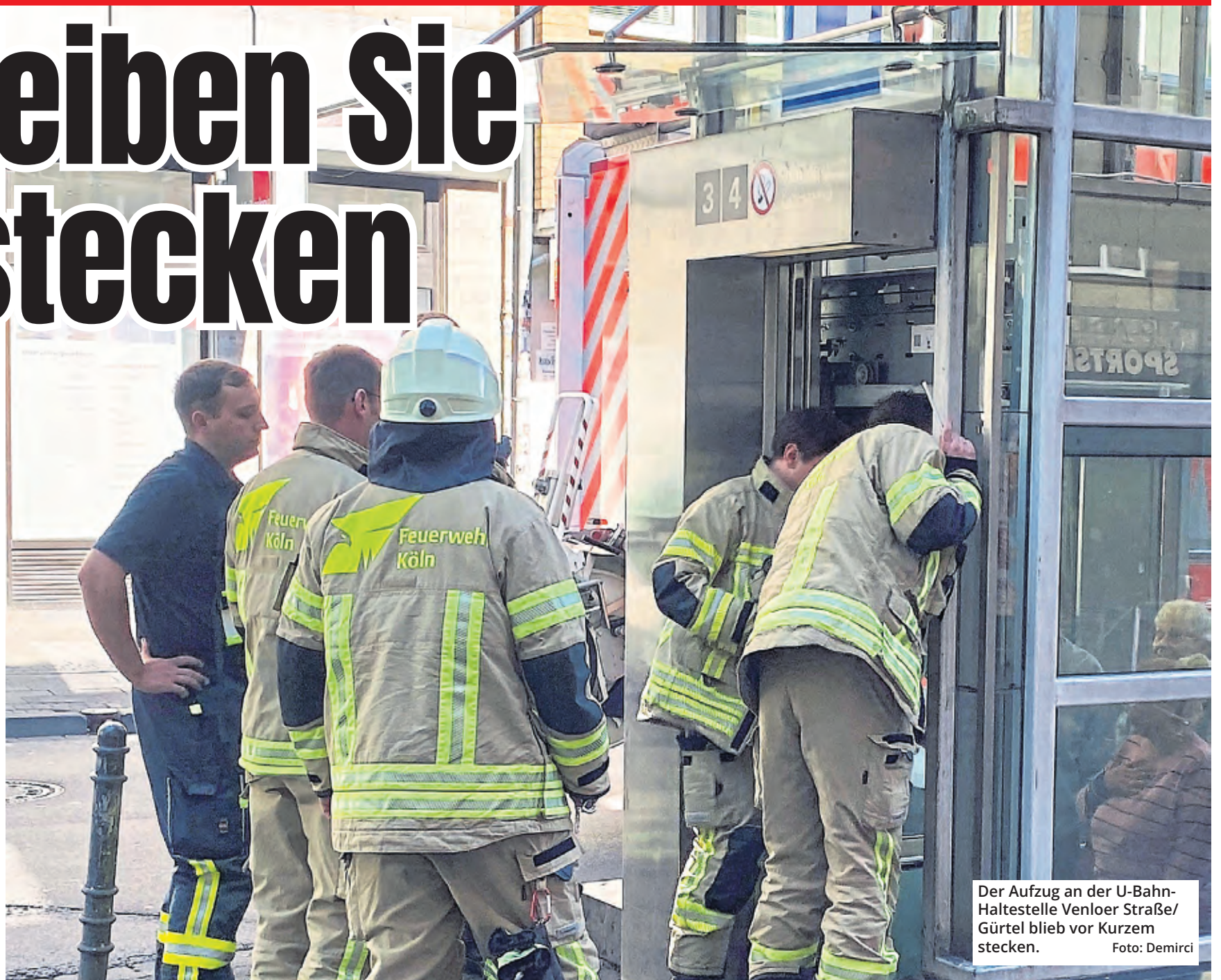
Der Aufzug an der U-Bahn-Haltestelle Venloer Straße/Gürtel blieb vor Kurzem stecken.