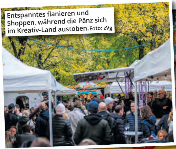
Entspanntes flanieren und Shoppen, während die Pänz sich im Kreativ-Land austoben.