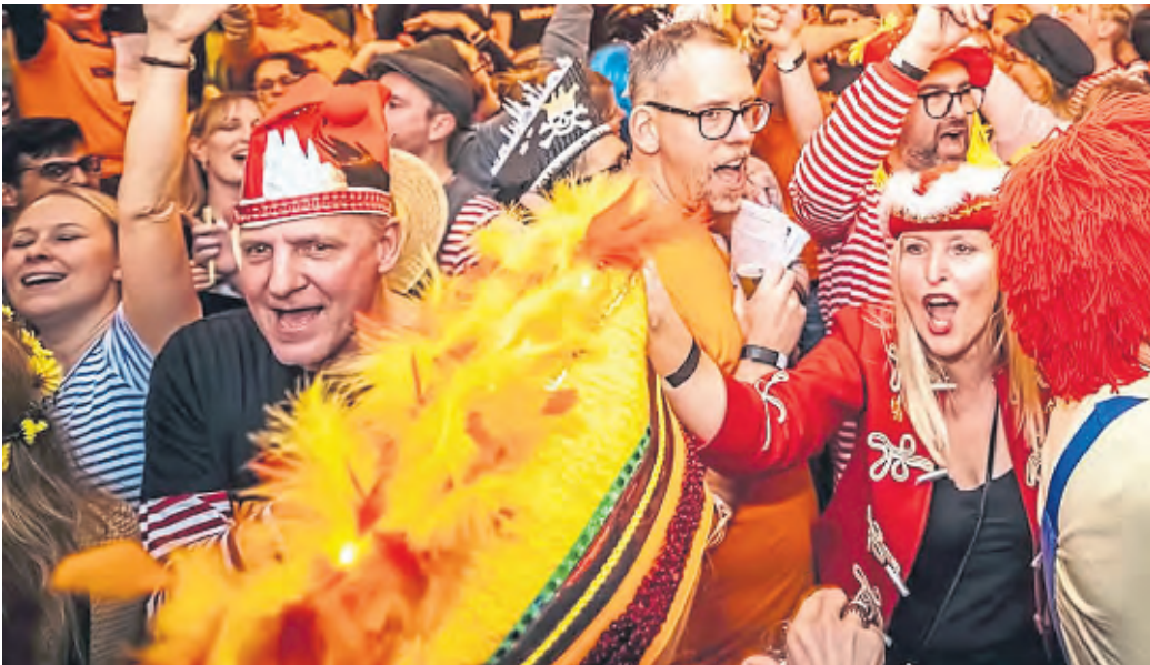
„Loss mer singe“: Im Lapidarium startete die Mitsingbewegung, die heute auch außerhalb Kölns viele Fans hat.

gen: Das Kneipen-Publikum will Lieder, die man sich nicht erst schöntrinken muss. „Sobald du Leute mit Textzetteln versorgst, werden sie sensibler“, sagt Hinz. Songs wie „Nit alles, wat e Loch hät, es kapott“ würden es heute erst gar nicht in die Auswahl schaffen. Auch „Dicke Mädchen haben schöne Namen“, 2001 auf Platz zwei gewählt, würde heute vielleicht kritischer gesehen, mutmaßt Hinz. „Fakt ist, dass man heute noch genauer hinhört. Und das wissen auch die Bands“, sagt Hinz. 2008 wurde ein Verein gegründet, aus der wachsenden Büroarbeit entstand eine Halbtagsstelle – ansonsten sind alle Aktiven weiterhin ehrenamtlich unterwegs. Die Erlöse aus Veranstaltungen kommen Sozial- oder Hilfsprojekten zugute. Das 25-jährige Bestehen wird am 3. Oktober im Herbrand's gefeiert. Ab 17 Uhr gibt es unter anderem eine Talkrunde mit zahlreichen Musikern wie Brings, Björn Heuser und Basti Campmann. Für die anschließende Party ab 19.30 Uhr mit Auftritten von Lupo und Fiasko gibt es noch Restkarten für 15 Euro, zuzüglich Gebühren.