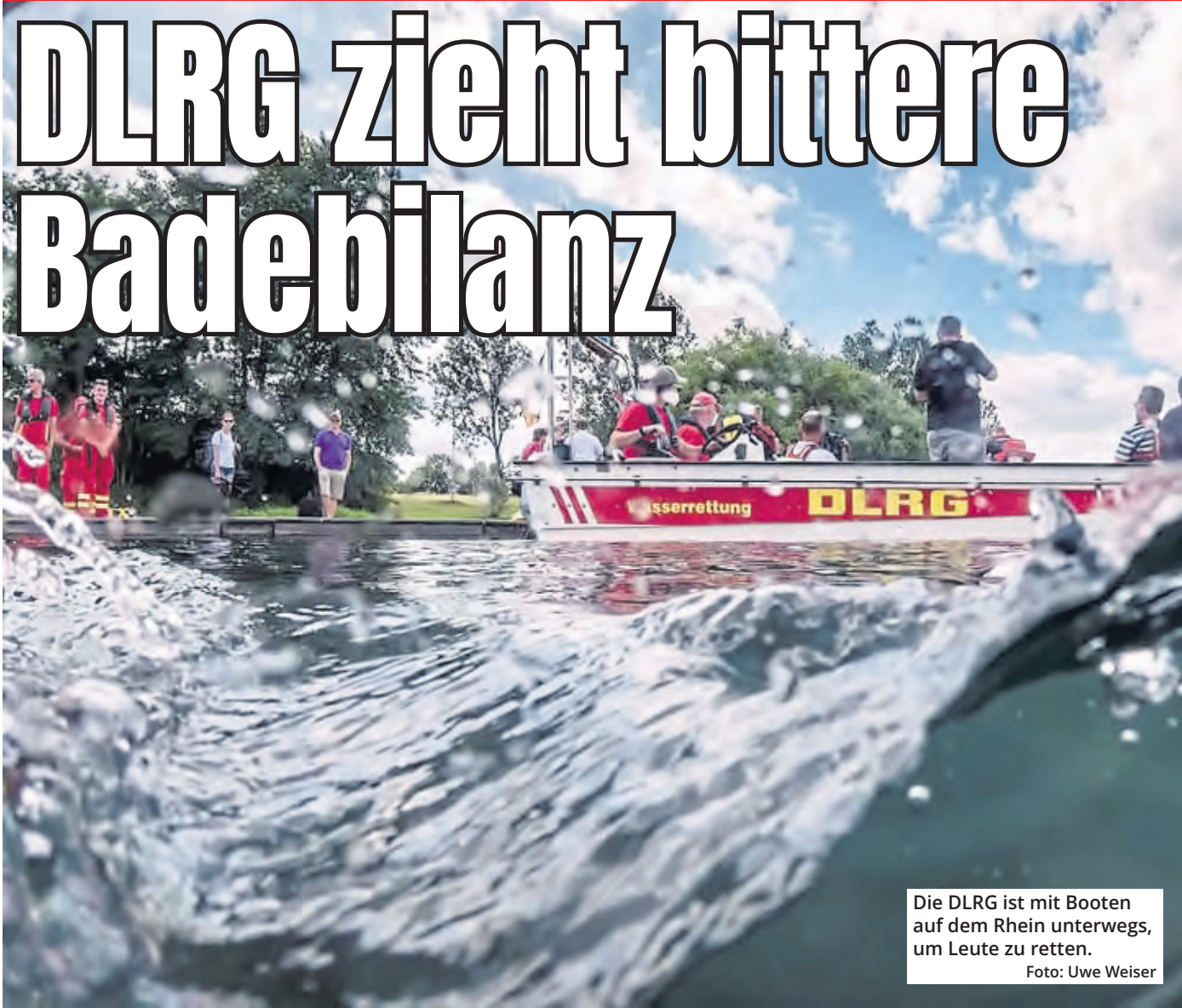
Die DLRG ist mit Booten auf dem Rhein unterwegs, um Leute zu retten.

Köln. In der vergangenen Badesaison sind in Nordrhein-Westfalen weniger Menschen ertrunken als im Vorjahreszeitraum. Im Zeitraum von Mai bis Mitte September zählte die Deutsche Lebensrettungsgesellschaft (DLRG) laut Sommerbilanz 27 Badetote in nordrhein-westfälischen Gewässern und Bädern. Im Vorjahreszeitraum waren es 34 Personen. Blickt man auf das gesamte laufende Jahr bis Mitte Septem-