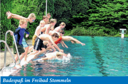
Badespaß im Freibad Stommeln