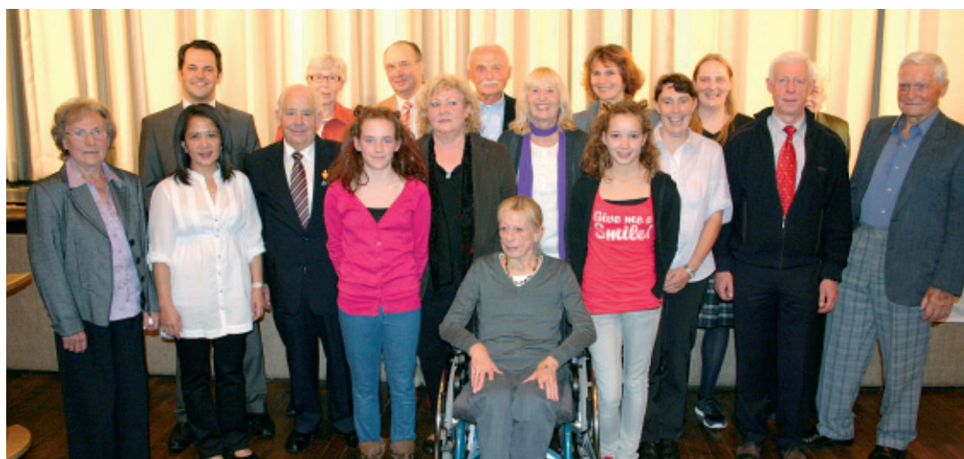
Ehrung von ehrenamtlich tätigen Pulheimerinnen und Pulheimern.

Stommelner Straße 145 DRK-Wache Sinnersdorf Tel.: 02238-503 30 DRK-Wache Pulheim Tel.: 02238-62 25 DRK-Kreisverband, Rhein-Erft-Kreis e. V., Zeppelinstr. 25, 50126 Bergheim Tel.: 02271-606-0