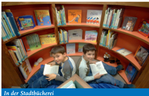
In der Stadtbücherei