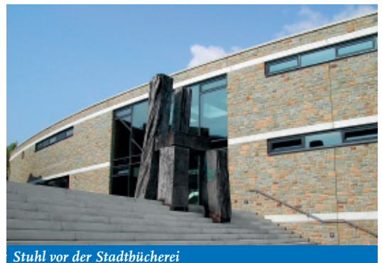
Stuhl vor der Stadtbücherei