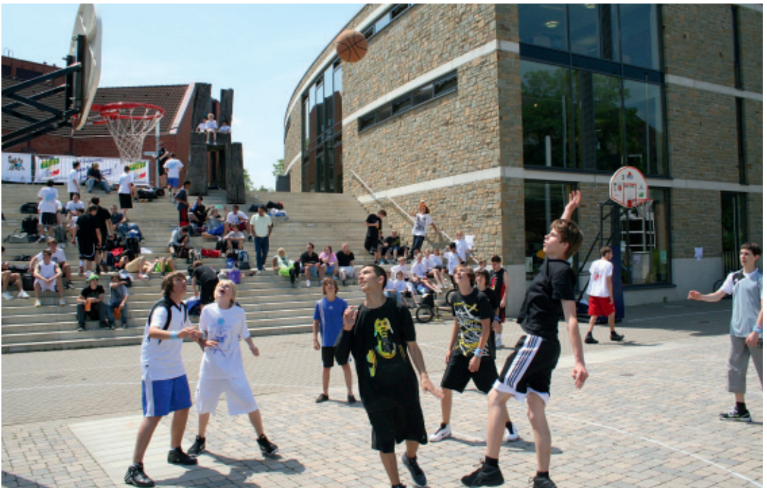
Streetbasketball auf dem Platz vor der Stadtbücherei

Jedes dreijährige Kind bekommt einen Kindergartenplatz und für die noch Jüngeren stehen mehr als 40 Eltern-Kind-Gruppen und 17 Spielgruppen zur Verfügung. 87 Spielplätze, die ständig gepflegt und erneuert werden, laden die Jungen und Mädchen in allen Stadtteilen zum Spielen ein. Jugendfreizeitstätten, Bolzplätze, Beachvolleyball-, Streetbasketball- und Skateranlagen sowie Spielstraßen ergänzen das Angebot. Die Stadt sorgt mit ihren Einrichtungen und Freizeitmaßnahmen für ein vielfältiges und breit gefächertes Angebot für Kinder und Jugendliche.