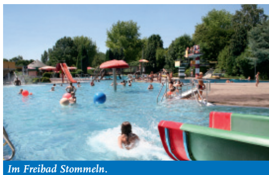
Im Freibad Stommeln.

Tel.: 02238-92 23 92 (geöffnet von Anfang Mai bis Anfang September) Vor den Sommerferien: Öffnungszeiten: Mo – Fr 11.00 – 20.00 Uhr Sa – So 9.00 – 18.00 Uhr (u. Feiertag) Während der Sommerferien: Öffnungszeiten: Mo – Fr 9.00 – 20.00 Uhr Sa – So 9.00 – 18.00 Uhr. (u. Feiertag)