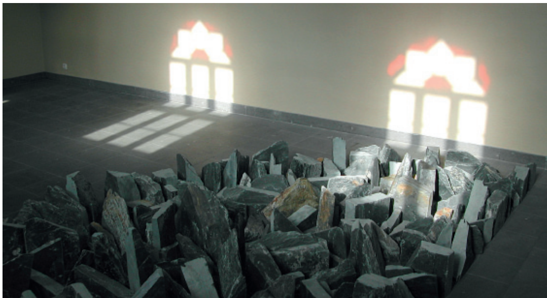
1991 ist das Kunstprojekt Synagoge Stommeln initiiert worden.

der 5. Jahreszeit: All dies sind gute Beispiele für den Gemeinschaftssinn der hier lebenden Menschen. Für die Fortbildung bietet die Volkshochschule viele Spezialkurse an. Lehrgänge für die berufliche Weiterbildung, Sprachkurse sowie Angebote für Hobby und Freizeit sind im Programm.