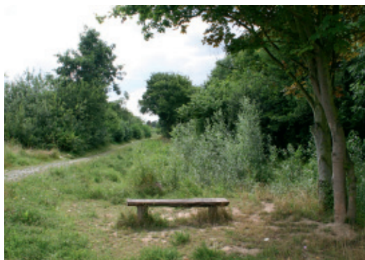
Am Pulheimer Bach

Viel Geld wird für den Ausbau und die Pflege von Fließgewässern ausgegeben. Der naturnahe Gewässerbau soll wieder eine Chance bekommen. Nach und nach werden hier frühere Entscheidungen revidiert, indem die begradigten und zum Teil durch Betonwannen fließenden Bäche durch Anlegen von Stillwasserzonen und teilweisen Rückbau renaturiert werden. Am Pulheimer Bach ist zwischen Glessen und Pulheim ein sehr schöner Erlebnispfad entstanden, der von dem Pulheimer Bachverband, der Universität Köln und vielen Pulheimer Schulen betreut wird.