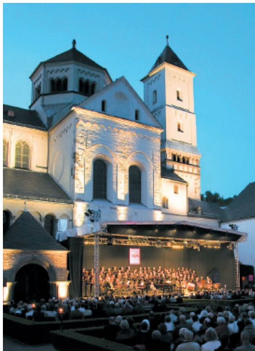
„Classic nights“ im Marienhof der Abtei Brauweiler

Das Gebiet um den heutigen Ort Brauweiler war nachweislich in der 2. Hälfte des 10. Jahrhunderts im Besitz des lothringischen Pfalzgrafen