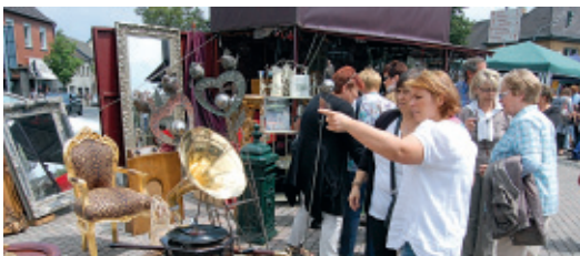
Trödelmarkt in Stommeln