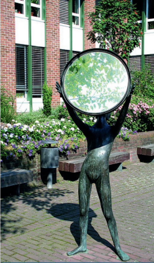
„Lichtempfänger“ im Rathaus Innenhof

für ca. 60.000 Menschen und mit dem höchsten Kaufkraftniveau aller Städte im Rhein-Erft-Kreis ist Pulheim ein wichtiger Markt.