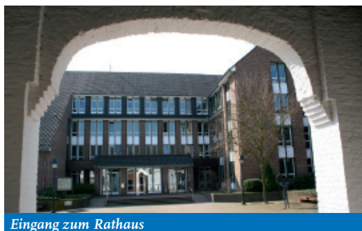
Eingang zum Rathaus