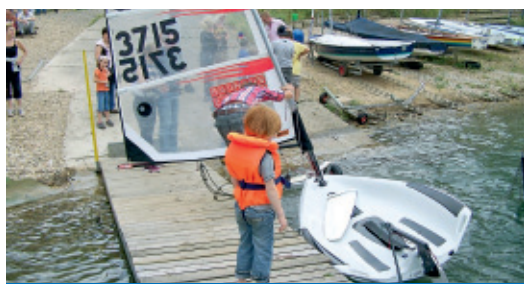
Segeln und Surfen auf dem Pulheimer See