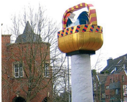
Hahn im Korb

Hauptstraße 75 50259 Pulheim-Stommeln Telefon 0 22 38/2659