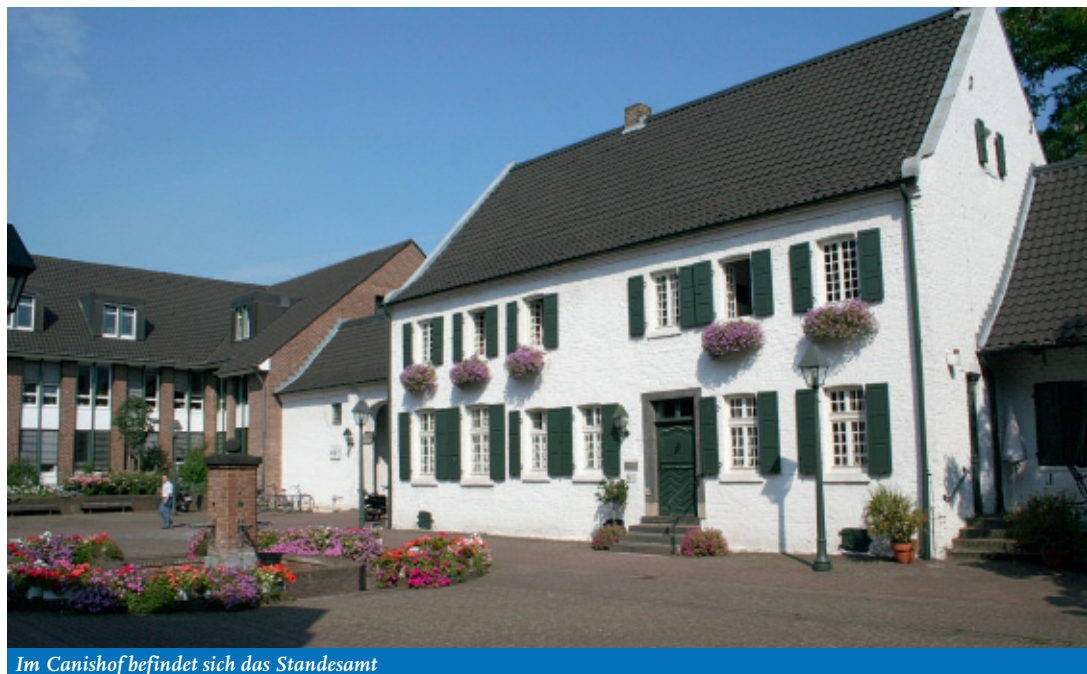
Im Canishof befindet sich das Standesamt