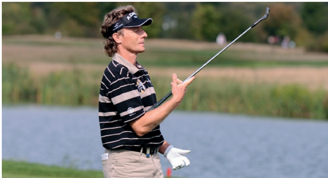
Golfstar Bernhard Langer im Golfclub Gut Lärchenhof in Stommelerbusch

Berichterstattung darüber in den nationalen und internationalen Medien hat den Bekanntheitsgrad der Stadt erheblich gesteigert.