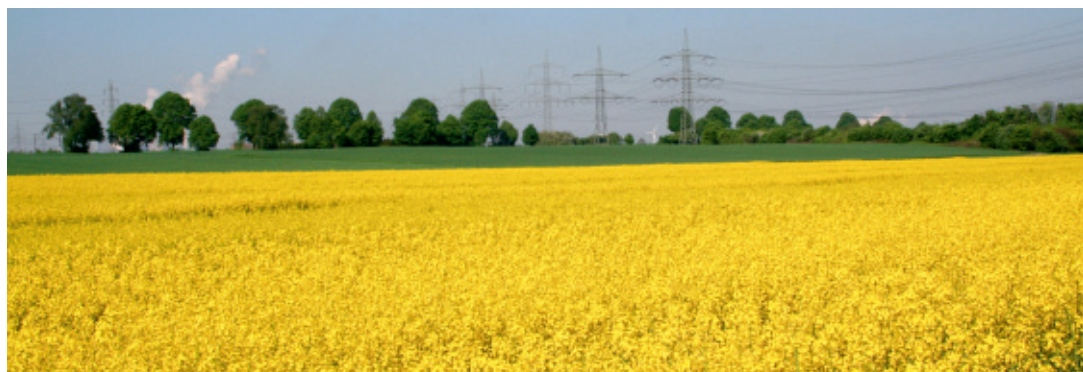
Im Nordpark Pulheim