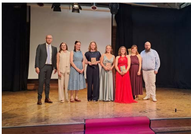
Nach drei Stunden und einem abschließenden Gruppenbild konnten das Moderatorenpaar die Gäste zum anschließenden Weinempfang einladen, dem würdigen Abschluss einer schönen Abschlussfeier. Erwähnt sei noch das hervorragende Catering des Jahrgangs Q1, der bei heißen Temperaturen ständig für Getränkenachschub in der Aula sorgte.