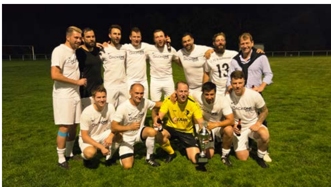
Im Bild der Sieger des Alt-Herren-Turniers, der 1. FC Krauthausen

Beim Alt-Herren-Turnier am Freitag sicherte sich der 1. FC Krauthausen im Finale mit einem 2:0 Sieg gegen des SV Niederzier den AH-Gemeindepokal. Im Spiel um Platz 3 trennte sich der SV SW Huchem-Stammeln und der BC Oberzier mit 1:1. und man einigte sich auf zwei dritte Plätze.