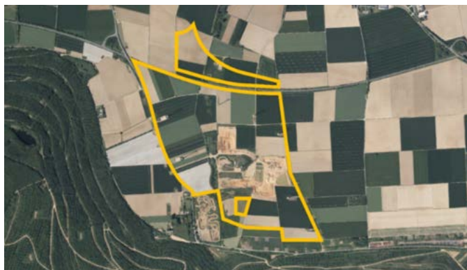
Abbildung 1: Luftbild mit Abgrenzung des räumlichen Geltungsbereichs (gelbe Linie), Land NRW 2024

Die Frühzeitige Beteiligung des Bebauungsplanes W 01 - 1. Änderung, „Windkonzentrationszone“ Gemarkung Steinstraß wird hiermit gemäß § 3 Baugesetzbuch ortsüblich bekannt gemacht.