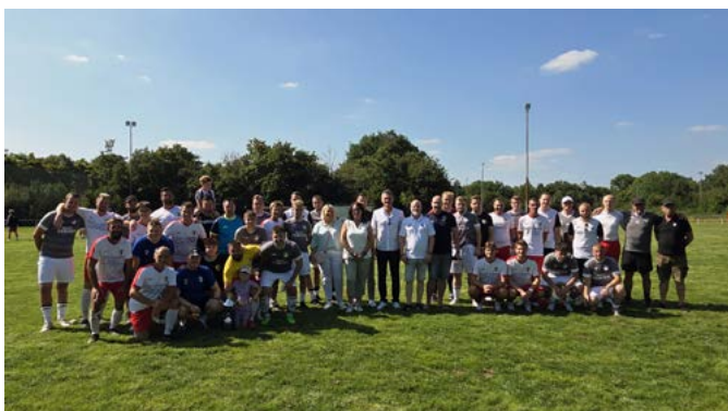
Im Bild die Senioren-Mannschaften des SV Niederzier und des 1. FC Krauthausen (Spiel um Platz 3 – Sparkassenpokal)

Hier auch ein großer Dank an die A-Jugend des JFV Sophienhöhe, die für die Mannschaft des SV Viktoria Ellen in der Vorrunde eingesprungen ist. Im Finale gewann der BC Oberzier nach spannenden, aber torlosen 90 Minuten im Elfmeterschießen mit 5:3 gegen den SV SW Huchem-Stammeln und ist somit neuer Titelträger des Gemeindepokals.