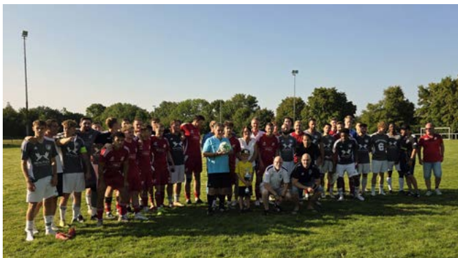
Im Bild die Senioren-Mannschaften des BC Oberzier und des SV SW Huchem-Stammeln (Finalisten um den Gemeindepokal)

Am vergangenen Wochenende 08.08. bis 10.08.2025 wurden auf der Sportanlage des SV Viktoria Ellen 1925 die Spiele um den Gemeindepokal 2025 ausgetragen.