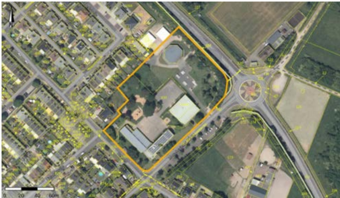
Abbildung 1: Luftbild mit Abgrenzung des räumlichen Geltungsbereiches (gelbe Linie), genordet Land NRW, 2025

Der Bebauungsplan bezieht sich auf den gekennzeichneten Geltungsbereich, dieser ist im folgenden Luftbild dargestellt: